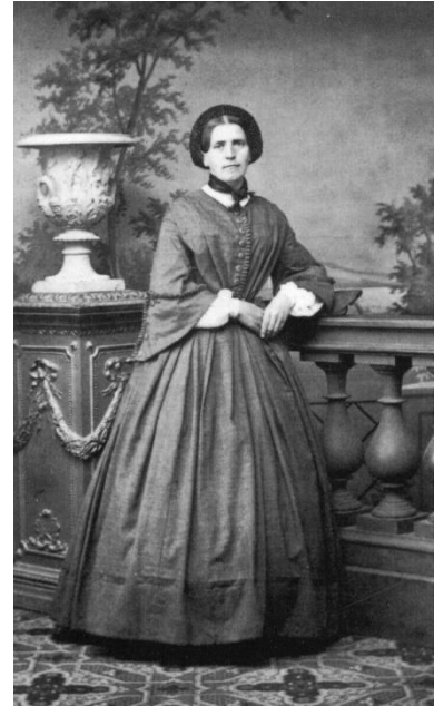
Abb.1 Johanna Spyri