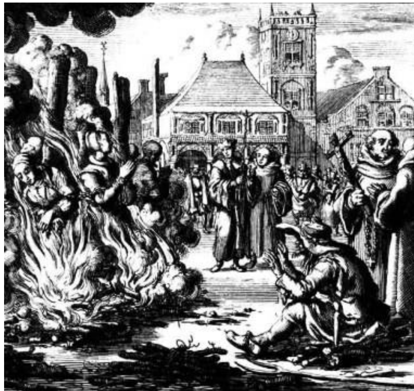
Prilog 4. Spaljivanje vještica