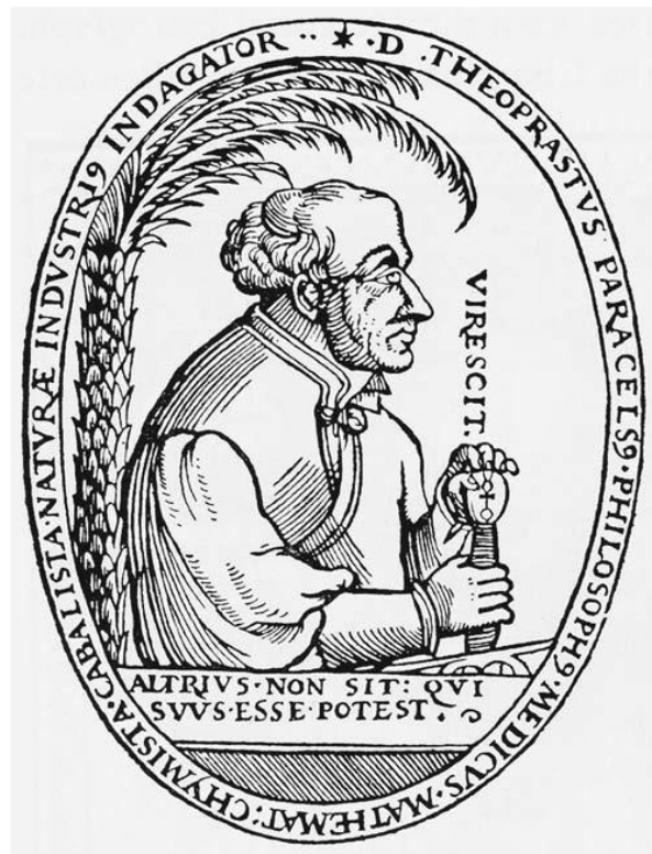
Prilog 8. Paracelsus