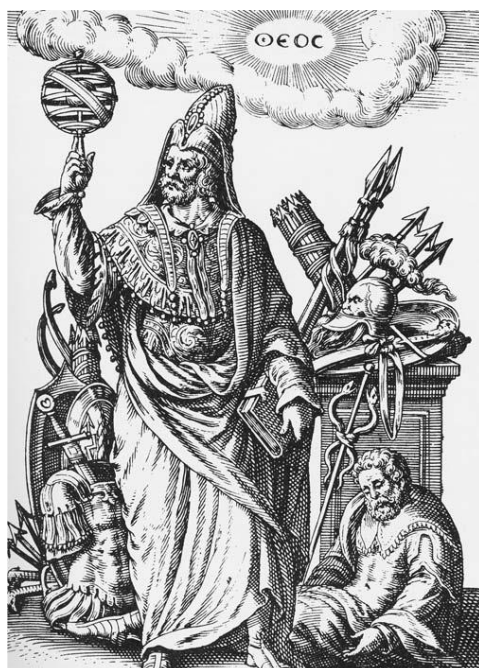
Prilog 2. Zamišljeni prikaz Hermesa Trismegistusa