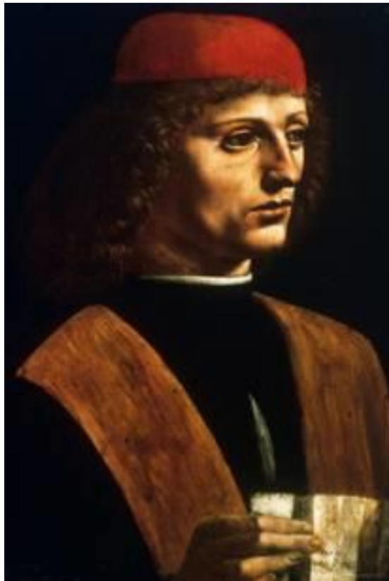
Prilog 6. Marsilio Ficino