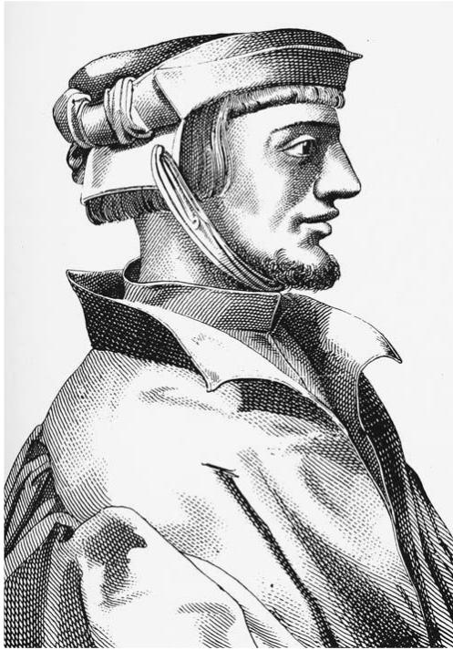
Prilog 5. Agrippa