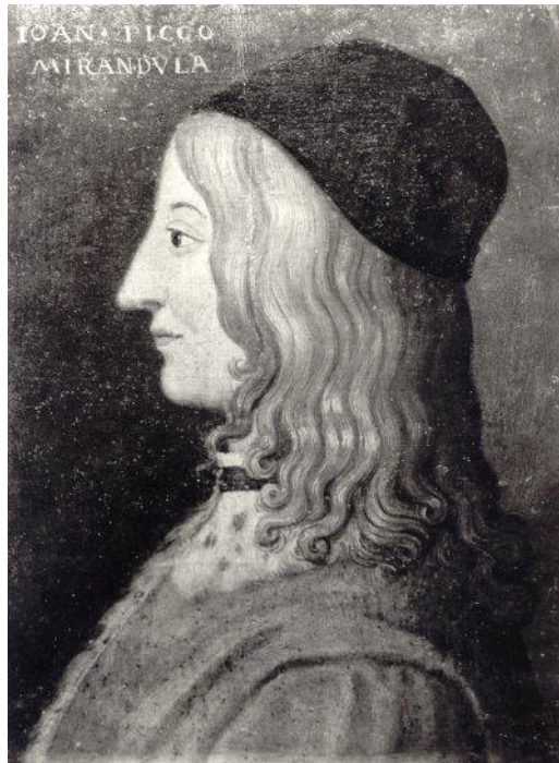
Prilog 7. Giovanni Pico della Mirandola