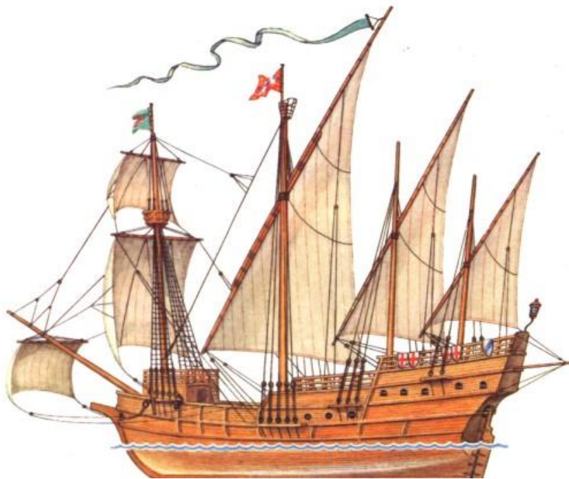
Prilog 1. Portugalska karavela