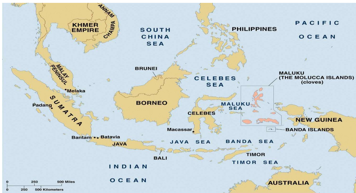
MAP 1-6 THE SPICE ISLANDS IN SOUTHEAST ASIA