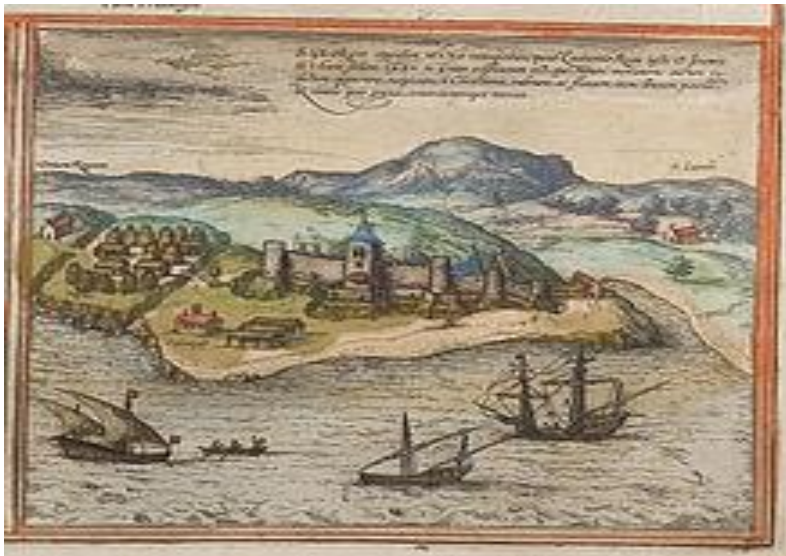
Prilog 3. São Jorge da Mina