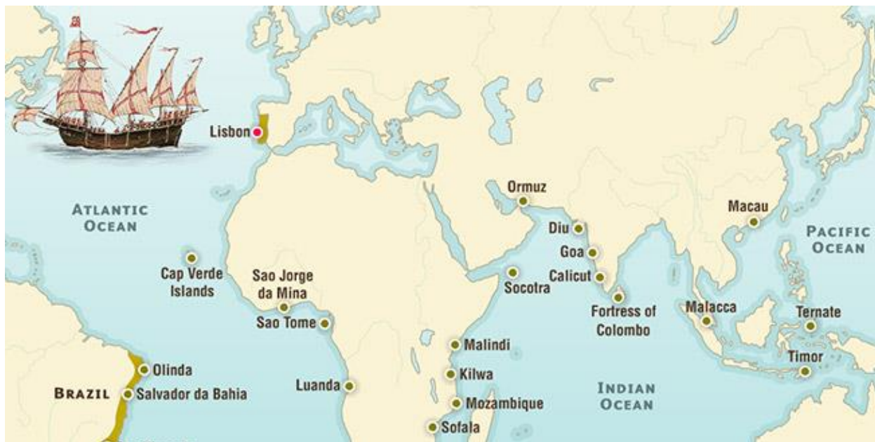
Prilog 4. Portugalska ekspanzija