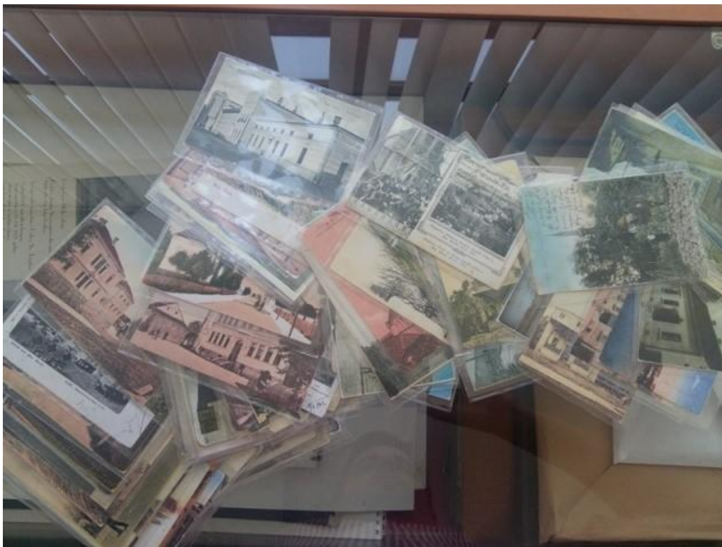
Slika 2. - Razglednice prije skeniranja

Priprema građe uključuje proces zaštite koji se primjenjuje za staru tiskanu građu. To podrazumijeva da će svaka jedinica građe prije samog snimanja biti očišćena, a kiselost papira neutralizirana te zaštićena.