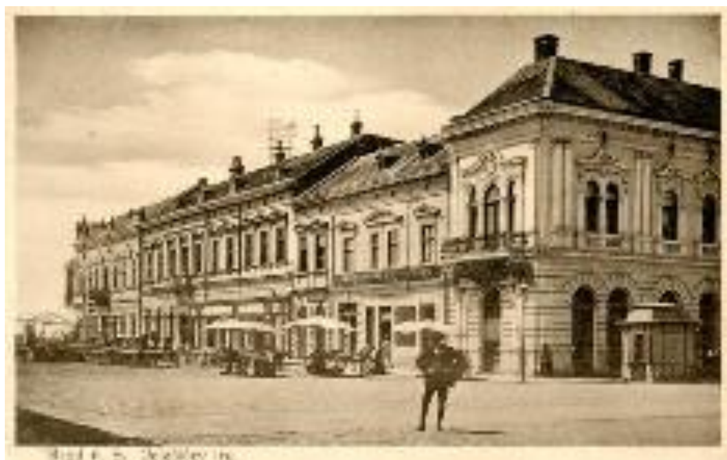
Slika 4. - Primjer skenirane razglednice.

Sadržaj zbirke dostupan je svim kategorijama korisnika kroz zasebno mrežno mjesto (engl. web site ) u sklopu postojećih mrežnih stranica Gradske knjižnice Slavonki Brod