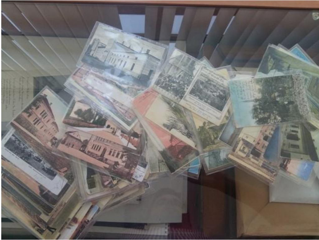
Slika 2. - Razglednice prije skeniranja

Priprema građe uključuje proces zaštite koji se primjenjuje za staru tiskanu građu. To podrazumijeva da će svaka jedinica građe prije samog snimanja biti očišćena, a kiselost papira neutralizirana te zaštićena.