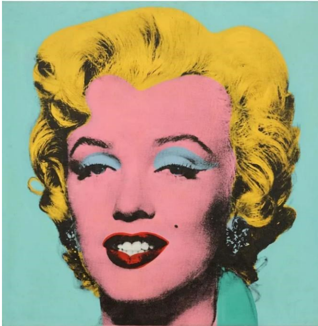
Slika 10. Andy Warhol, Marilyn Monroe, 1964. sitotisak na platnu, 101,6 x 101,6 cm

privatnu fotografiju glumice već koristi jednu popularnu reklamnu fotografiju. Umjetničko djelo tu je fotografiju učinilo besmrtnim, trajnim simbolom. 55