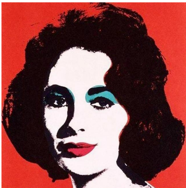
Slika 9. Andy Warhol, Liz , 1964., sitotisak na platnu, 58.7 x 58.7 cm

Liz (slika 9), prikazuje portret Elizabeth Taylor, američke glumice. Na crvenoj pozadini nalazi se crno bijeli portret ženskog lica en face . Na licu su upotrebom akcenta boje, poput šminke, naglašene oči i usne. Fotografija koja je iskorištena kao predložak je promotivna fotografija za film Butterfield 8 . 54