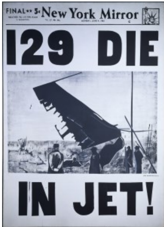
Slika 11. Andy Warhol, 129 poginulih u avionu (Avionska nesreća), 1962., akril na platnu, 254,5 x 182,5 cm

Warhol ne daje kritiku već samo ustaljenu praksu prezentira poput rezerviranog promatrača koji se drži na distanci. 57