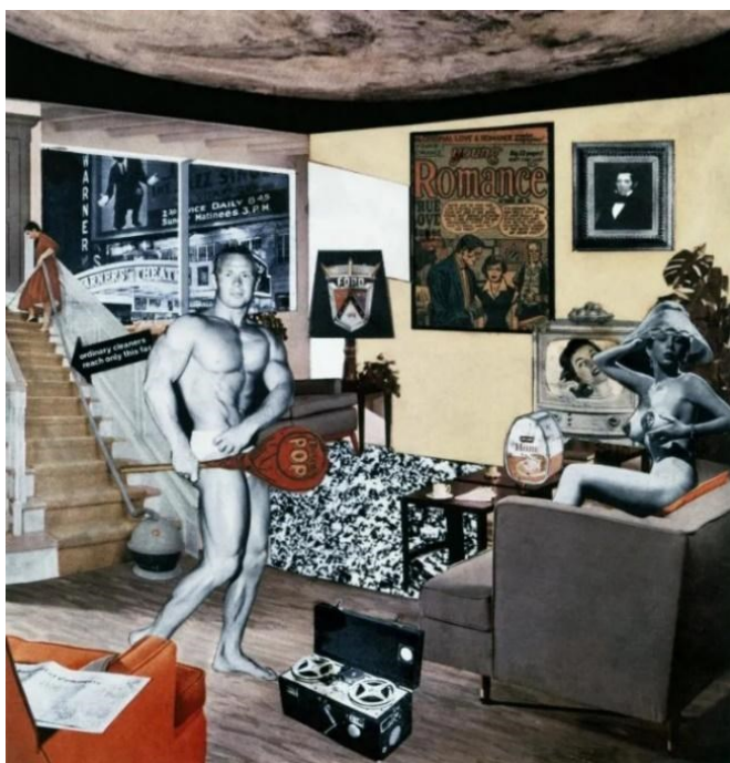
Slika 4. Richard Hamilton, Što to čini današnji dom tako drukčijim, tako privlačnim?, 1956, kolaž, 26 cm × 24.8 cm