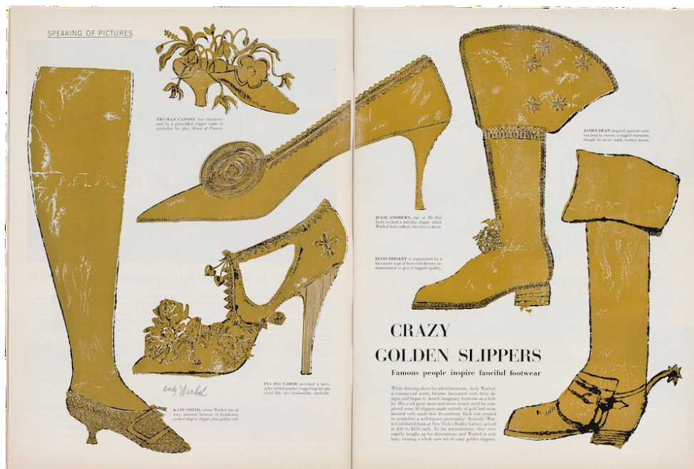
Slika 6. Ilustracije cipela pod nazivom Zlatna serija objavljene u časopisu Life; Andy Warhol, Crazy Gold Slippers, Life Magazine, 1957.

Ilustracije obuće značajno su obilježile stvaralaštvo njegove komercijalne faze. Stil tih crteža uspoređivan je s Toulouse-Lautreca. Crteži se odlikuju empirijskoj točnosti te lepršavim, ležernim potezima. Serija ilustracija cipela pod nazivom Zlatne cipele (slika 6), prikazuje cipele gdje je svaka cipela posvećena slavnoj osobi, to jest književnicima i filmskim zvijezdama. Interesantno je što Warhol povezuje proizvod, odnosno cipelu sa stvarnom osobom. 38