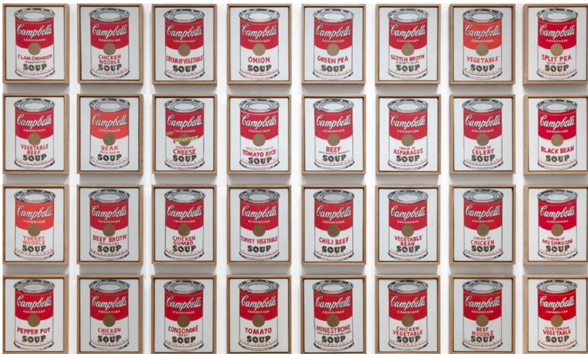
Slika 7. Andy Warhol, Campbell's Soup Cans , 1962., 51 cm × 41 cm

Koncept same izložbe bio je provokativan u svojoj zamisli. Odabirom ovoga koncepta povlačila se paralela između trgovine umjetnica i trgovine hranom, odnosno između galerije i supermarketa. 47