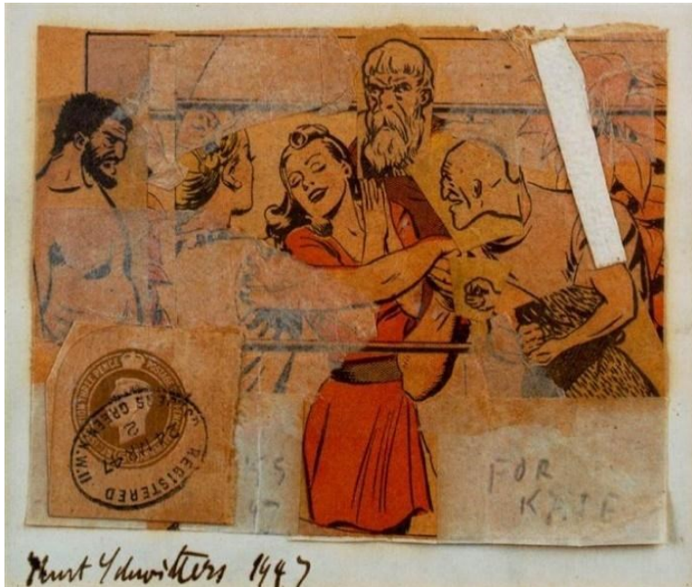
Slika 1. Kurt Schwitters, For Kate , 1947., kolaž, 9.8 x 13 cm

Kao prototip novoga stila, to jest pop arta, navodi se djelo koje nastaje 1947. godine umjetnika Kurta Schwittersa, kolaž pod nazivom For Kate (slika 1). Schwitters, dadaistički umjetnik izrađuje kolaž gradeći kompoziciju od likova izrezanih iz stripova. Kolaž je malih dimenzija, orijentiran vodoravno. 15