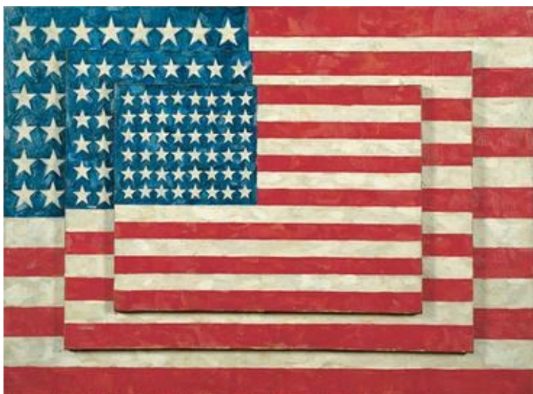
Slika 2. Jasper Johns, Tri zastave, 1958., enkaustika, 77.8 cm × 115.6 cm

Nadalje, najpopularniji prototip novoga stila, to jest pop arta, napravio je umjetnik Stuart Davis sa svojim umjetničkim djelom na kojem prikazuje kutiju cigareta brenda Lucky Strike (slika 3). 19