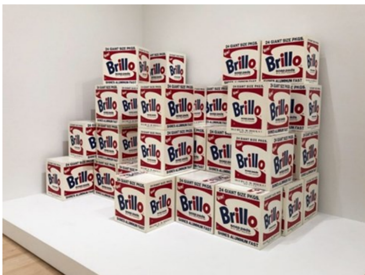
Slika 8. Andy Warhol, Brillo Boxes, 1964., sitotisak i tinta na drvu, 43.2 × 43.2 × 35.6 cm

Pretvaranje komercijalnih proizvoda u ikone koje su simboli doba masovne potrošnje važan je segment Warholovog slikarstva. Za ikone, bile one kršćanske ili narodne, karakteristično je to da one nastaju u velikom broju, prema određenim pravilima i da međusobno nalikuju. Ikone masovne proizvodnje postaju značajne umjetnikovoj odluci, odnosi odluci umjetnika koji za motiv bira komercijalne predmete te ih iz svijeta supermarketa prenosi na platno. Warhol ne prenosi izvorne predmete poput Marcela Duchampa, već dolazi izmjene predmeta to jest postoji intervencija umjetnika. Nastaju dvodimenzionalne reprodukcije trodimenzionalnih svakodnevnih predmeta. 49