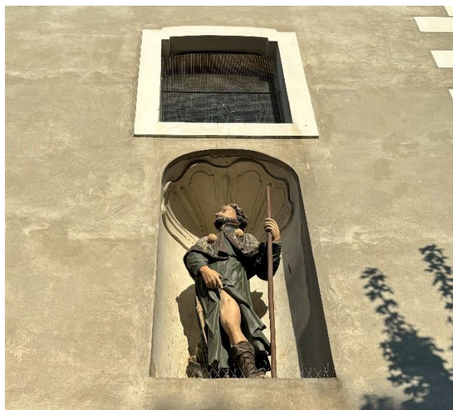
Slika 12. i 13. Fotografije kipova sv. Franje Asiškog (lijevo) i sv. Roka (desno)