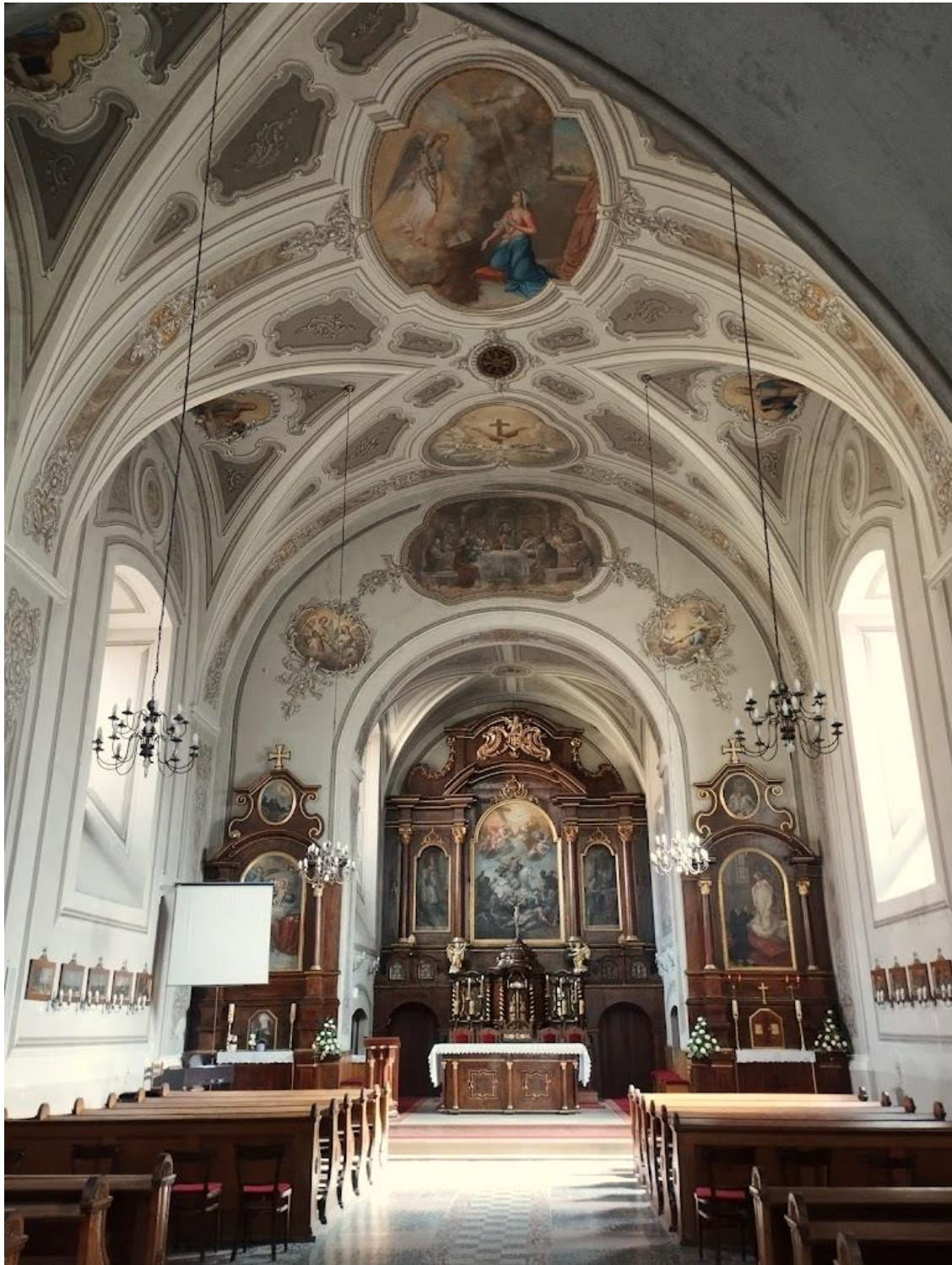
Slika 25. Fotografija interijera kapucinske crkve sv. Jakova, izvor: https://lh3.googleusercontent.com/p/AF1QipMNv0u_50CRtGHqEgMMc6vScatQzbOSC4X5DB4u=s1360-w1360-h1020