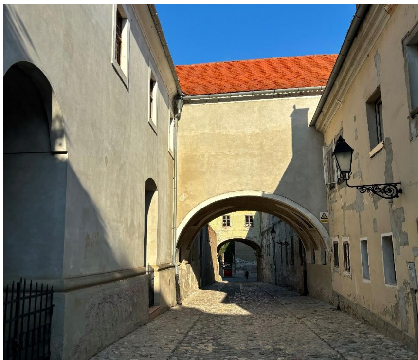
Slika 15. Fotografija svodova crkve Uzvišenja sv. Križa i samostana