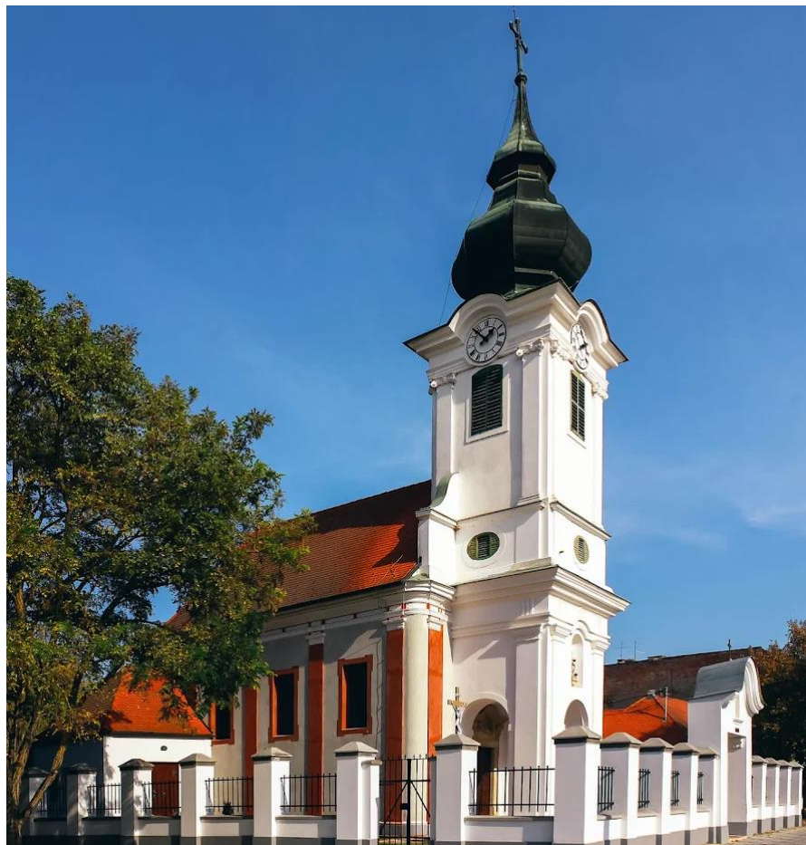
Slika 27. Fotografija zapadnog pročelja kapele sv. Roka u Gornjem gradu, izvor: https://lh3.googleusercontent.com/p/AF1QipOcewGBhTD5ntQvpAcHHEUnkFjXtZDouE_8xjeW=s1360-w1360-h1020-rw