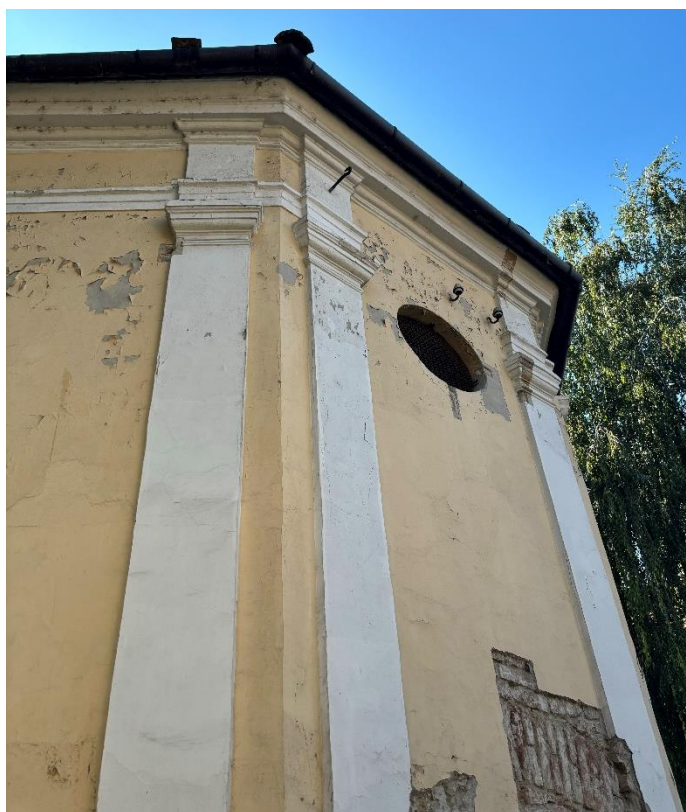
Slika 8. Fotografija pročelja apside kapele sv. Roka u Donjem gradu