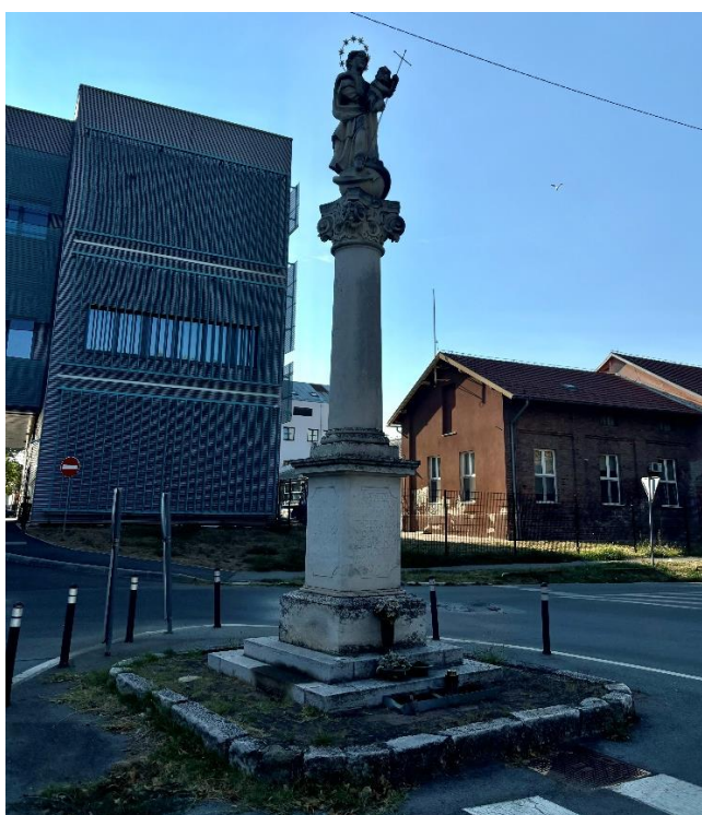
Slika 9. Fotografija baroknog kipa Blažene Djevice Marije s Djetetom ispred kapele sv. Roka u Donjem gradu