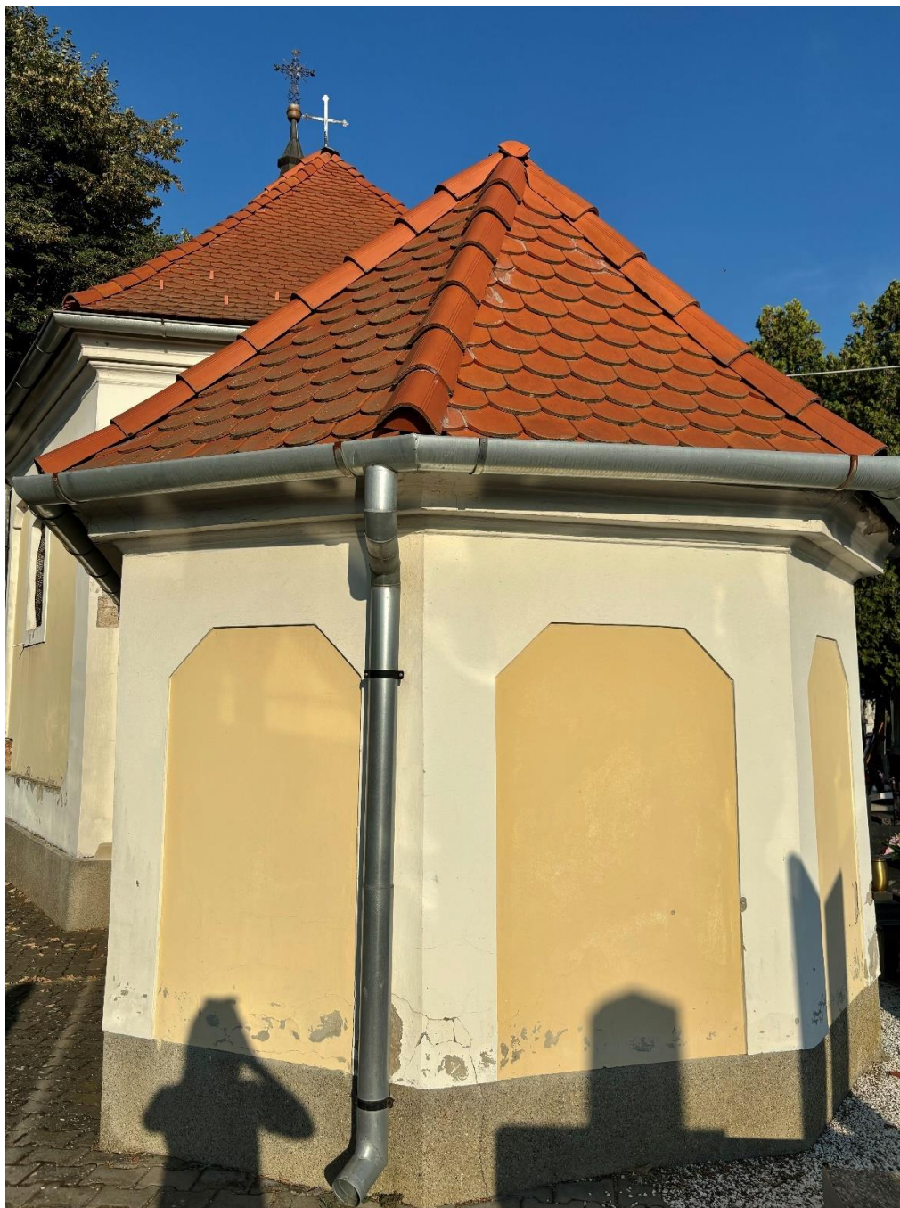
Slika 31. Fotografija pročelja apside grobljanske kapele sv. Ane, foto: L. Ober