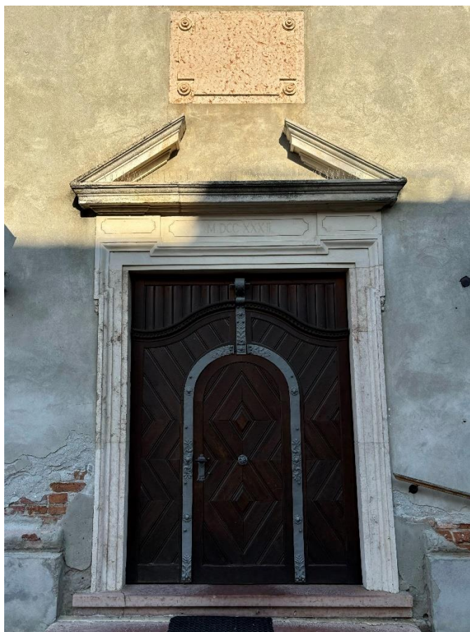
Slika 11. Fotografija glavnog portala crkve Uzvišenja sv. Križa, foto: L. Ober