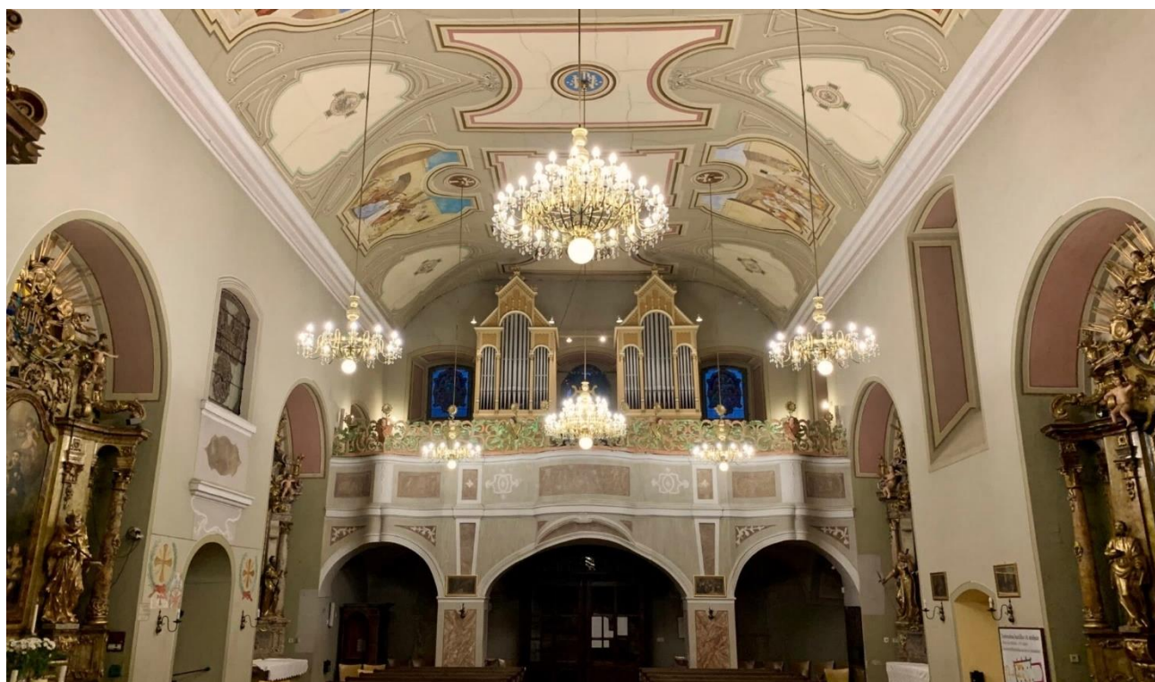
Slika 16. Fotografija interijera crkve Uzvišenja sv. Križa