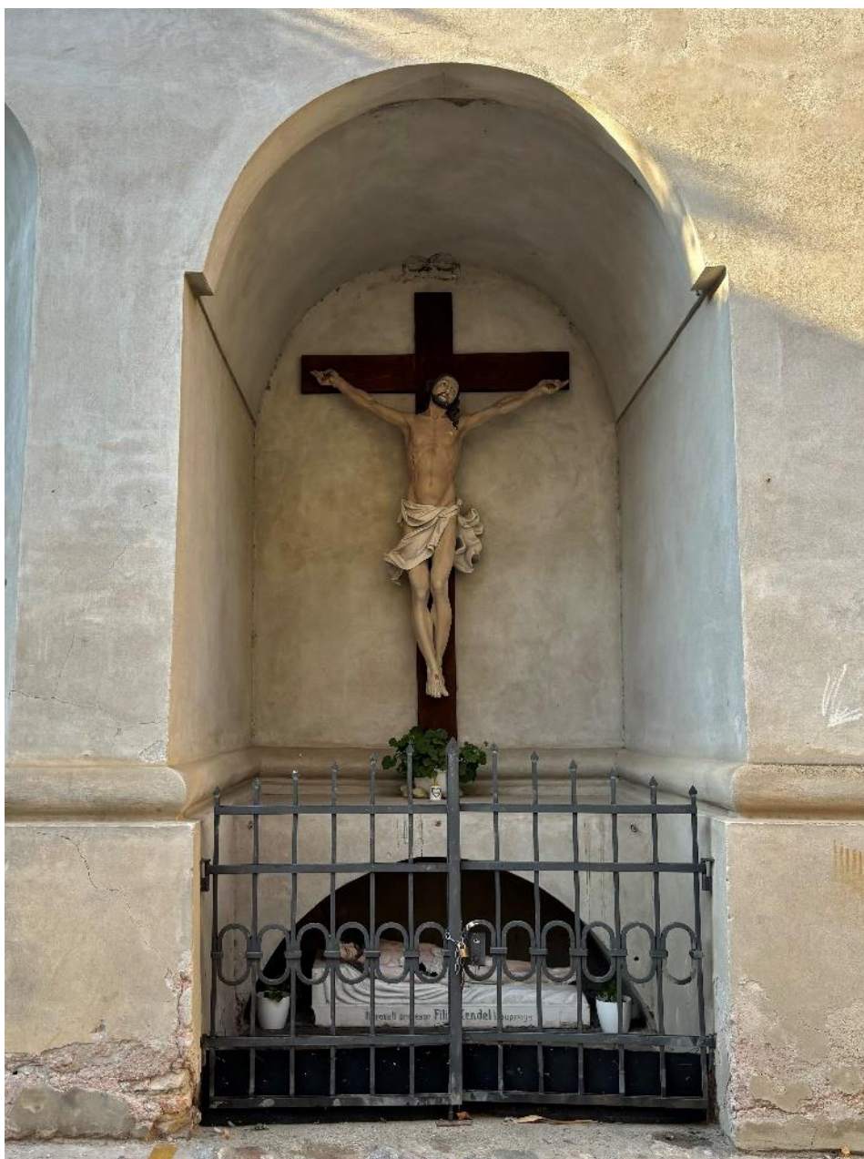
Slika 14. Fotografija niše južnog pročelja crkve Uzvišenja sv. Križa, foto: L. Ober