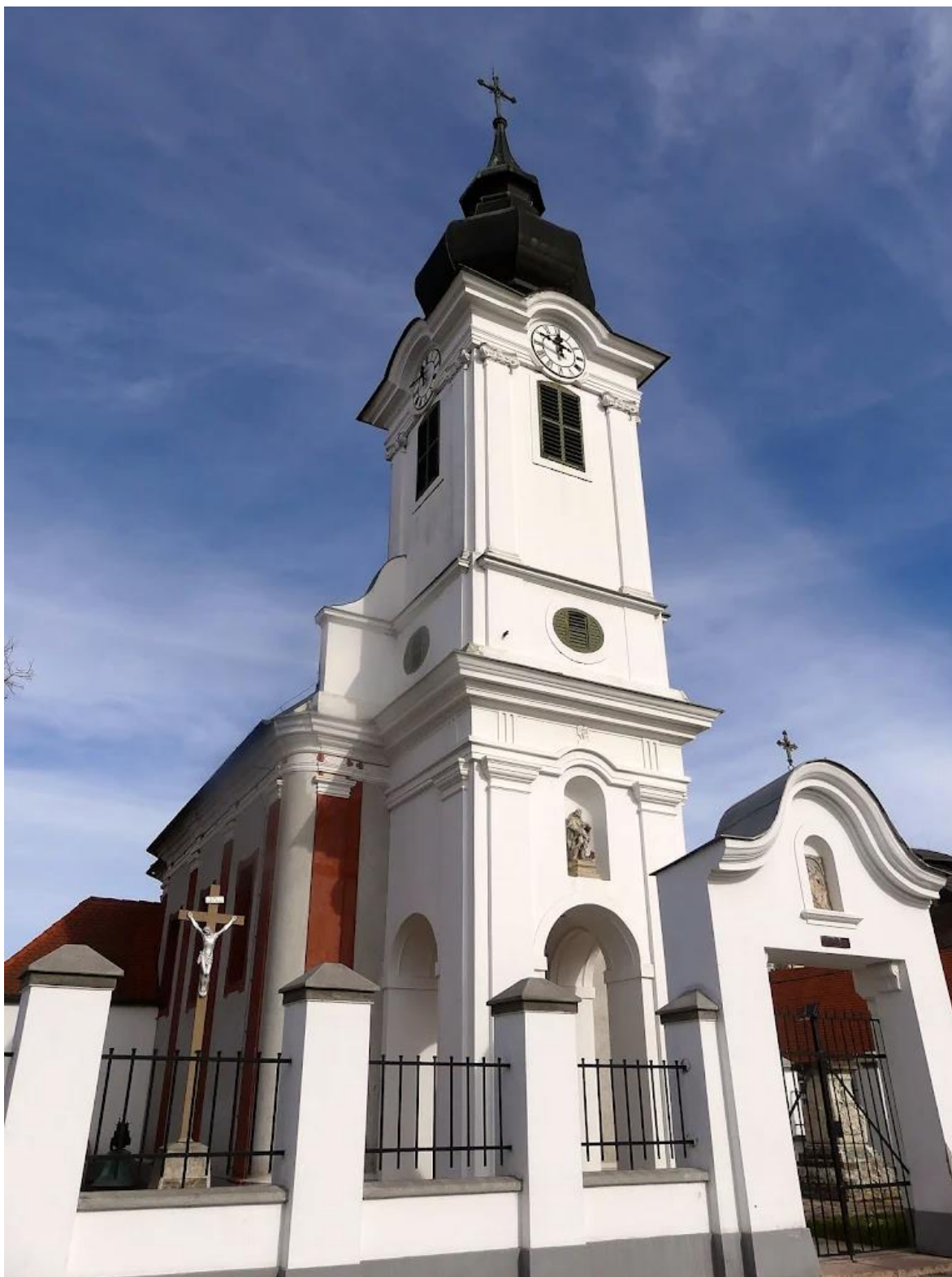
Slika 26. Fotografija glavnog pročelja kapele sv. Roka u Gornjem gradu