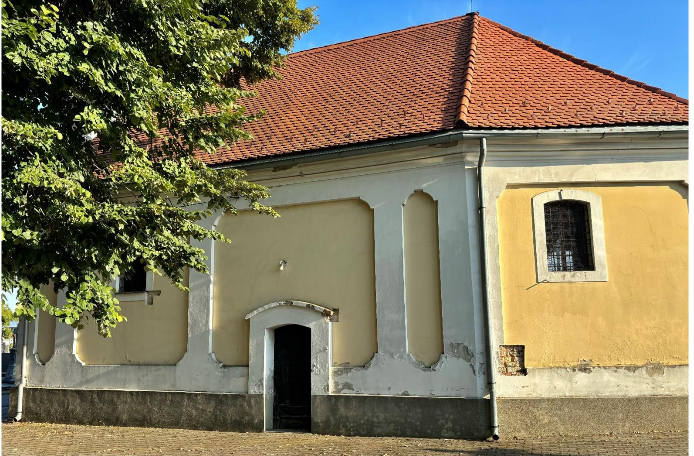
Slika 30. Fotografija sjevernog pročelja grobljanske kapele sv. Ane