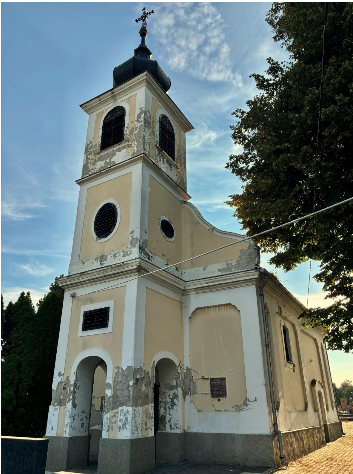
Slika 29. Fotografija glavnog pročelja grobljanske kapele sv. Ane