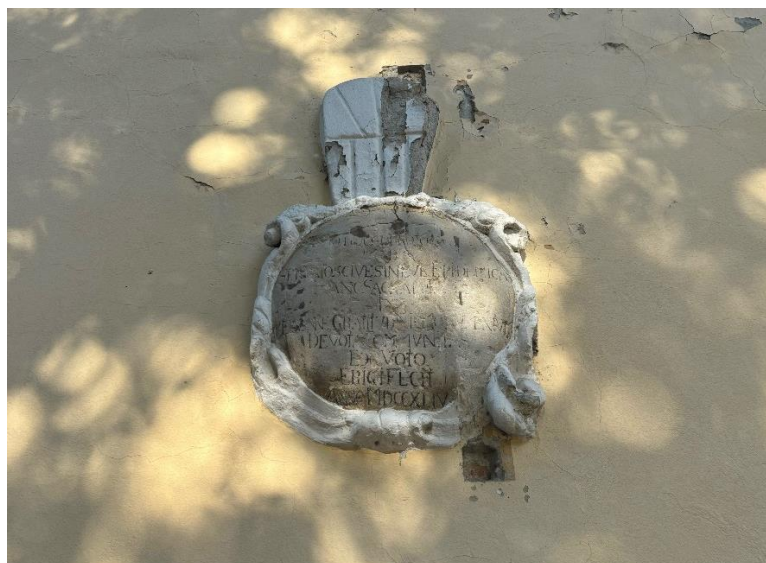
Slika 6. Fotografija kamene medaljonske kartuše s latinskim natpisom zahvale sv. Roku