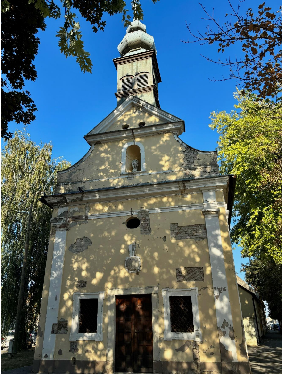
Slika 5. Fotografija glavnog pročelja kapele sv. Roka u Donjem gradu