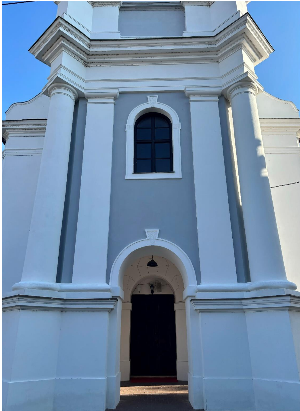
Slika 2. Fotografija zone glavnog portala crkve Preslavnog Imena Marijinog