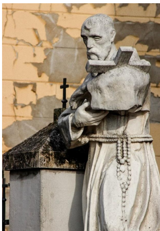
Slika 24. Fotografija kipa sv. Franje Asiškog ispred kapucinske crkve sv. Jakova, izvor: https://lh5.googleusercontent.com/p/AF1QipO1xSYSc8hpemDU82k8fYTfhemfBR0UZJP9PxNG=w750-h1068-p-k-no