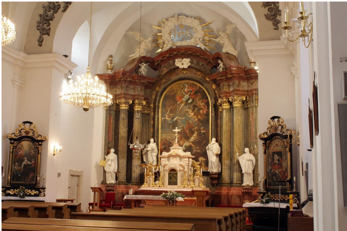
Slika 21. Fotografija interijera crkve sv. Mihaela