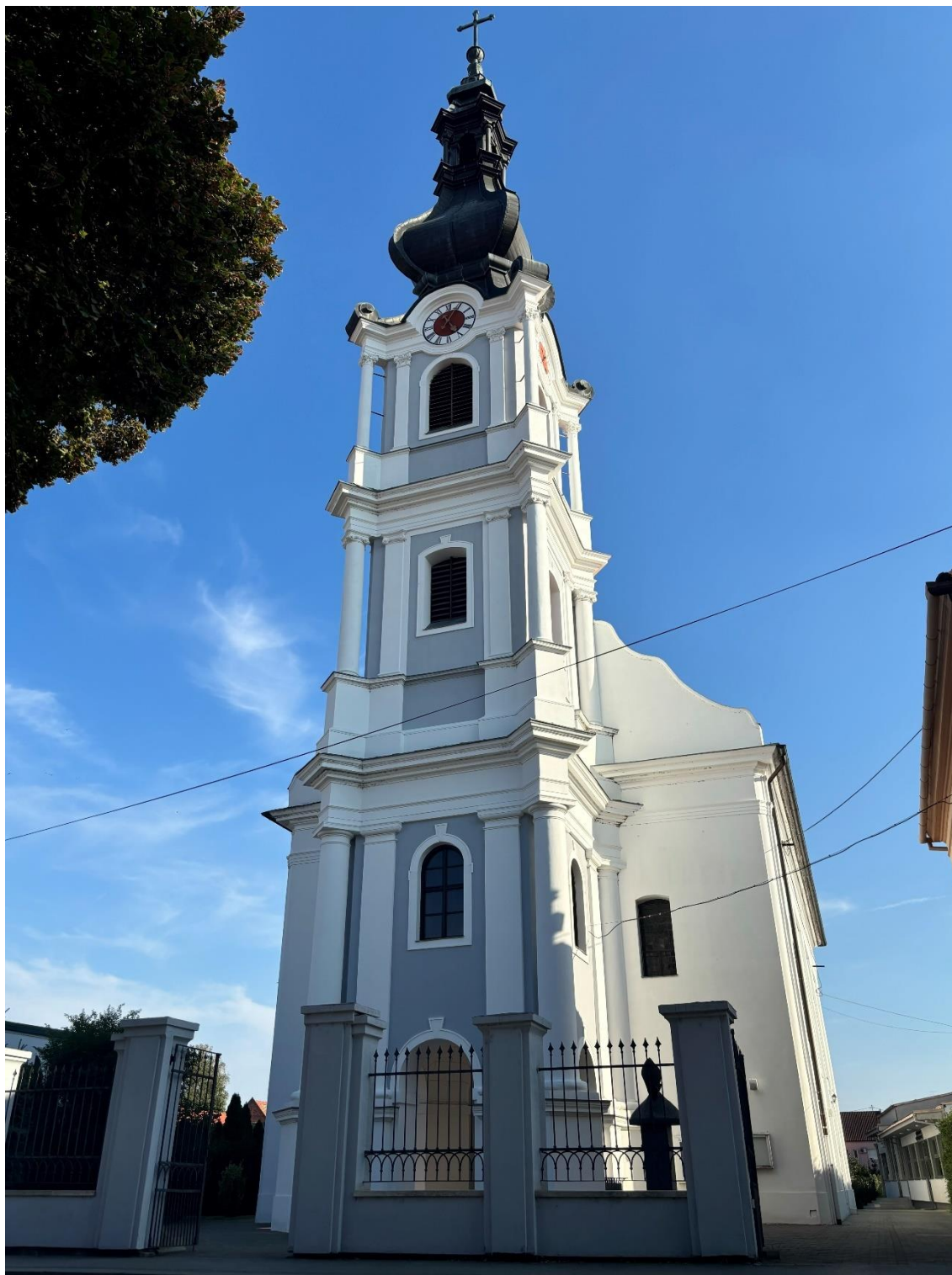
Slika 1. Fotografija glavnog pročelja crkve Preslavnog Imena Marijinog