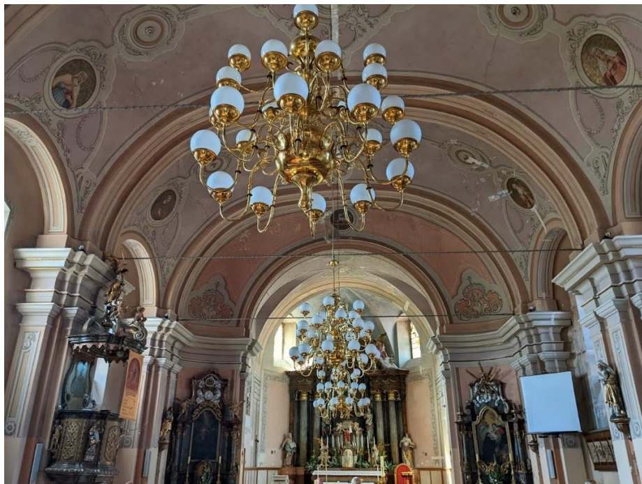
Slika 3. Fotografija unutrašnjosti crkve Preslavnog Imena Marijinog