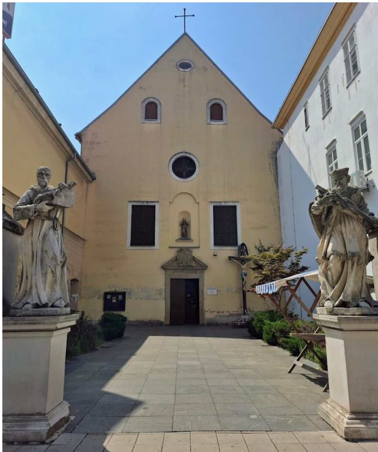
Slika 22. Fotografija glavnog pročelja kapucinske crkve sv. Jakova