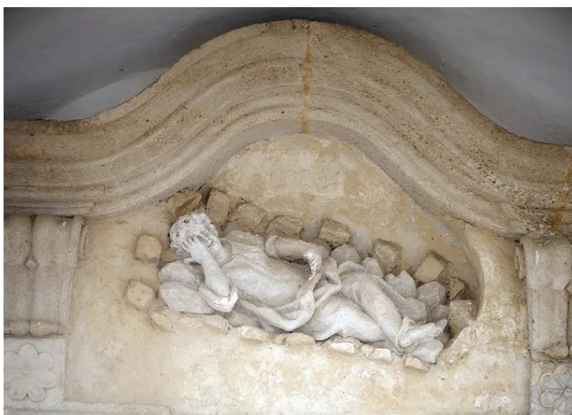
Slika 28. Fotografija reljefa iznad glavnog portala kapele sv. Roka u Gornjem gradu