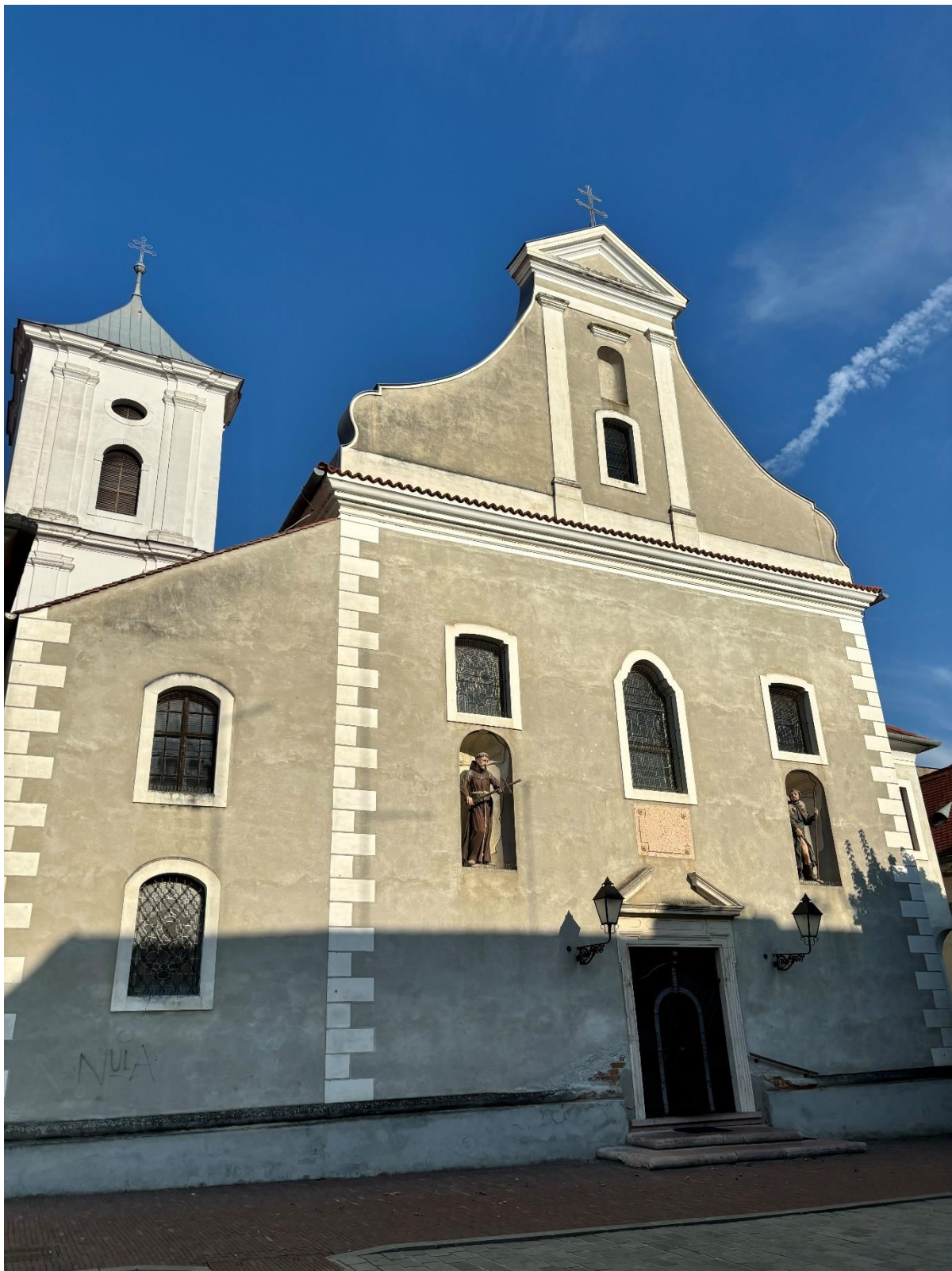
Slika 10. Fotografija glavnog pročelja i zvonika crkve Uzvišenja sv. Križa