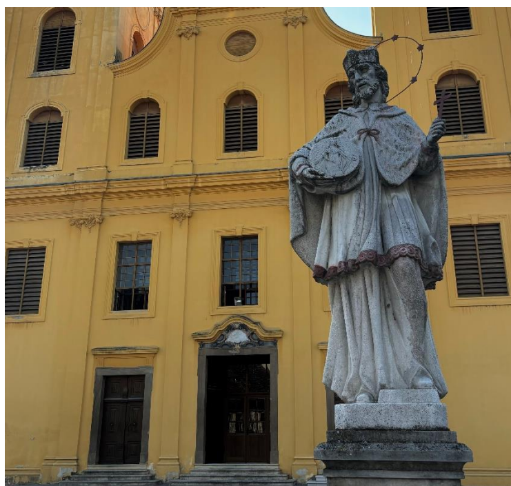
Slika 19. Fotografija kipa sv. Ivana Nepomuka ispred crkve sv. Mihaela, foto: L. Ober