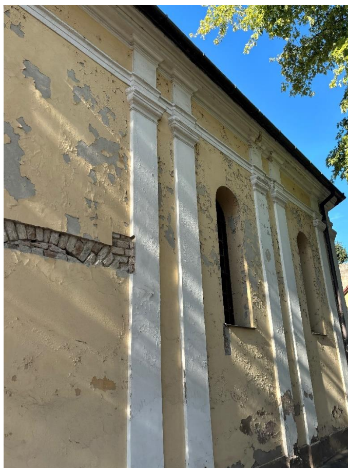
Slika 7. Fotografija bočnog pročelja kapele sv. Roka u Donjem gradu, foto: L. Ober