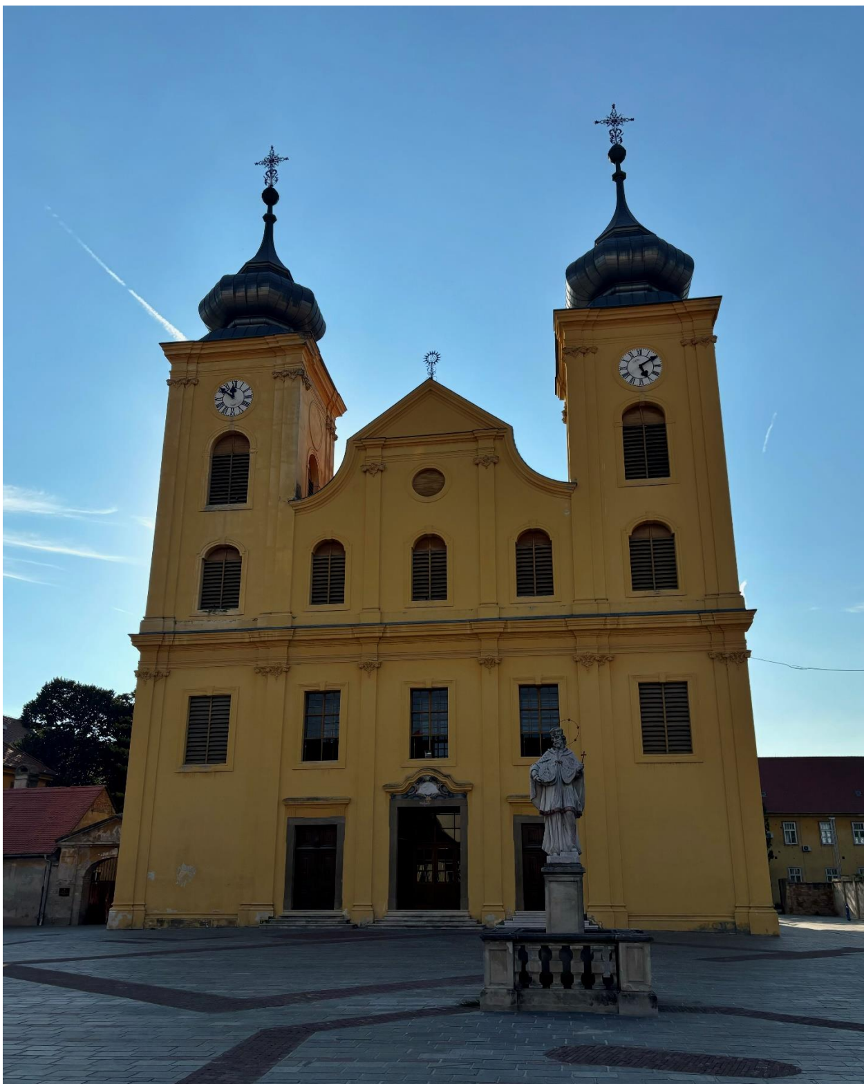
Slika 17. Fotografija glavnog pročelja crkve sv. Mihaela