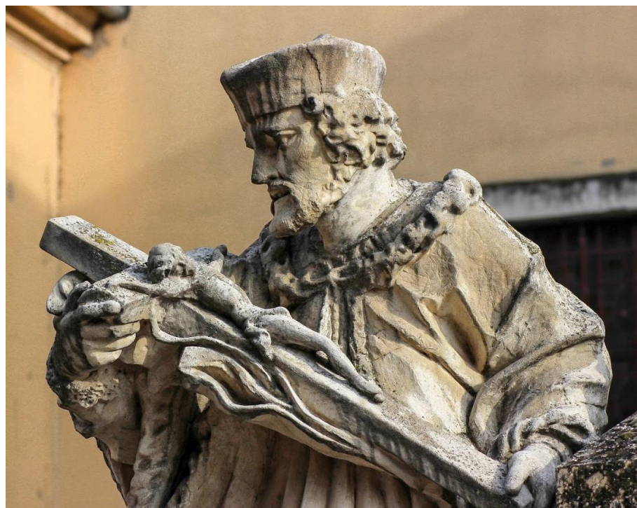
Slika 23. Fotografija kipa sv. Ivana Nepomuka ispred kapucinske crkve sv. Jakova