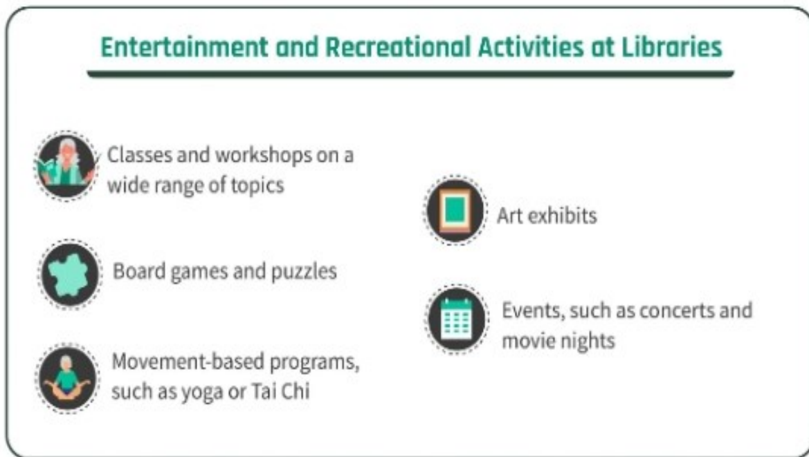
Slika 3. Zabavne i rekreacijske aktivnosti u knjižnicama