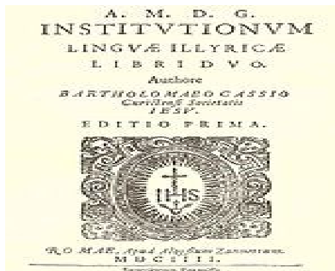
Slika 1. Gramatika Institutionum linguae illyricae libri duo