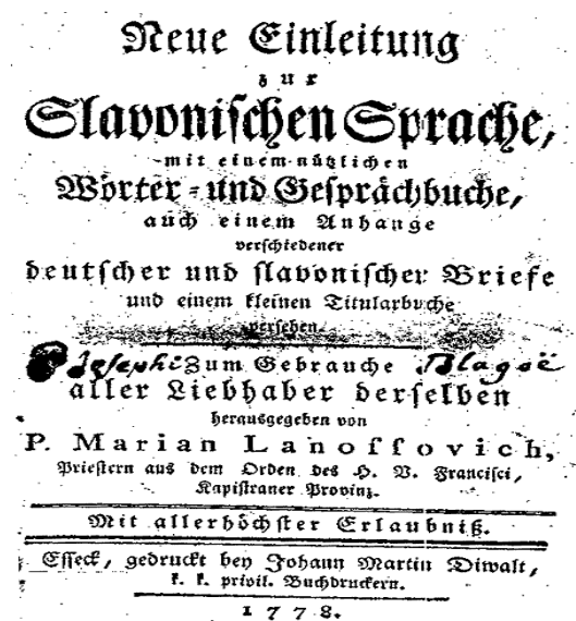
Slika 6.: Naslovnica gramatike Neue einleitung zur slavonischen Sprache

Lanosovićeve gramatika namijenjena je strancima koji uče hrvatski (slavonski) jezik i zapravo je opći jezični vodič koji osim gramatičkog dijela uključuje i njemačko-hrvatski rječnik u prvom izdanju na 80 stranica. Uz ovaj, u trećem je izdanju nešto manji njemačko-hrvatsko-mađarski rječnik na šezdesetak stranica. U knjizi je i kratak konverzacijski priručnik koji sadrži deset dijaloga kao i više primjera pisanja pisama prikladnih za razne prigode i naslove relevantne za obraćanje različitim osobama (treća verzija ih izostavlja).