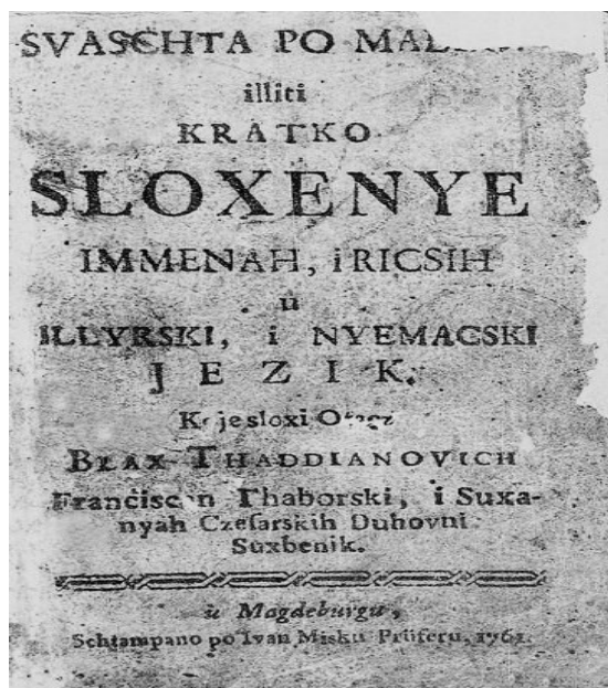
Slika 2. Naslovnica gramatike Svašta po malo iliti kratko složenje imena i riči u njemački jezik