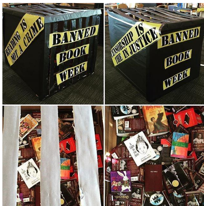
Slika 1. „Zaključavanje“ knjiga u sanduke ili kaveze 72