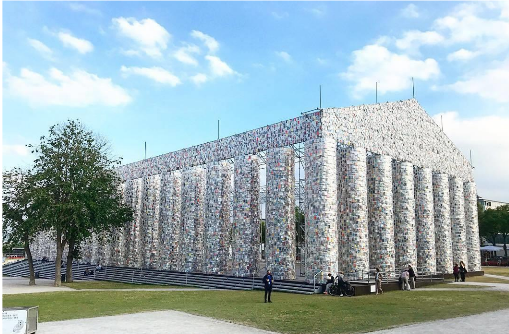
Slika 2. Hram zabranjenih knjiga, Kassel, Njemačka 77