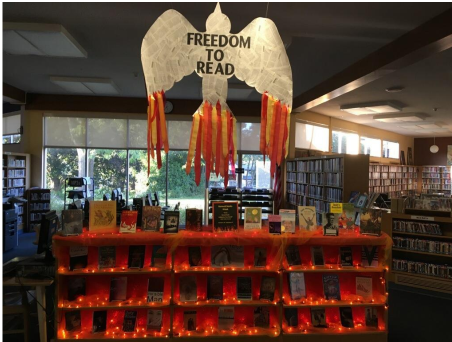
Slika 3. „Knjige u plamenu“, Knjižnica Okruga Onondaga 79