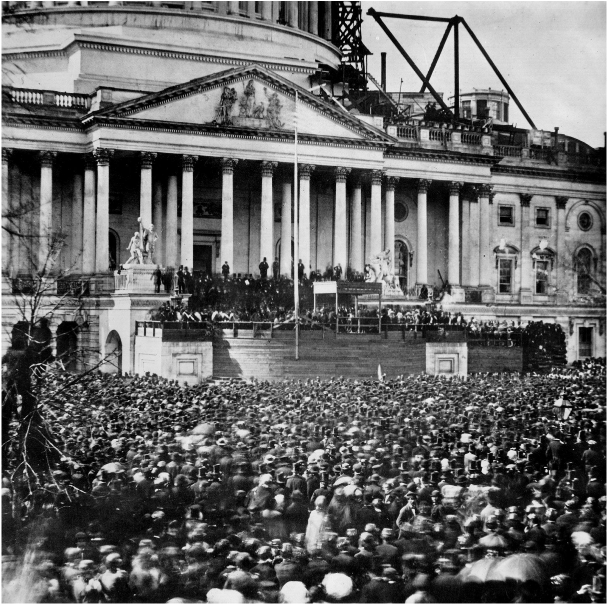
Prilog 1. Održavanje Lincolнове inauguracije u Washingtonu 1861. godine.