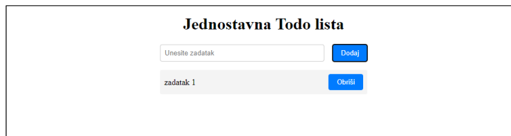
slika 3. Vizualni prizak Todo liste

Kada je u pitanju stiliziranje web aplikacija, snažno preferiram korištenje SCSS-a (Sass) zbog njegove fleksibilnosti, modularnosti i poboljšane čitljivosti. SCSS mi omogućuje pisanje organiziranijih i učinkovitijih stilova, a istovremeno nudi napredne značajke koje pojednostavljaju razvojni proces. Iz tog razloga zatražio sam da mi ChatGPT prebaci već napisani CSS u SCSS. Proces pretvorbe bio je jednostavan. Zadržao je postojeće stilove i jednostavno ih smjestio unutar SCSS strukture.