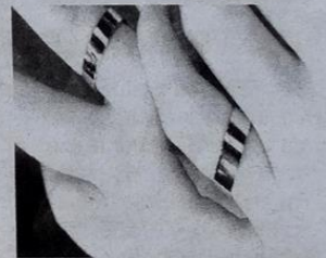
Vjenčano prstenje mladog para

Stanu je upoznao preko jednog od njezine braće 2006. i zaljubili su se - no veza je bila kratka. Ona je neko vrijeme bila s kolegom Nathanom Fillionom s kojim glumi u "Castleu". Prošle godi-