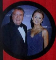
Poznati producent Jose Alberto Castro i Angelique u vezi su bili gotovo tri godine