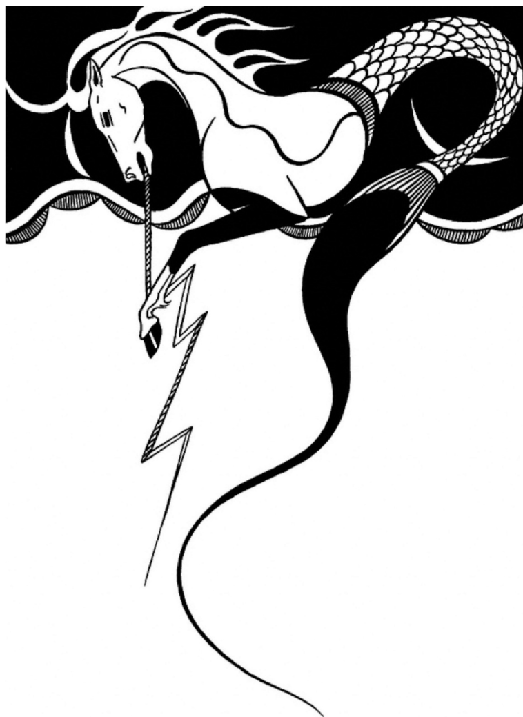
Slika 2: Man-ka-ih , ilustracija umjetnika Alfreda Morrisa Momadaya (Momaday, 1998: 51)

čudna životinja tumara nebesima. Ima glavu konja, a rep velike ribe. Munje joj izlaze iz usta, a rep, šibajući i udarajući po zraku, stvara visok, vruć vjetar tornada. No oni mu se obraćaju govoreći: „Prođi iznad mene“. Oni se ne boje Man-ka-iha jer on razumije njihov jezik. (Momaday, 1998: 48)