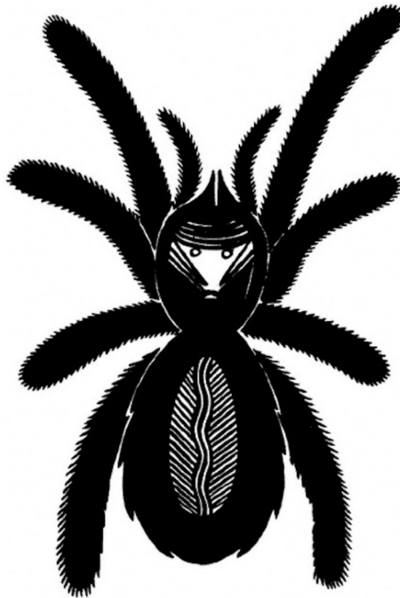
Slika 3: Pauk, ilustracija umjetnika Alfreda Morrisa Momadaya (Momaday, 1998: 29)

tula, koje su preplavile potopljeno tlo “ (Momaday, 1998: 27). Glas neposrednog pripovjedača potom opisuje pauke kako se kreću prašnjavim putevima Ravnica: „ Vidite ih i pitate se kamo i koliko daleko idu. Djeluju vrlo staro i teško pokretljivo. [...] Tu i tamo dođe poneka tarantula, u sumrak, uvijek veća nego što možete zamisliti, troma i tamnosmeđa, prekrivena dugim, prašnjavim dlakama [...] zaustavi se pa krene i potom se udalji “ (Momaday, 1998: 27). Prema tome, kako potvrđuje i sam autor, presijecanjem diskurzivnih granica i prožimanjem divergentnih perspektiva Put prema Kišnoj planini „validira usmenu tradiciju u mjeri koja bez toga ne bi bila moguća“ (1993: 170).