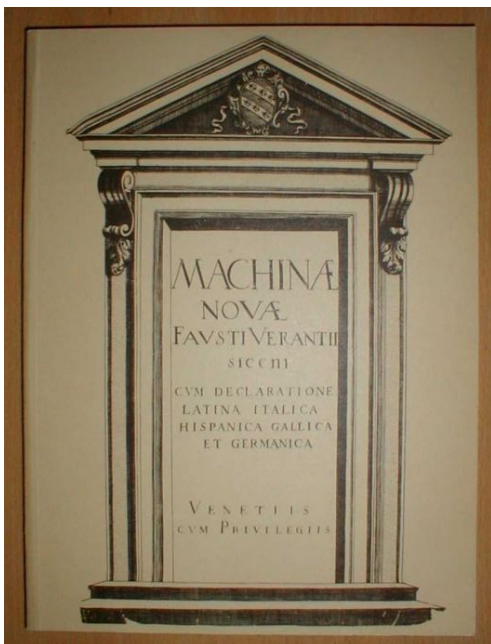
(slika 1. naslovna stranica djela Machinae Novae )

U djelu Machinae Novae Vrančić je pokazao 49 raznih slika velikog formata. Na njima je donio, a u komentarima na latinskom, talijanskom, španjolskom, francuskom i njemačkom jeziku opisao 56 različitih uređaja i tehničkih konstrukcija. Svi ti projekti nisu bili novi, ali su mnogi od njih bili izvorno Vrančićevi i značili su izuzetno veliko obogaćenje tehničkih oblika.