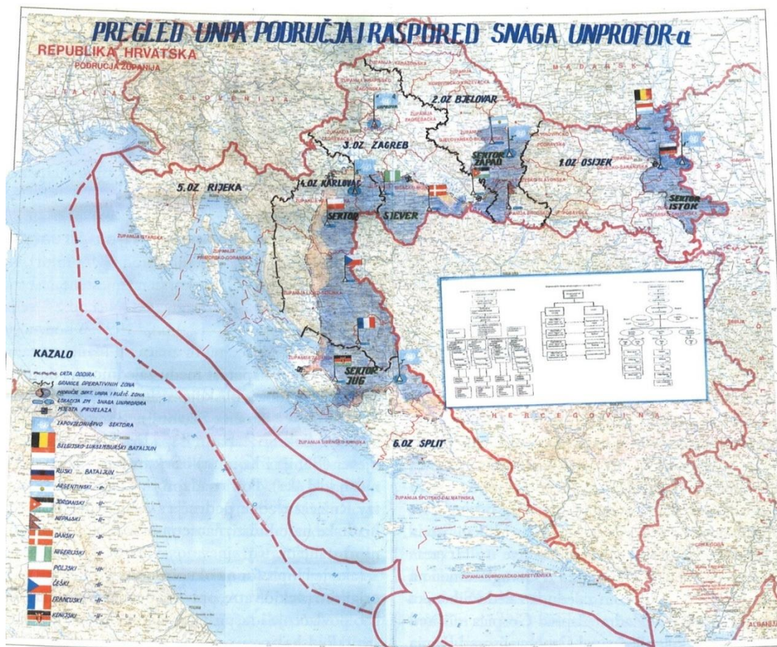
Zemljovid 5. Pregled UNPA područja i raspored snaga UNPROFOR-a 213