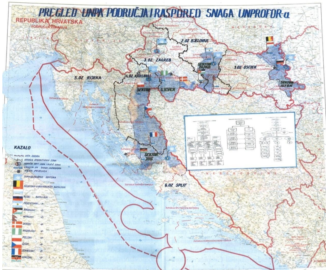
Zemljovid 5. Pregled UNPA područja i raspored snaga UNPROFOR-a 213