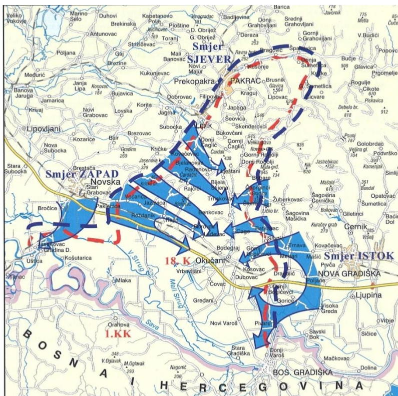
Zemljovid 6. Operacija „Bljesak“ – svibanj 1995. 245