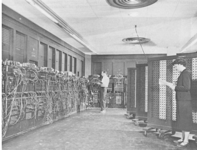
Slika 1. Prikaz ENIAC-a.