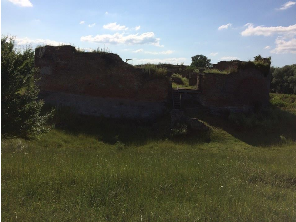
Prilog 7: Ostaci utvrde Korogyvar (Korođ) – primjer renesansne vojne arhitekture u istočnoj Slavoniji.