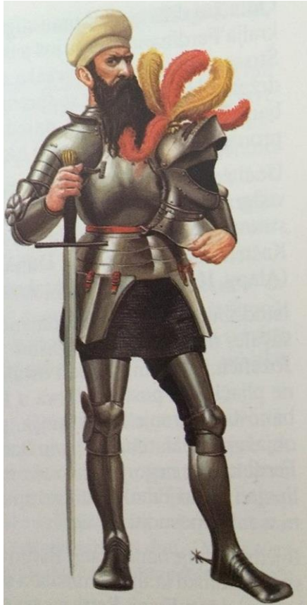
Prilog 3: Rekonstruirani prikaz Krste Frankopana u punom talijanskom oklopu.