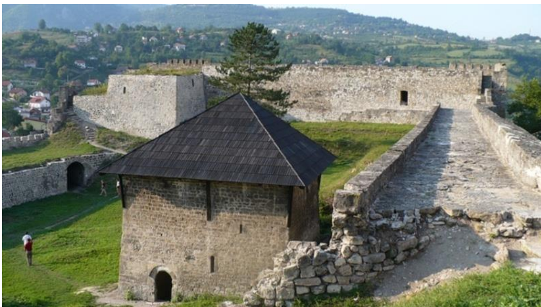
Prilog 2: Jajačka tvrđava – primjer kombinacije srednjovjekovne i renesansne vojne arhitekture.