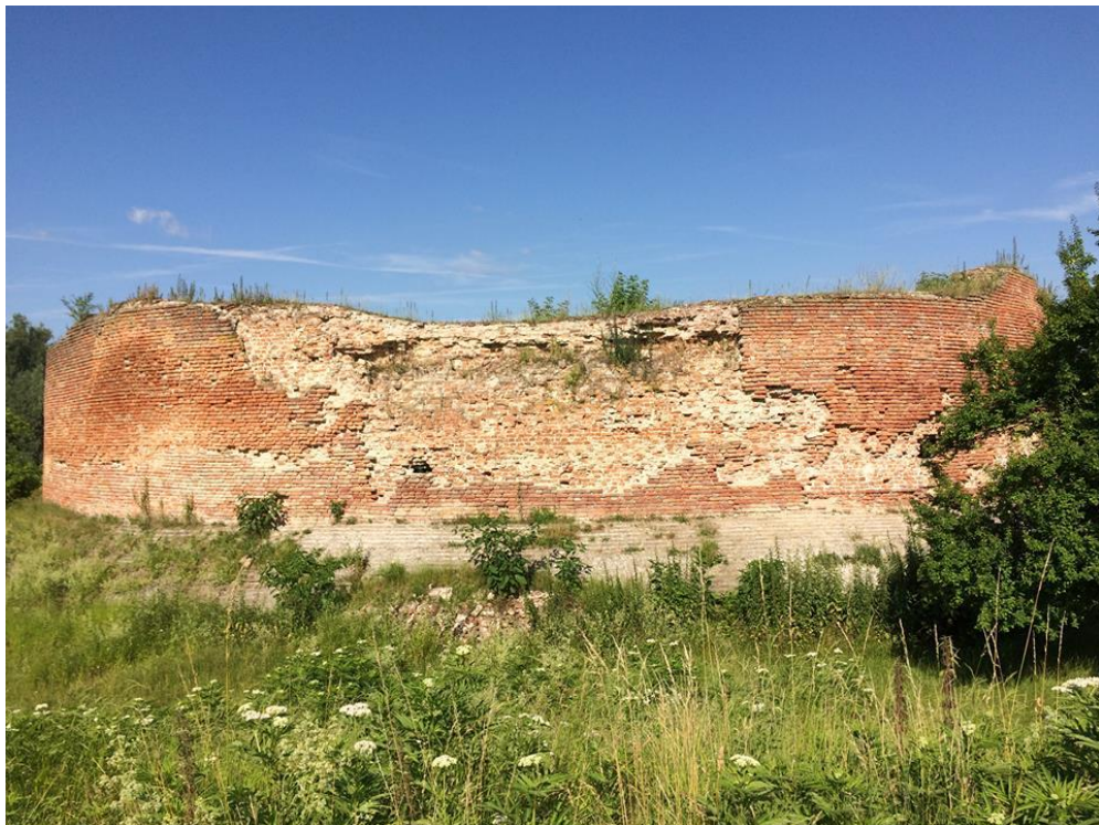
Prilog 8: Masivni i zaobljeni zidovi Korogyvara – ključno obilježje renesansne vojne arhitekture.