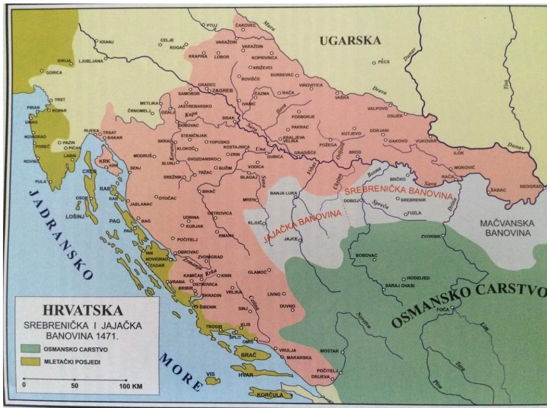
Prilog 1: Karta Jajačke i Srebreničke banovine.