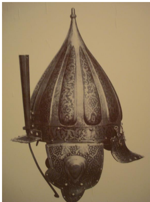
Prilog 4: Kaciga Nikole Šubića Zrinskog tipa „šišak“, tipičan primjer osmanskog utjecaja na europske vojske; vlasništvo Umjetničko-povijesnog muzeja u Beču.