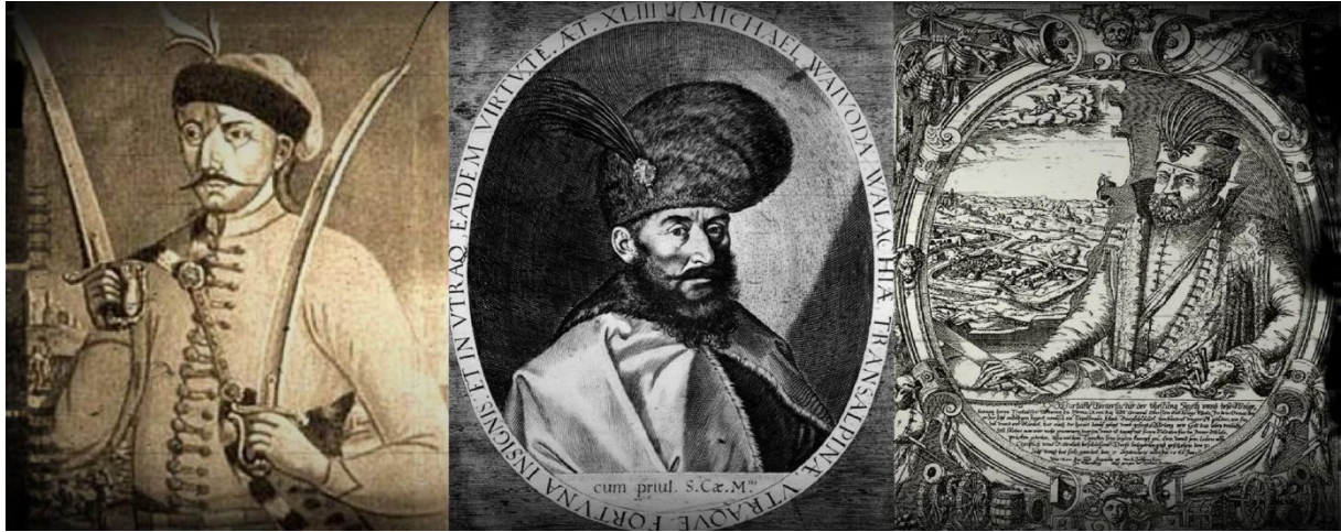
Prilog 11: Usporedni prikaz trojice vojnih zapovjednika iz triju različitih država (Pal Kinizsi – lijevo, Mihai Hrabri – sredina, Nikola Zrinski – desno) koji su se borili protiv Turaka. Premda vremenski razmaknuti gotovo jedno stoljeće, njihova odjeća odaje izuzetan orijentalni utjecaj – dugi ogrtači, krznena odjeća, kalpaci, ukrasno perje, upotreba sablji umjesto mačeva i drugo.