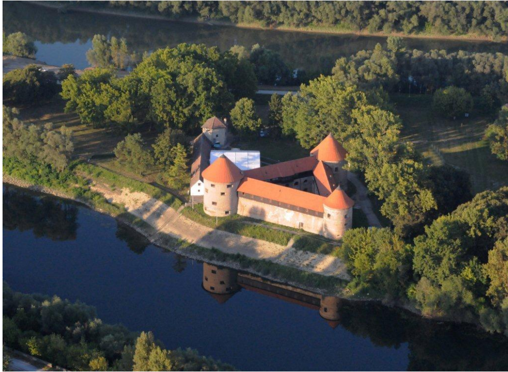
Prilog 9: Sisački kaštel – ogledan primjer renesansne utvrde kakve su se gradile na osmansko-habsburškoj granici.