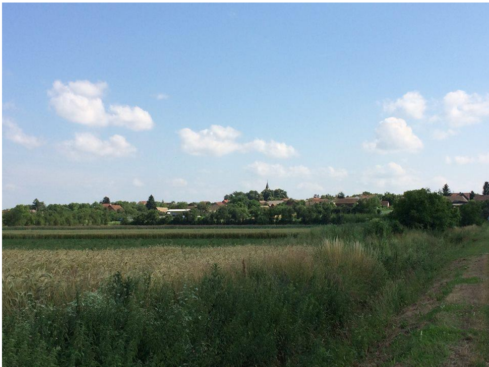
Prilog 6: Selo Gorjani sa svojim dominantnim položajem na uzvisini– nekadašnje bojište nalazi se lijevo od okvira fotografije