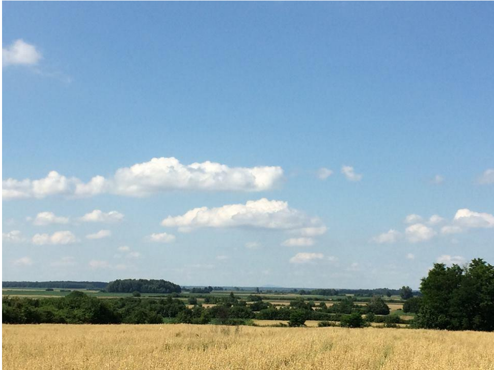
Prilog 5: Nekadašnja naplavna ravnica na tromedi između sela Gorjana, Punitovaca i Širokog Polja – poprište poraza vojske Ivana Katzianera.