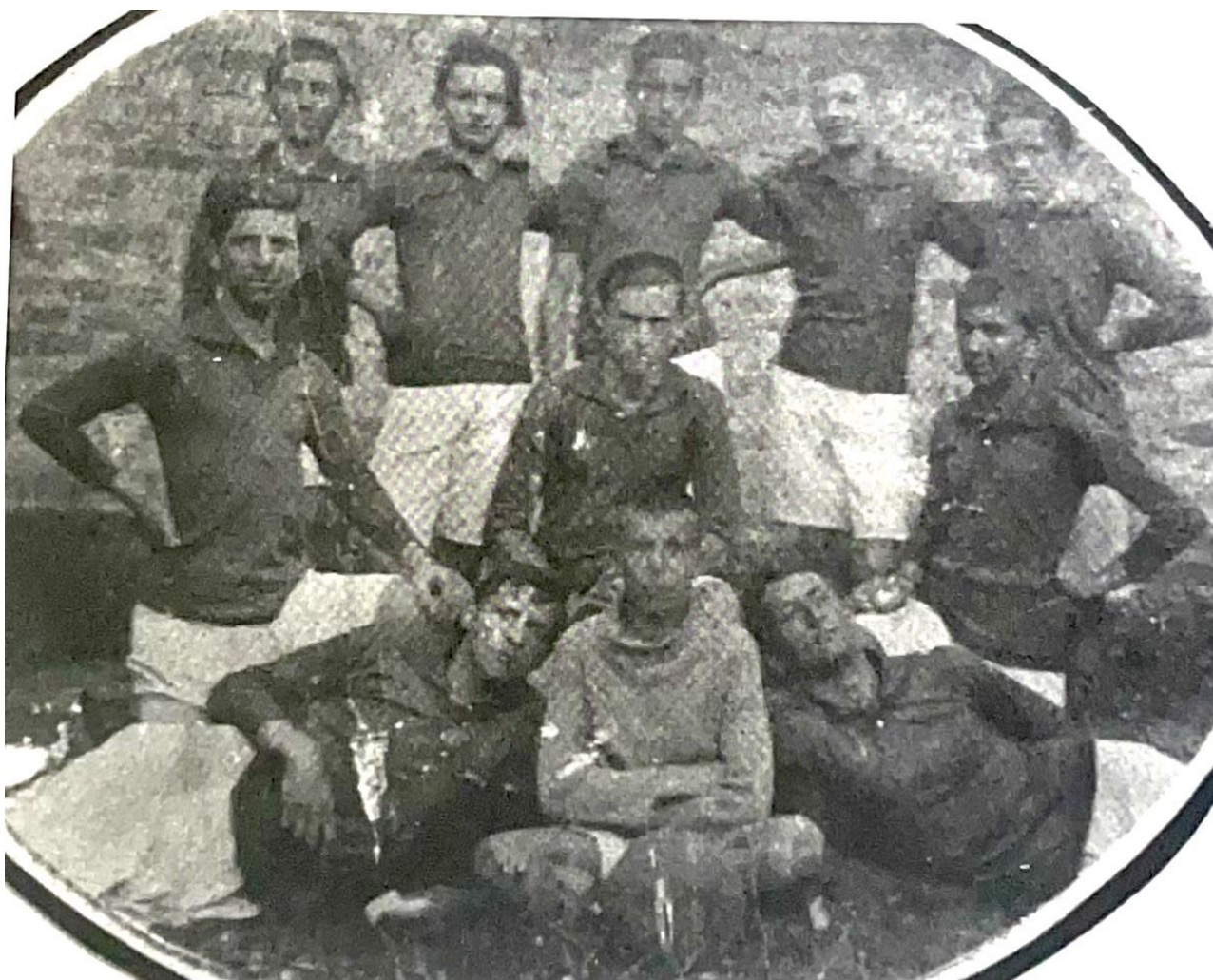
Prilog 4: Fotografija momčadi Slavije s prve utakmice, 17. rujna 1916.