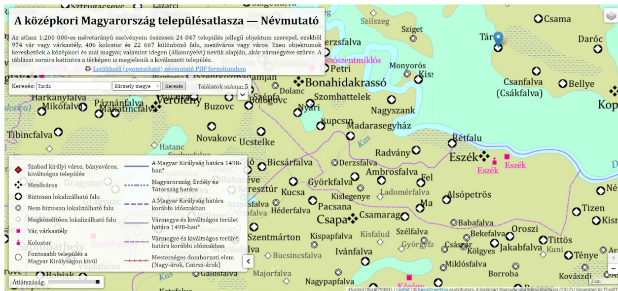
Slika 2. Smještaj Osijeka