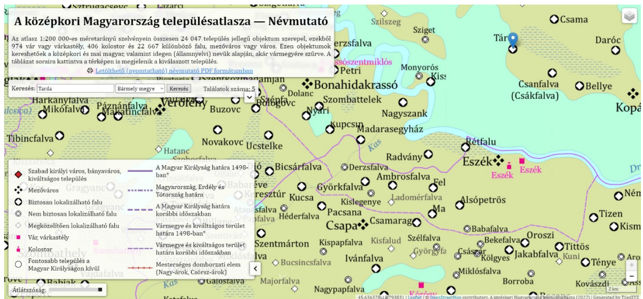
Slika 2. Smještaj Osijeka