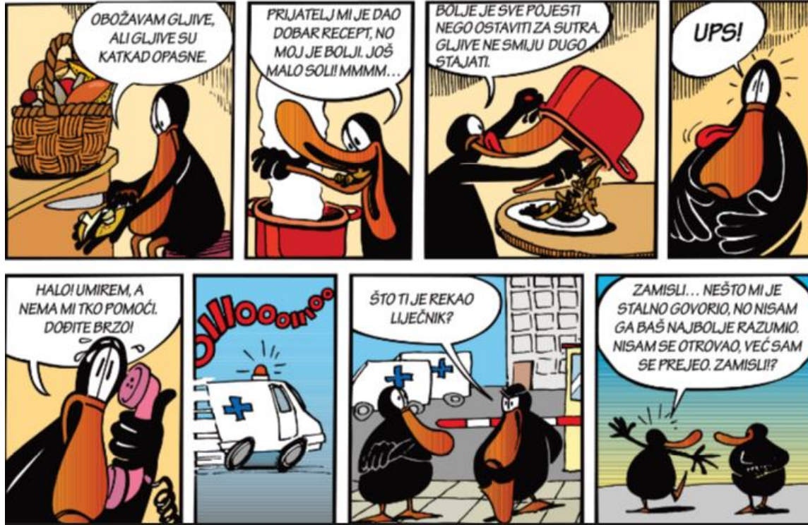
Slika 1. Strip kao primjer lingvometodičkoga predložka u nastavi Hrvatskoga jezika i komunikacije

Vježbeni tekst može biti i strip. Na ovome je primjeru moguća vježba nezavisnosloženih rečenica, primjerice suprotnih rečenica. Nakon što učenici pročitaju strip, moraju pronaći sve veznike u stripu ( a, ali, nego, no, već ). Učenici mogu odrediti odnose među surečenicama i navesti veznike koje povezuju surečenice. Učenici mogu primijetiti i da se kod suprotnih rečenica zarez gotovo uvijek piše, ali i da postoji iznimka kod veznika nego ( Bolje je sve pojesti nego ostaviti za sutra ), ako se koristi nakon rečenice u kojoj je atribut u komparativu. Vježbom na primjeru stripa učenici mogu sami izvesti određenu definiciju suprotnih rečenica. Učenici radom na stripu kao vježbenom tekstu mogu jasno opisati suprotne rečenice. Uz pomoć suprotnih veznika mogu prepoznati i pisati suprotne rečenice. Također, učenici mogu razlikovati suprotne od rastavnih i sastavnih rečenica i usporediti njihove razlike i sličnosti.