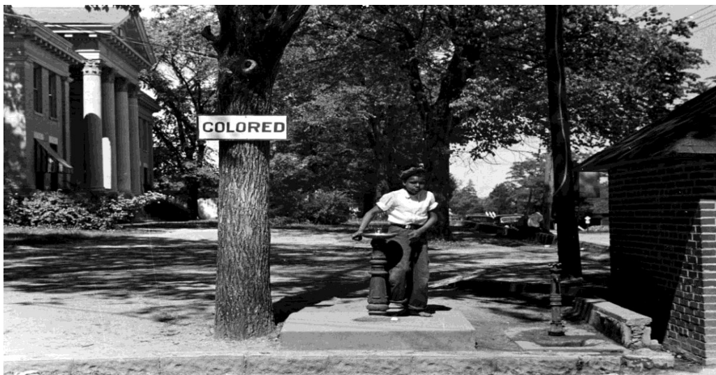
Slika 3 – Prikaz odvojenih fontana za vodu kao posljedica Jim Crowa

dom te je postignut dogovor između Demokrata i Republikanaca, poznat i kao „Kompromis 1877“. Dvadeset spornih elektorskih glasova su dani Rutherfordu B. Hayesu, republikanskom kandidatu, koji je onda obećao povući vojsku s Juga i službeno završiti Rekonstrukciju. Ponovno slanje vojske na Jug spriječeno je sa Posse Comitatus zakonom koji je zabranio korištenje federalne vojske u provođenju unutarnje politike. 43 Rekonstrukciju su Republikanci napustili da bi ostali na vlasti, ali isto tako treba shvatiti to da vjerojatno ništa nisu mogli više ni napraviti jer su gubili na popularnosti. Kraj Rekonstrukcije i povlačenje vojske s Juga značilo je da sada ništa nije spriječavalo Demokrate da pokušaju vratiti stvari kakve su bile prije rata. Kako bi još više osigurali svoju moć su stvorili Jim Crow zakone, koji su imali zadaću potpuno segregirati Jug. Ranije spomenuti testovi pismenosti i porezi na glasanje su prošireni kako bi se što više Afroamerikancima otežalo glasanje te ih zapravo odgovoriti od ikakvog sudjelovanja u političkom životu što će Demokratima osigurati prevlast u tim savezним državama jedno cijelo stoljeće. 44