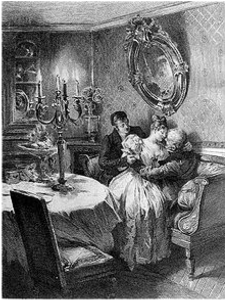
Slika 1. Rastignac, Delphine i Goriot u novom stanu

Ulazak u salon predstavlja Rastignacov ulaz u visoko društvo u kojemu se Delphine već nalazi.