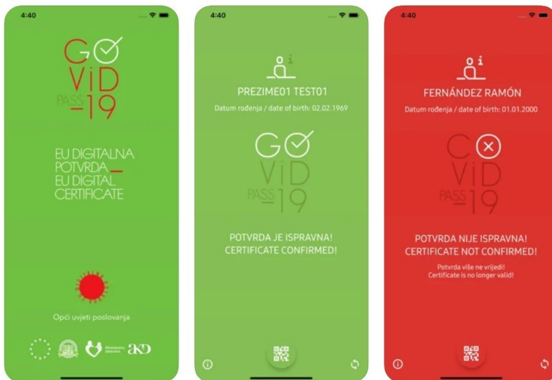
Slika 4, primjer iz aplikacije CovidGO 37