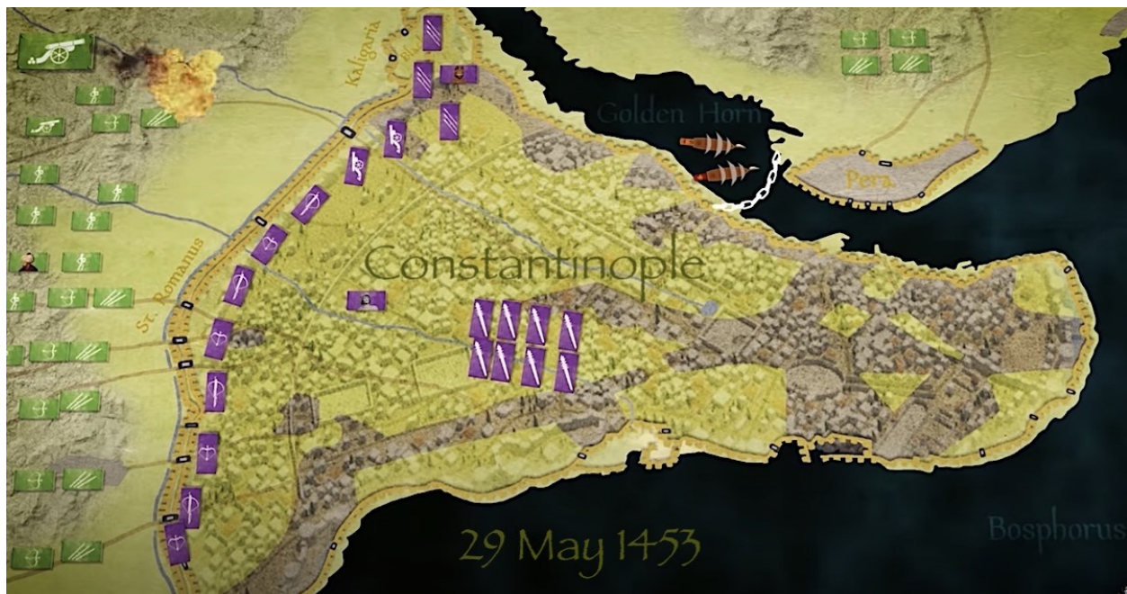
Klika 3 - Opsada Carigrada 1453. godine (zeleni pravokutnici označavaju osmanske snage, ljubičasti pravokutnici označavaju bizantske snage) 84

Sultan Mehmed II. na vlast je došao iznimno mlad. Balkanski vladari osjećali su olakšanje nakon smrti Murata II. jer su smatrali da Mehmed kao devetnaestogodišnji sultan nema dovoljno iskustva kako bi nastavio očeve pohode no mišljenje im se uskoro promijenilo. Samo dvije godine nakon stupanja na sultanski tron, 1453. godine Mehmed osvaja Carigrad i dobiva nadimak Osvajač jer je uspio u onome što njegovi prethodnici Bajazid I. i Murat II. nisu. 83