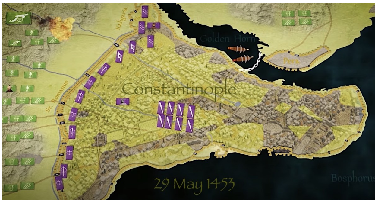
Klika 3 - Opsada Carigrada 1453. godine (zeleni pravokutnici označavaju osmanske snage, ljubičasti pravokutnici označavaju bizantske snage) 84

Sultan Mehmed II. na vlast je došao iznimno mlad. Balkanski vladari osjećali su olakšanje nakon smrti Murata II. jer su smatrali da Mehmed kao devetnaestogodišnji sultan nema dovoljno iskustva kako bi nastavio očeve pohode no mišljenje im se uskoro promijenilo. Samo dvije godine nakon stupanja na sultanski tron, 1453. godine Mehmed osvaja Carigrad i dobiva nadimak Osvajač jer je uspio u onome što njegovi prethodnici Bajazid I. i Murat II. nisu. 83