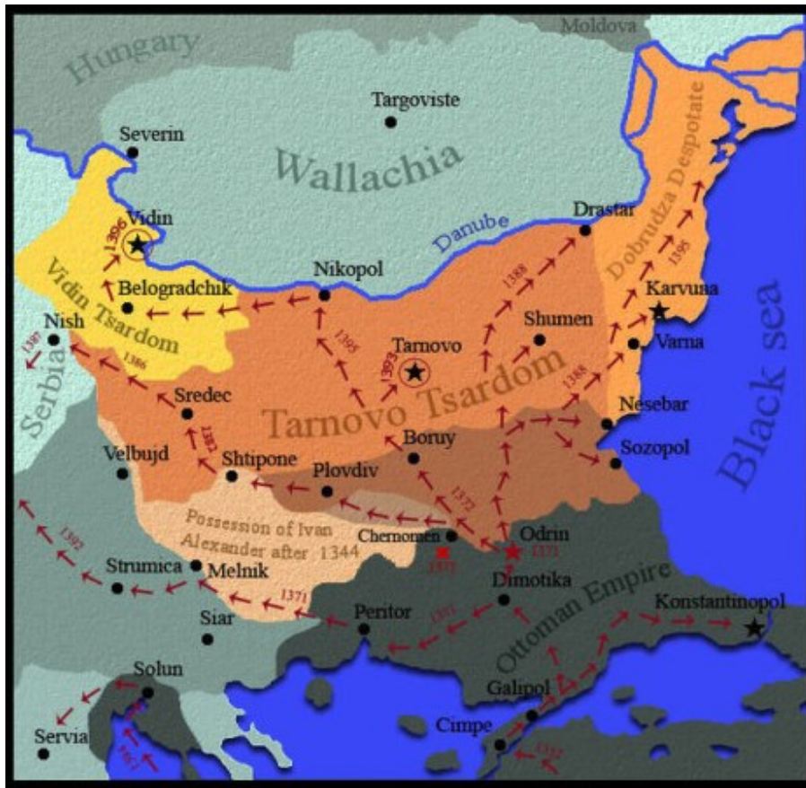
Karta 1 - Mjesto sukoba srpske i osmanske vojske na rijeci Marici 1371. te daljnji tijek kretanja osmanske vojske 32

Posljedice Maričke bitke bile su katastrofalne. Nedugo nakon završetka bitke, 2. ili 4. prosinca 1371. godine car Uroš V. umire bez nasljednika. Njegova smrt obilježava kraj dinastije Nemanjića koja je na čelu srpskog teritorija bila gotovo dva stoljeća. Nadalje od tog trenutka Srpsko Carstvo uistinu prestaje postojati jer carske figure više nema. Niti jedna osoba u tom trenutku nije bila dovoljno snažna da se proglasi carem Srba. No 1377. godine bosanski ban Tvrtko I. Kotromanić okrunio se dvostrukom krunom za kralja Bosne i Srba. Miloš Blagojević u svojoj knjizi opravdava Tvrtkov potez i objašnjava na koji to način njemu kruna faktički i može pripasti te navodi postojanje dvaju kraljeva u to vrijeme. Naime, po ženskoj liniji Tvrtko je bio potomak kralja Dragutina, a po muškoj liniji bio je potomak vladarskog roda Kotromanića. Osim njega, titulu kralja imao je i Vukašinov sin, kralj Marko. Međutim, ni Marko, ni Tvrtko nisu bili dovoljno jaki da bi postali carevi. Iako se broj oblasnih gospodara smanjio, činjenica je da su oni koji su preostali imali jaču moć nego ikada prije. Posebno se ističe knez Lazar Hrebeljanović koji nije