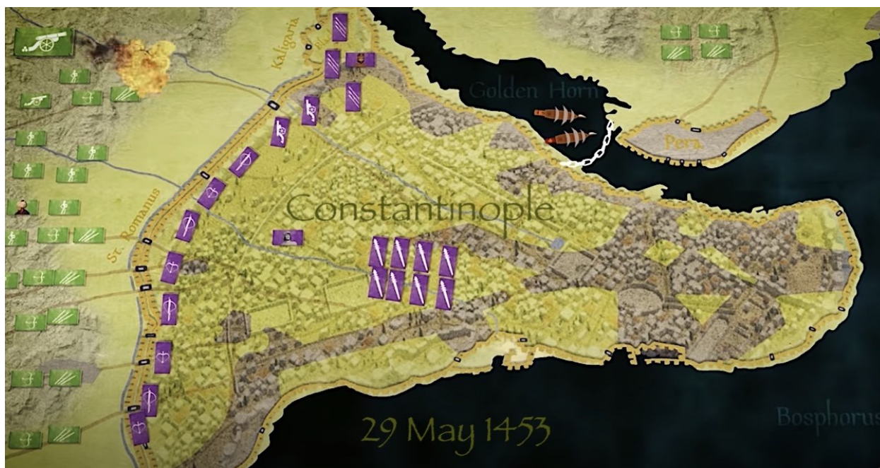
Klika 3 - Opsada Carigrada 1453. godine (zeleni pravokutnici označavaju osmanske snage, ljubičasti pravokutnici označavaju bizantske snage) 84

Sultan Mehmed II. na vlast je došao iznimno mlad. Balkanski vladari osjećali su olakšanje nakon smrti Murata II. jer su smatrali da Mehmed kao devetnaestogodišnji sultan nema dovoljno iskustva kako bi nastavio očeve pohode no mišljenje im se uskoro promijenilo. Samo dvije godine nakon stupanja na sultanski tron, 1453. godine Mehmed osvaja Carigrad i dobiva nadimak Osvajač jer je uspio u onome što njegovi prethodnici Bajazid I. i Murat II. nisu. 83