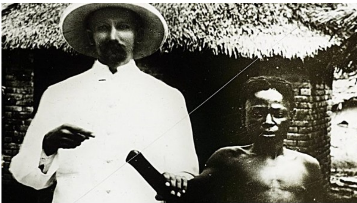
Slika 2. Fotografija osakaćenog Kongoanca.