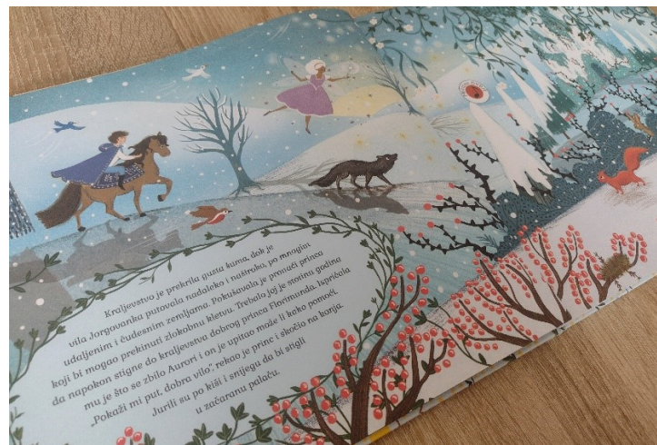
Slika 2. Trnoružica – priča i ilustracije