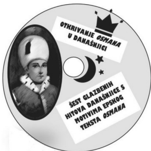
CD Otkrivanje Osmana u današnjici (izradila Lorena Klepo)

Još jedna varijanta sastavljanja popisa glazbenih brojeva na temelju sadržaja književnoga djela izrada je književnog CD-a. Iako je ovaj zadatak moguće izvršiti u digitalnim alatima u sklopu izvannastavnoga rada, najbolje je pripremiti čvršći papir za omotnicu, bojice, flomastere, škare, ravnalo i CD te izraditi fizičke primjerke tijekom interpretacije, usustavljanja ili sata lektire. Osim odabira pjesama koje su vezane uz neki element književnoga djela, učenici trebaju ilustrirati CD omotnicu ili ručno izraditi pravu omotnicu koja s prednje strane treba sadržavati naslov CD-a te primjerenu tematsku ilustraciju, a sa stražnje strane popis pjesama s objašnjenjima povezanih sastavnica. Sabljčić napominje kako bi se u ovom slučaju trebalo posebno poticati povezivanje književnih djela s učenicima bliskim, suvremenim pjesmama te ističe kako se pored književnoga ukusa sastavljanjem popisa zvučne pratnje književnom djelu pokazuje i njeguje i glazbeni ukus koji bi se trebao uzdići iznad trivijalne razine lakih nota (2021: 518). Slijedi primjer izrađen na temelju Gundulićeva Osmana :