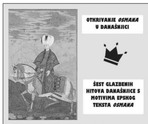
CD Otkrivanje Osmana u današnjici prednja strana omotnice (izradila Lorena Klepo)