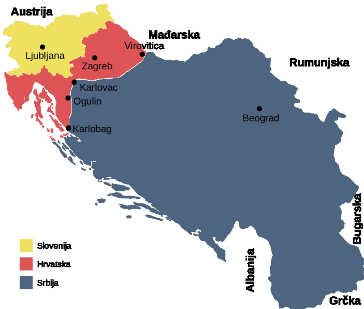
Slika 1: Granice Velike Srbije prema Memorandumu SANU

su da je Memorandum izravno utjecao na jačanje djelovanja srpskih nacionalista u Hrvatskoj. 26 Treba napomenuti, kako navodi Raif Dizdarević u svojoj knjizi Od smrti Tita do smrti Jugoslavije , da se Memorandum često pogrešno navodi kao kamen temeljac suvremenog srpskog nacionalizma. Naime, on je bio prožet kroz strukture sustava i u vremenu prije Titove smrti. 27