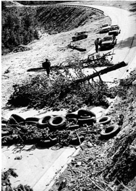
Slika 6: Blokirane prometnice u Hrvatskoj 1990.

Pobunjeni Srbi organizirali su naoružane straže, a na kriznom području vodeće osobe pobunjenih Srba proglasili su ratno stanje. Osim na spomenutom području, u idućim danima noćne straže organizirane su i na području Donjeg Lapca, Gračaca, Titove Korenice, Slunja, Vrginmosta i okolice Osijeka. Također, u nekim su općinama, kao npr. u Glini i Pakracu, lokalni Srbi organizirali prosvjedne skupove. 134 Vlada Republike Srpske Krajine kasnije je proglasila 17. kolovoza 1990. „Danom ustanka srpskog naroda“, a krajem srpnja 1992. taj isti 17. kolovoza 1990. označen je kao prvi dan rata na području RSK. 135 Hrvatska je strana zbog balvanima blokiranih prometnica te događaje prozvala „balvan-revolucijom“ 136