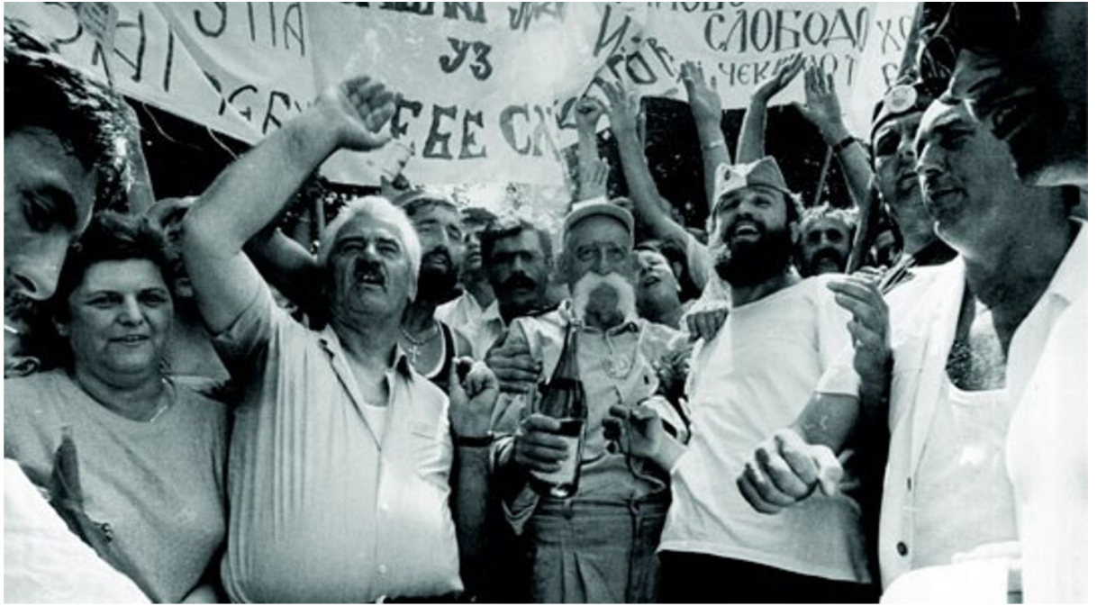
Slika 3: Miting hrvatskih Srba u Kninu 28. veljače 1989.

Novi je skup održan 9. srpnja 1989., u manastiru Krka i Kosovu pokraj Knina, gdje su okupljeni slavili 600. godišnjicu bitke na Kosovu polju. U općini Kistanje pokraj Knina osmog je srpnja, kao uvod u proslavu, utemeljena osnivačka skupština Srpskog kulturnog društva (SKD) „Zora“, s ciljem zaustavljanja navodnih trendova „političke i kulturne asimilacije i denacionalizacije srpskog naroda“ s toga područja. 79 Sljedećeg je dana na samoj proslavi, kako je to naveo Republički sekretarijat za unutarnje poslove SRH, zabilježen visok stupanj nacionalističkog naboja okupljenog mnoštva 80 od više desetaka tisuća Srba 81 , među kojima i militantnih grupa i pojedinaca. 82 Organizatori skupa namjerno su ugasili razglas prije znakovitog govora Jovana Opačića, koji se sadržajno poklapao s mišljenjima izraženim prethodnog dana u Kistanjama. Nakon Opačićeva govora uslijedio je „neslužbeni“ dio proslave 83 , kada su se među brojnim uzvicima okupljenog mnoštva čule i sljedeće parole: „Glavu damo, Kosovo ne damo“, „Ovo je Srbija“, „Hoćemo ćirilicu“, „Dalmaciju, da ti nije