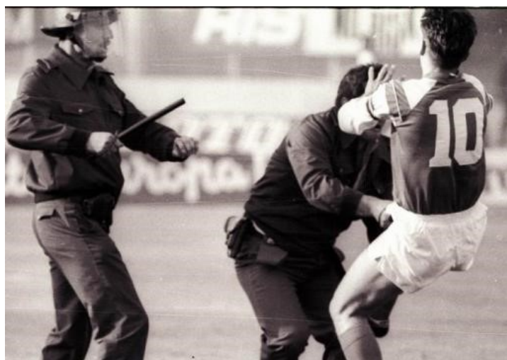
Slika 4: Zvonimir Boban udara milicajca 13. svibnja 1990.

s „Delijama“, navijačima „Crvene Zvezde“, među kojima je vrlo aktivan bio i budući ratni zločinac Željko Ražnatović Arkan. Tuča navijača nastavljena je i na terenu tijekom same utakmice, a posebno je zanimljiv detalj bio napad „Dinamova“ kapetana Zvonimira Bobana na milicajca, koji je, u kontekstu tadašnje političke situacije, predstavljao i otpor protiv srpske hegemonije u jugoslavenskim institucijama. 96 Nešto kasnije, 25. srpnja iste godine, Hrvatski je sabor usvojenim amandmanima na Ustav preimenovao Socijalističku Republiku Hrvatsku u Republiku Hrvatsku, a zvijezdu petokraku na zastavi zamijenio je hrvatskim povijesnim grbom, kojemu su ubrzo pridruženi i manji grbovi hrvatskih povijesnih pokrajina. 97