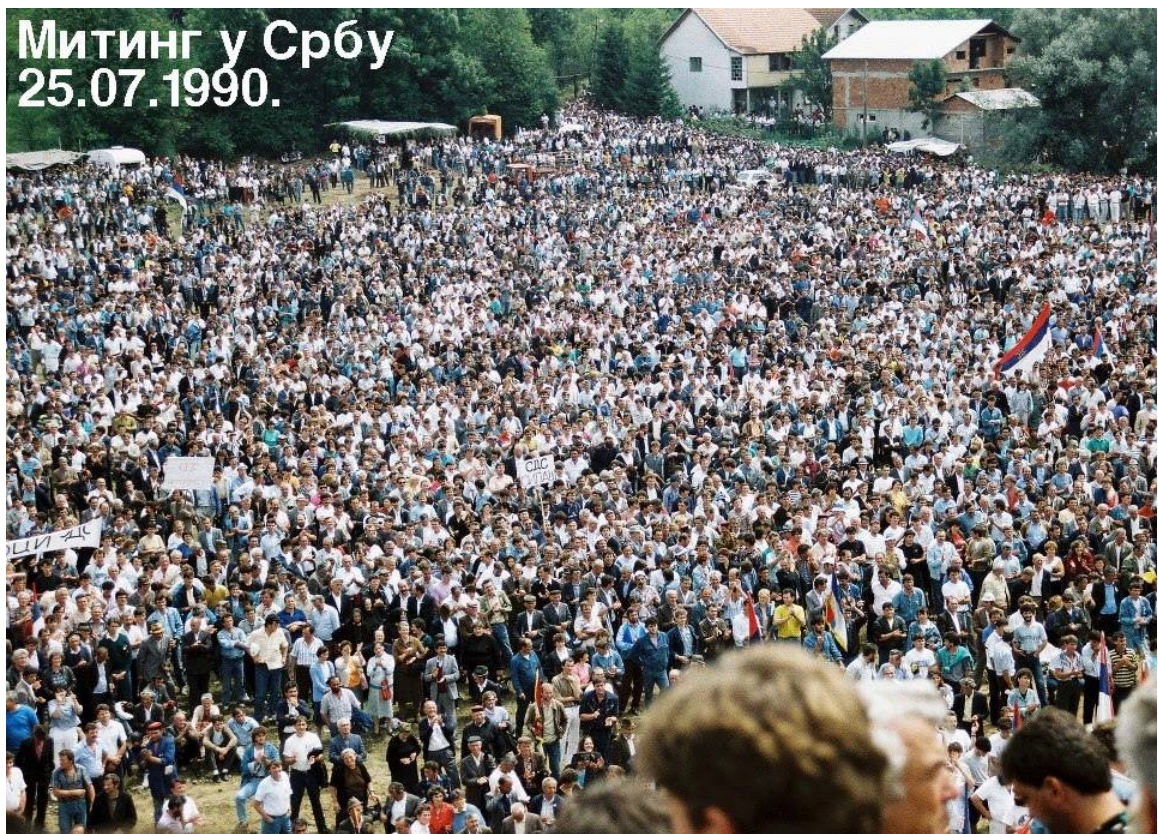
Slika 5: Miting u Srbu 25. 7. 1990.

U mjestu Srb 25. je srpnja 1990. održan masovni sastanak nazvan „Srpski sabor“, kao odgovor na ustavne amandmane koje je isti dan prihvatio Hrvatski sabor. Jedina točka dnevnog reda na zasjedanju „Srpskog sabora“ trebao je biti „ustavni položaj srpskog naroda u Hrvatskoj“. U pozivu za sudjelovanje na sastanku Milan Babić naveo je da „Srpski sabor“ sazivaju predsjednici „srpskih opština“ u Hrvatskoj i vodstvo Zajednice općina sjeverne Dalmacije i Like. „Srpski sabor“ donio je odluku o osnivanju Srpskog nacionalnog vijeća (SNV) s ciljem ostvarivanja srpske teritorijalne autonomije u Hrvatskoj. To je vijeće u određenom smislu bilo revolucionarno tijelo, čije je osnivanje označilo i formalni početak srpske pobune u Hrvatskoj. 109