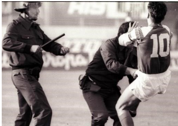
Slika 4: Zvonimir Boban udara milicajca 13. svibnja 1990.

s „Delijama“, navijačima „Crvene Zvezde“, među kojima je vrlo aktivan bio i budući ratni zločinac Željko Ražnatović Arkan. Tuča navijača nastavljena je i na terenu tijekom same utakmice, a posebno je zanimljiv detalj bio napad „Dinamova“ kapetana Zvonimira Bobana na milicajca, koji je, u kontekstu tadašnje političke situacije, predstavljao i otpor protiv srpske hegemonije u jugoslavenskim institucijama. 96 Nešto kasnije, 25. srpnja iste godine, Hrvatski je sabor usvojenim amandmanima na Ustav preimenovao Socijalističku Republiku Hrvatsku u Republiku Hrvatsku, a zvijezdu petokraku na zastavi zamijenio je hrvatskim povijesnim grbom, kojemu su ubrzo pridruženi i manji grbovi hrvatskih povijesnih pokrajina. 97