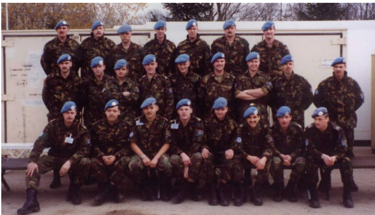
Slika 8: Snage UNPROFOR-a u Zagrebu 1992.