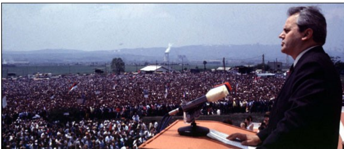
Slika 2: Miloševićev nastup na Kosovu polju 1989.