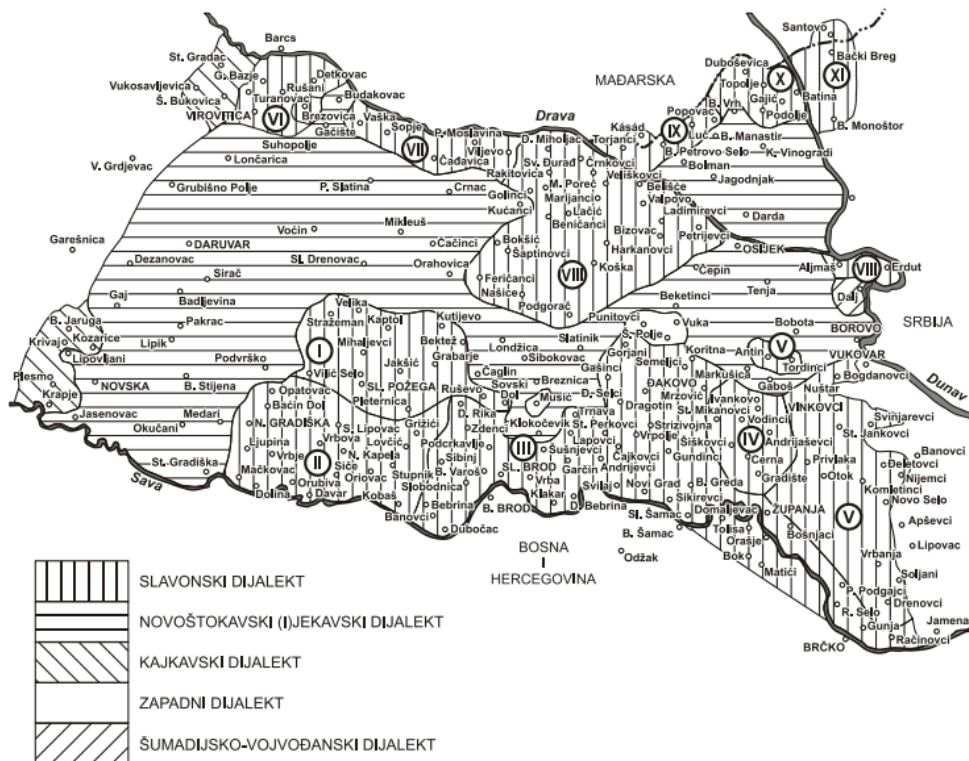
Slika 1 – karta slavonskoga dijalekta (Sekereš, 1967, navedeno prema Lisac, 2003: 8)

Često su u narodu slavonski govori poznatiji kao šokački govori kojima govore Šokci. U dijalektologiji pronalazimo još nekoliko naziva, koji se u jednakoj mjeri odnose na slavonski dijalekt, a to su „staroštokavski šćakavski, nenovoštokavski arhaični šćavski dijalekt“ (Berbić Kolar, Kolenić, 2014: 7). Slavonski se dijalekt dijeli na posavski, podravski i podunavski poddijalekt. U južnom dijelu, odnosno u posavskom poddijalektu, riječ je o ikavsko i ikavsko-jekavskim govorima, u sjevernom ili podravskom poddijalektu ekavski je govor, a u baranjskom ili podunavskom dijelu riječ je o ikavsko-ekavskom govoru (isti: 19). Područje proučavanja ovoga rada središnja je slavonska Posavina (ikavsko-jekavski govor).