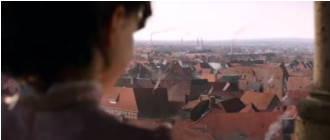
Abb. 4 – Heidi kann die Berge nicht sehen

(53:11; Abb. 4), in der Heidi die Häuser und Fabriken statt der Berge sieht, wirkt besonders effektiv. In Spyris Roman ist die Atmosphäre jedoch anders als im Film: „Heidi sah auf ein Meer von Dächern, Türmen und Schornsteinen nieder; es zog bald seinen Kopf zurück und sagte niedergeschlagen: ‘Es ist gar nicht, wie ich gemeint habe’“ (Spyri 1978a: 65). Heidi ist traurig, aber es gibt eigentlich keine Aufregung wie in Gsponers Verfilmung.