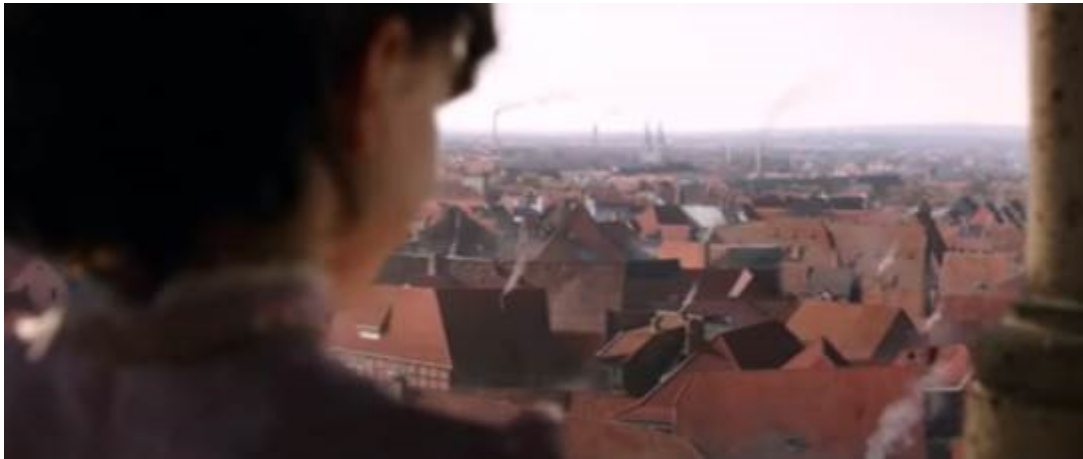
Abb. 4 – Heidi kann die Berge nicht sehen