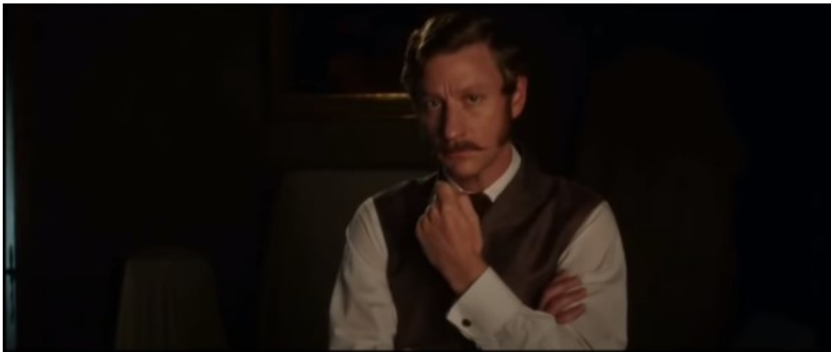
Abb. 14 – Her Sesemann steht vor dem Porträt Klaras Mutter