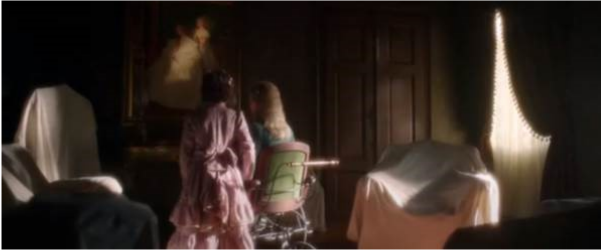
Abb. 10 – Heidi und Klara vor dem Porträt Klaras Mutter