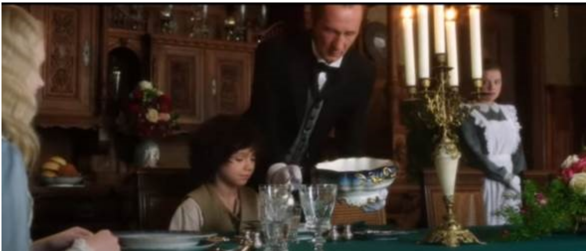
Abb. 3 – Das erste Abendessen