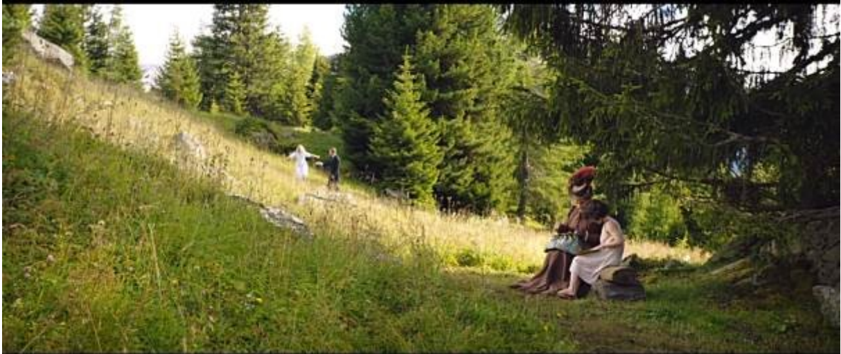
Abb. 32 - Totale

Wenn man diese zwei Darstellungen von Klaras Großmutter betrachtet, bekommt man eigentlich einen sehr ähnlichen Eindruck, mit der Ausnahme der religiösen Elementen. Die Abwesenheit der Religiosität, die in der Verfilmung völlig unwichtig ist, bringt Klaras Großmutter näher zu allen Kindern, unabhängig von ihrer Religion und Religiosität.