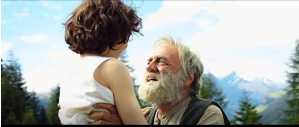
Abb. 26 – Das Wiedersehen

In Spyris Werk spielt sich diese Episode ähnlich ab: