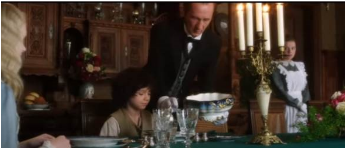
Abb. 3 – Das erste Abendessen

Wenn es um die zweite Phase in Heidis Leben geht, nämlich um die Ankunft und das Leben in Frankfurt, spielt sich die Handlung in der Verfilmung fast gleich wie im Roman ab. Die Episode, in der Heidi zum ersten Mal zum Abendessen geht (39:44-42:05) ist besonders lustig. Das wurde meistens durch die spielerische Musik und durch Heidis erfolgreiche Versuche „Kann ihr mir bitte zwei Brötchen reichen“ (40:45-41:14) zu sagen erreicht. Diese Versuche sind eigentlich Gspomers Idee. Wenn man bedenkt, dass die Geschichte von Heidi vor allem für Kinder bestimmt ist, bereichert ein solcher lustiger Wechsel diese Episode und, was auch wichtig ist, betont er Heidis Position als einen Außenseiter noch mehr als das im Sprosswerk der Fall ist.