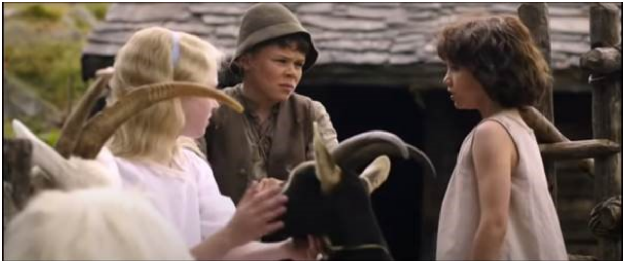
Abb. 17 – Peter lernt Klara kennen

Peters Wut zeigt sich vielleicht in seiner Einstellung zu Klara am besten. Wenn er Klara in Gsponers Verfilmung kennenlernt, ist er offensichtlich nicht begeistert (1:31:54-1:32:44). In der folgenden Szene (Abb. 17) sind die Kinder in der Nahe gefilmt und man kann klar sehen, wie Peter nur auf Heidi schaut und so tut, als ob Klara nicht da wäre.