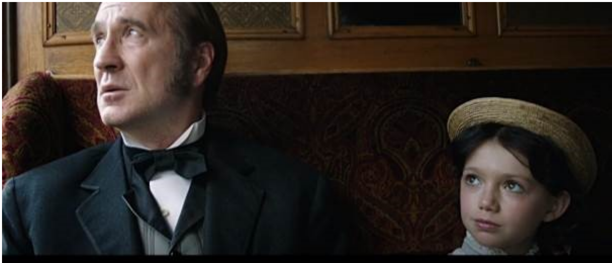
Abb. 27 – Sebastian und Heidi auf der Reise

Wenn es um die Heidi -Romane geht, zeigt sich seine Einstellung zu der Alm in Klaras Brief, den sie Heidi im zweiten Roman schreibt, sehr deutlich: