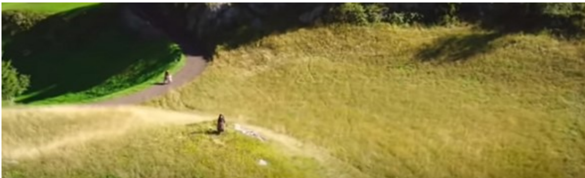
Abb. 1 - Supertotale

In der folgenden Szene (01:09-01:14; Abb. 1) sieht man eine Supertotale, sodass man die Größe der im Splyris Werk beschriebenen Umgebung begreifen kann. „Die Supertotale kann Gefühle wie Unendlichkeit oder Freiheit aber auch Einsamkeit oder Isolierung ausdrücken.“ 2 In diesem Fall betont diese Supertotale erfolgreich genau die Gefühle der Unendlichkeit und Freiheit. Die Supertotale wird allgemein im Film oft zu diesem Zweck benutzt.