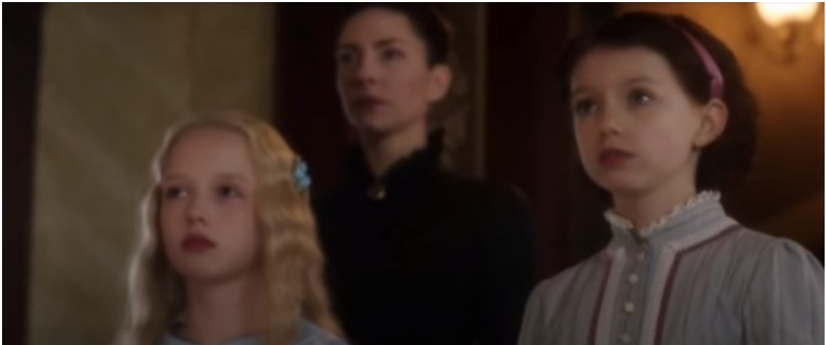
Abb. 11 – Untersicht

Während dieser Verabschiedung nimmt Klara Heidis Hand und sie halten sich an den Händen bis die Großmutter weg ist und bis Fräulein Rottenmeier das abbricht. Das ist sehr bedeutend. Es zeigt, dass Klara sich an Heidi festzuhalten versucht, weil sie wieder von jemandem, den sie liebt, verlassen wird. Es ist ein starker Moment, der Klaras psychologischen Zustand klar darstellt.