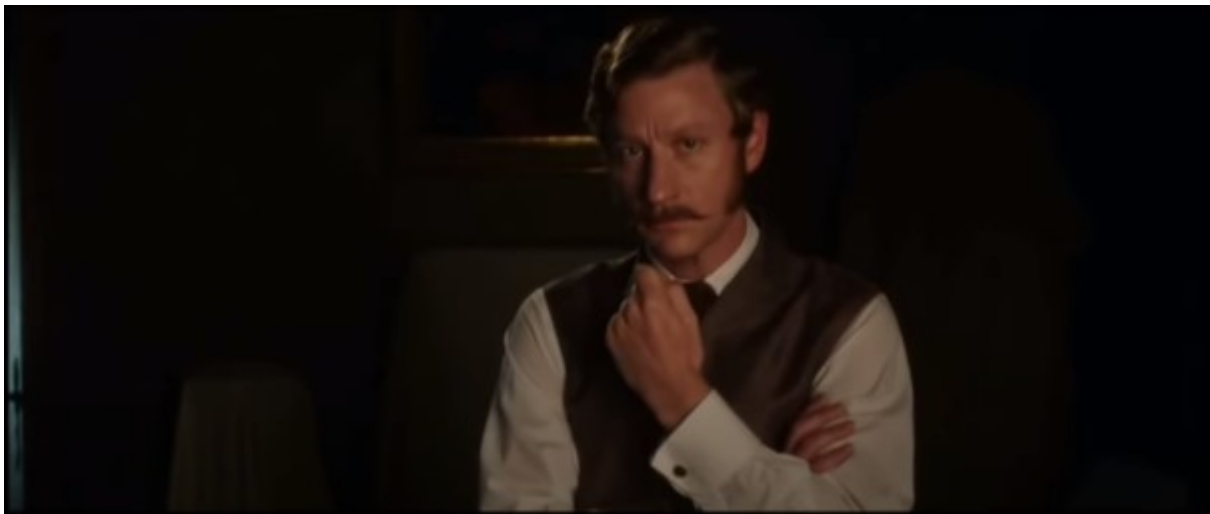
Abb. 14 – Herr Sesemann steht vor dem Porträt Klaras Mutter