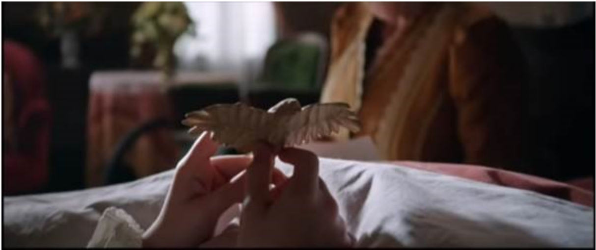
Abb. 15 – Der geschnitzte Vogel