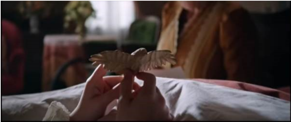
Abb. 15 – Der geschnitzte Vogel