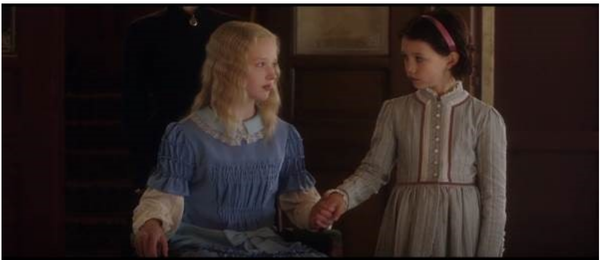
Abb. 12 - Heidi und Klara halten sich an den Händen

Während dieser Verabschiedung nimmt Klara Heidis Hand und sie halten sich an den Händen bis die Großmutter weg ist und bis Fräulein Rottenmeier das abbricht. Das ist sehr bedeutend. Es zeigt, dass Klara sich an Heidi festzuhalten versucht, weil sie wieder von jemandem, den sie liebt, verlassen wird. Es ist ein starker Moment, der Klaras psychologischen Zustand klar darstellt.