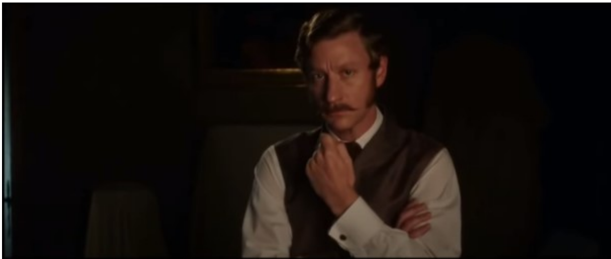
Abb. 14 – Herr Sesemann steht vor dem Porträt Klaras Mutter

Bevor Herr Sesemann ihrer Tochter die für sie schlechten Nachrichten brachte, stand er nachdenklich und bestürzt vor dem Porträt ihrer Frau (1:18:15-1:18:31), demselben Porträt vor dem Heidi und Klara früher gestanden sind (siehe Abb. 10 – Heidi und Klara vor dem Porträt Klaras Mutter). Das ist ein starker Moment, der eine bedeutende Veränderung signalisiert und der eigentlich Gsponers Idee ist.