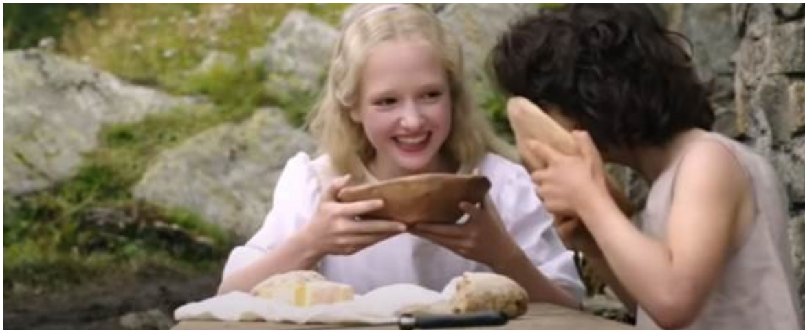
Abb. 7 – Heidi und Klara essen

Die letzten fünfzehn Minuten, die die dritte Phase in Heidis Leben darstellen, sind die Verfilmung von Spyris Nachfolgerroman Heidi kann brauchen, was es gelernt hat . In diesem Teil der Geschichte sind eher Klara und andere Gestalten im Zentrum. Sie besucht Heidi und es ist besonders interessant, wie Heidi jetzt Klara ihre „Regel“ beim Essen beibringt (1:32:45-1:33:25). Der Kontrast zwischen dieser Szene (Abb. 7) und der Szene, in der Heidi zum ersten Mal in Frankfurt isst (siehe Abb. 3 – Das erste Abendessen), ist offensichtlich. Hier sind die Kinder froh und unbelastet von Regeln und sozialen Normen, was eine völlig andere Atmosphäre erschafft.