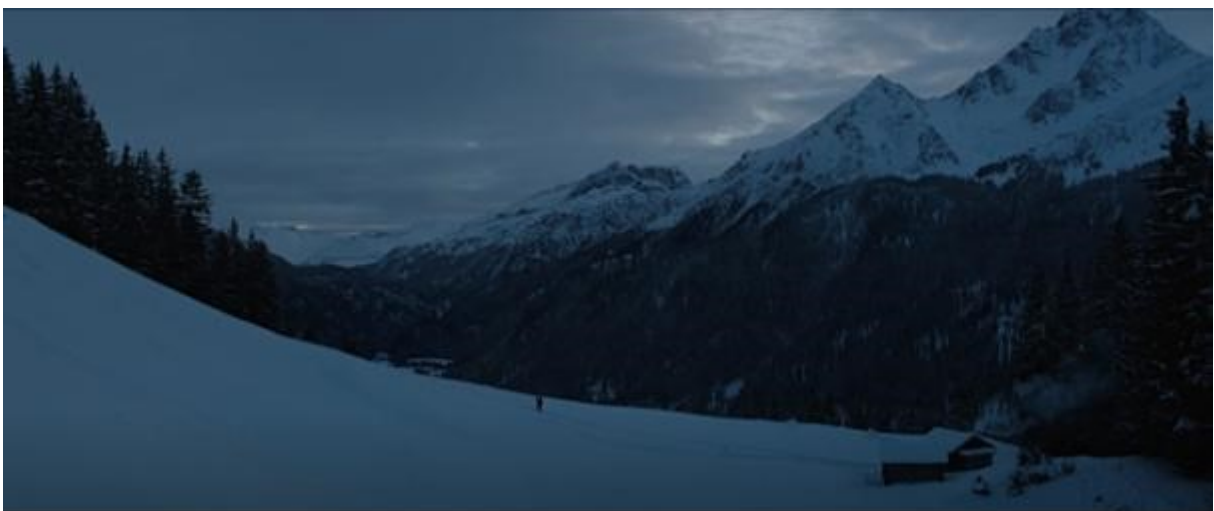
Abb. 22 – Schneelandschaft; Supertotale

Vor der Analyse einer der wichtigsten Momente im ersten Teil von Heidis Geschichte soll man eine weitere Supertotale erwähnen. Die folgende Szene (27:53-28:04; Abb. 22) zeigt den Großvater und Heidi auf seinen Rücken, als sie zurück von Peters Hütte durch den Schnee gehen. Die Berge wirken sehr mächtig und die Supertotale zeigt wieder ihre Unendlichkeit (vgl. Abb. 1 – Supertotale). Außerdem zeigt diese Supertotale die Zusammenhalt zwischen Heidi und dem Großvater.