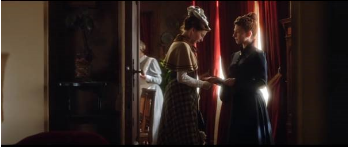
Abb. 29 – Dete bekommt Geld von Fräulein Rottenmeier

Im Buch bekommt sie kein Geld aber sie verlässt das Haus schnell und verschwindet aus Heidis Leben, was ihre Zuneigung für Heidi höchst bedenklich macht.