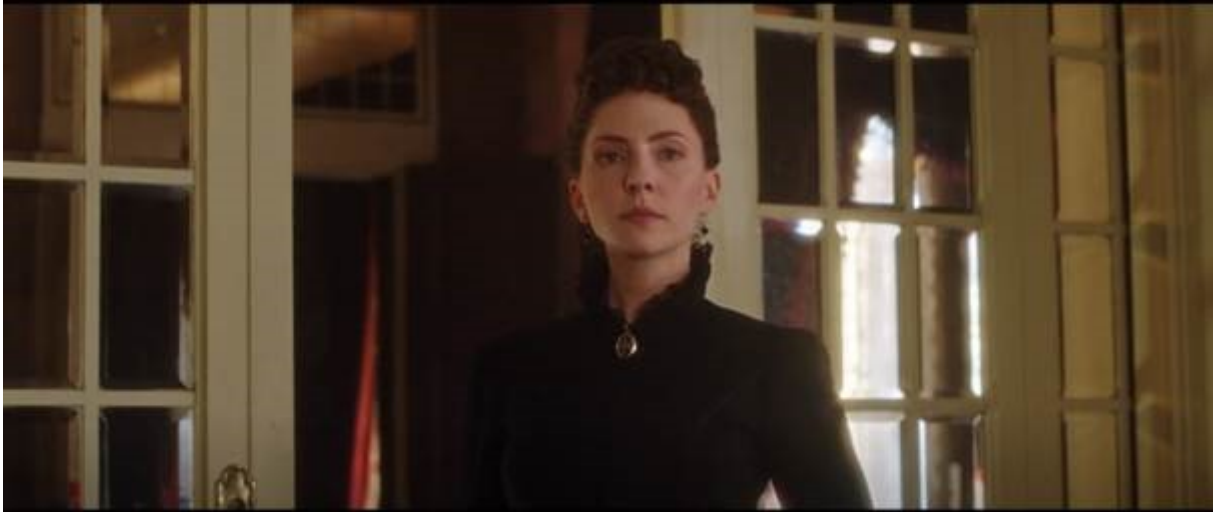
Abb. 30 – Fräulein Rottenmeier; Untersicht 1