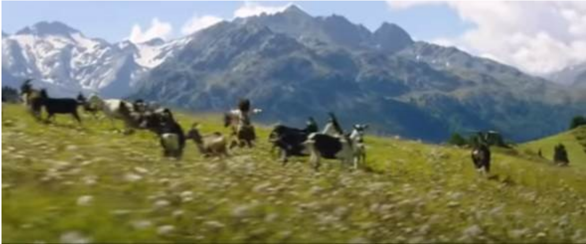
Abb. 8 – Heidi läuft in die Natur

Als Heidi aufhört, zu laufen, wird der Horizontalschwenk eingesetzt, um die Umgebung zu zeigen und das Glücksgefühl darzustellen. 6 In der allerletzten Szene (1:44:52) sieht man Heidi in der Nahe. Solche Kameraeinstellung ist eingesetzt, so dass die Zuschauer besser „die Blicke und Reaktionen der Darsteller nachvollziehen“ 7 können. Heidi ist natürlich in dieser Szene froh und sie steht mit einem Lächeln auf ihrem Gesicht. In einem solchen Ende ist das Gefühl der Freiheit und der Einheit mit der Natur stark betont.