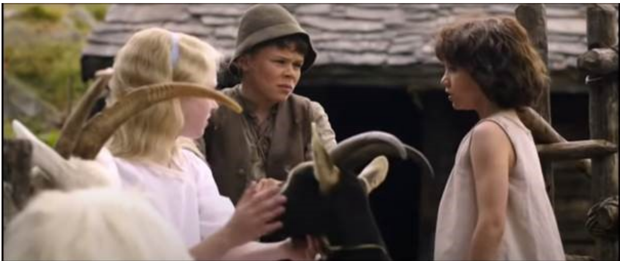
Abb. 17 – Peter lernt Klara kennen