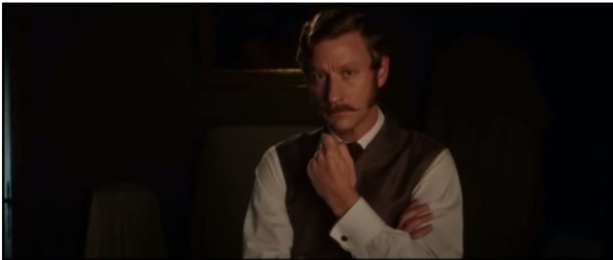
Abb. 14 – Her Sesemann steht vor dem Porträt Klaras Mutter