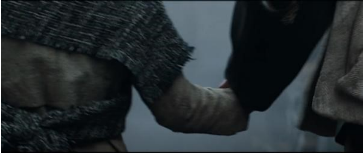
Abb. 21 – Heidi und der Großvater halten sich an den Händen

Sekunden (23:01-23:04). Das ist wieder eine Instanz, in der jemand Heidis Hand wegen der Unterstützung nimmt (vgl. Abb. 12 – Heidi und Klara halten sich an den Händen). Ein solches Moment gibt es in Spyris Werk nicht und man kann sagen, dass dieser Moment die Verletzlichkeit der Gestalt des Großvaters bereichert.