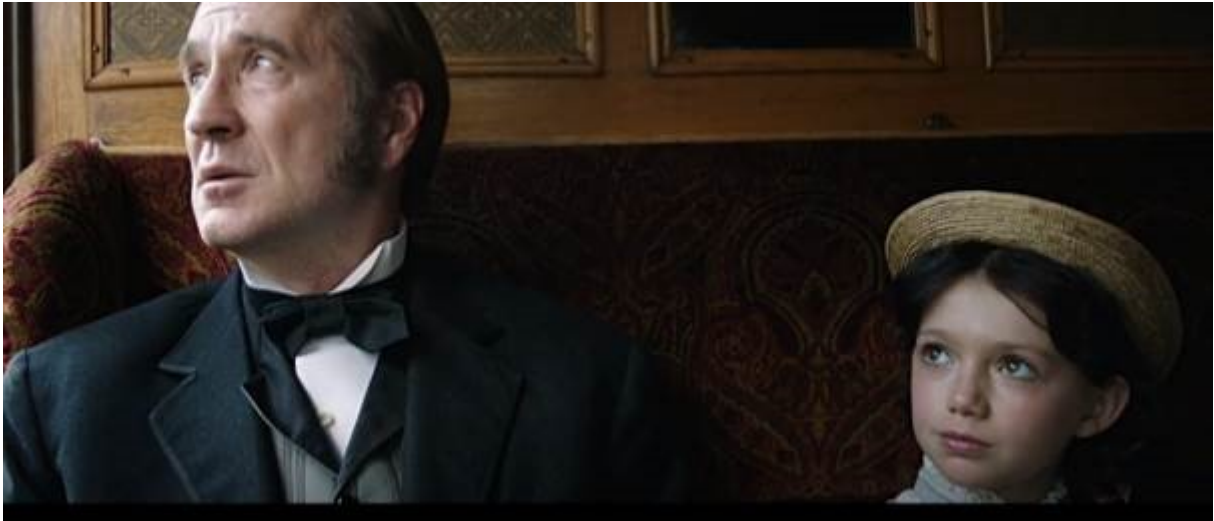
Abb. 27 – Sebastian und Heidi auf der Reise

Wenn es um die Heidi -Romane geht, zeigt sich seine Einstellung zu der Alm in Klaras Brief, den sie Heidi im zweiten Roman schreibt, sehr deutlich: