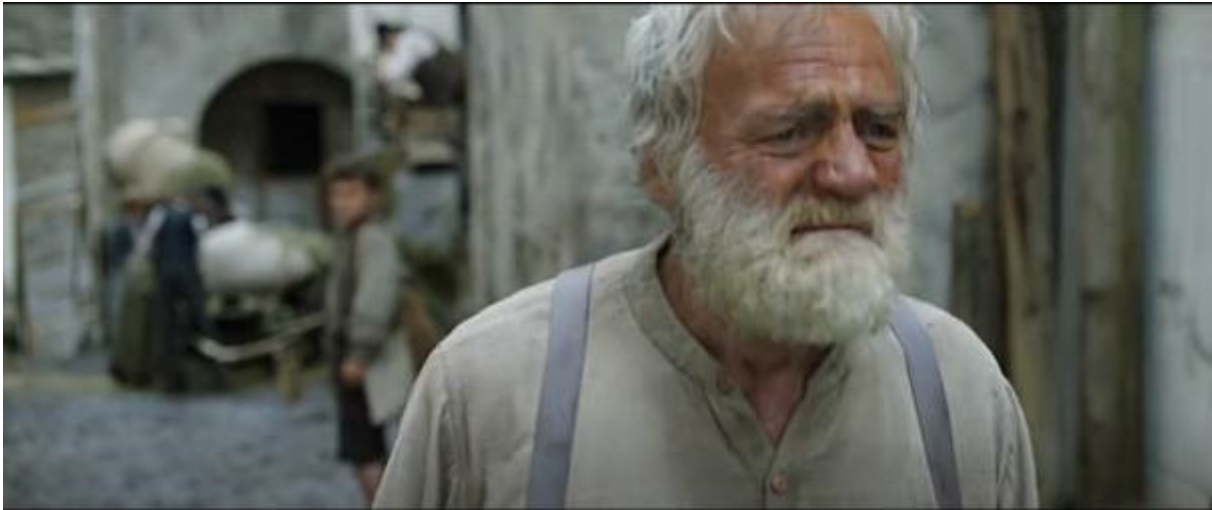
Abb. 25 – Der resignierte Großvater; Nahe

In der Szene, in der er resigniert zurück zu seine Hütte geht, wurde er ziemlich lang, für zwanzig Sekunden, in der Nahe gefilmt und alles hinter ihm, inklusive Peter, wird verschwommen, sodass nur er im Zentrum sein werden kann (33:35-33:55). Während dieser Episode spielt auch eine traurige Melodie. Alle diese Elemente machen diese Episode sehr emotional und dieses Ereignis wird dadurch intensiviert.