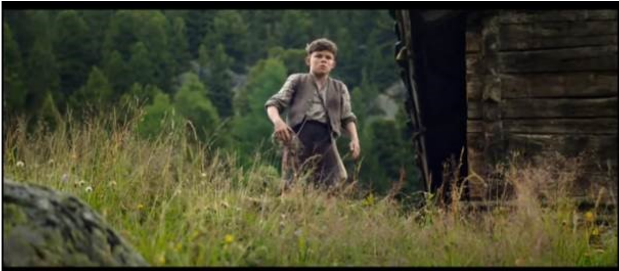
Abb. 18 – Peter lässt Klaras Rollstuhl rollen

Situationen beschrieben. Diese Wut kulminiert in einer der bekanntesten Episoden der Kinder- und Jugendliteratur - die Insanz, in der Peter Klaras Rollstuhl zerstört. In Gsponers Verfilmung ist diese Episode (1:34:27-1:35:27) sehr dramatisch gemacht. Peter macht diese Entscheidung, nachdem er die zwei Mädchen lachen hörte und nachdem er den Rollstuhl sah. Nachdem er den Rollstuhl rollen ließ, ist er offensichtlich erschrocken. Er wird wegen der dramaturgischen Wirkung in der Untersicht gefilmt. 10 Der Fall des Rollstuhl ist schnell und dramatisch (1:35:08-1:35:19).