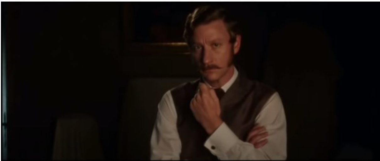
Abb. 14 – Her Sesemann steht vor dem Porträt Klaras Mutter