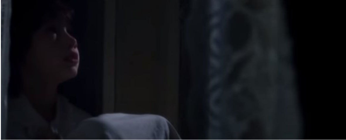
Abb. 5 – Heidi sitzt weinend neben dem Fenster

Heidis immer schlechter werdender Zustand hat zur Folge, dass sie zu schlafwandeln beginnt. Als ihr Schlafwandeln vom Herrn Doktor und Herrn Sesemann entdeckt wird, ist Heidi in der Halbtotale gefilmt. „Sie wird eingesetzt, um die Körpersprache und/oder die Bewegungen der Darsteller zu betonen.“ 5 Das hat zur Folge, dass Heidi und ihre Bewegungen gespenstisch aussehen. Außerdem wird durch eine solche Szene (Abb. 6) eine gewisse Poetik, die man in Spyris Werk bemerken kann, auch in der Verfilmung übertragen.