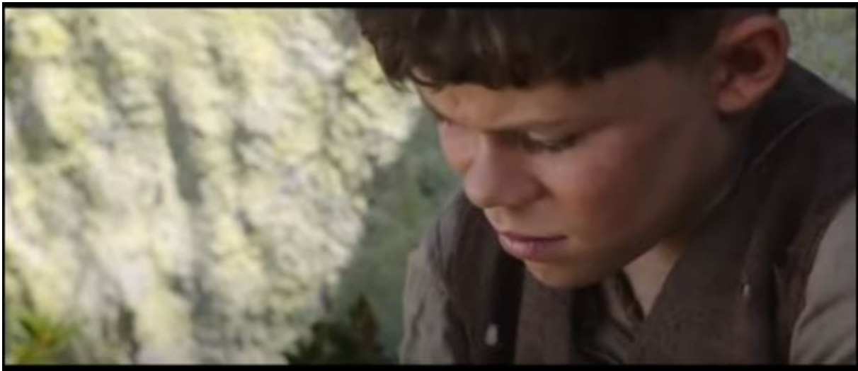
Abb. 19 – Peter fühlt sich schuldig; Großaufnahme

Vielleicht hat sich Gsponers dafür entschieden, diese Episode aus seiner Verfilmung auszulassen, weil sie ziemlich extrem für einen Kinderfilm wäre. In beiden Medien wird Peter später jedoch von Angst und Schuldgefühl gequält. Peters Schuldgefühl wird in Gsponers Verfilmung durch eine Großaufnahme dargestellt (1:37:57-1:38:11).