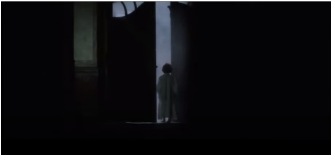
Abb. 6 – Heidi schlafwandelt

Heidis immer schlechter werdender Zustand hat zur Folge, dass sie zu schlafwandeln beginnt. Als ihr Schlafwandeln vom Herrn Doktor und Herrn Sesemann entdeckt wird, ist Heidi in der Halbtotale gefilmt. „Sie wird eingesetzt, um die Körpersprache und/oder die Bewegungen der Darsteller zu betonen.“ 5 Das hat zur Folge, dass Heidi und ihre Bewegungen gespenstisch aussehen. Außerdem wird durch eine solche Szene (Abb. 6) eine gewisse Poetik, die man in Spyris Werk bemerken kann, auch in der Verfilmung übertragen.