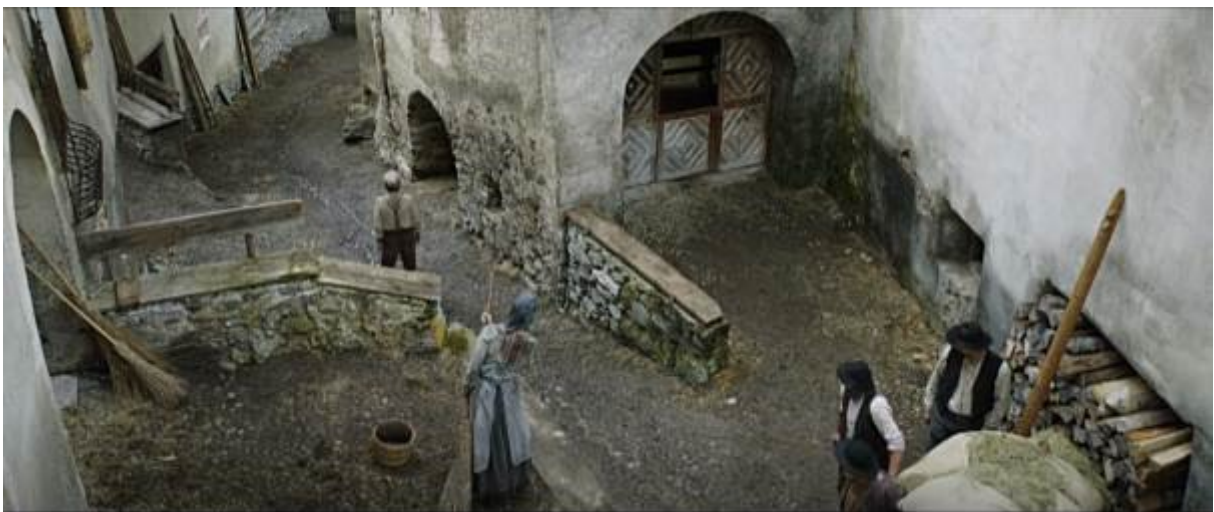
Abb. 24 – Aufsicht

Nachdem Dete Heidi hinter seinem Rücken mitnimmt, ist er sehr bestürzt und rennt sogar durch das Dorf, um Heidis Abreise zu verhindern (33:03-33:56). Nachdem ihm klar wurde, dass Heidi und Dete weggegangen sind, bleibt er stehen und nach einer Weile geht er, seine Tränen zurückhaltend, resigniert zurück zu seine Hütte. In der Szene, in der er stehen bleibt, wird er in der Vogelperspektive gefilmt, was die Intensität dieses Moments stark betont.