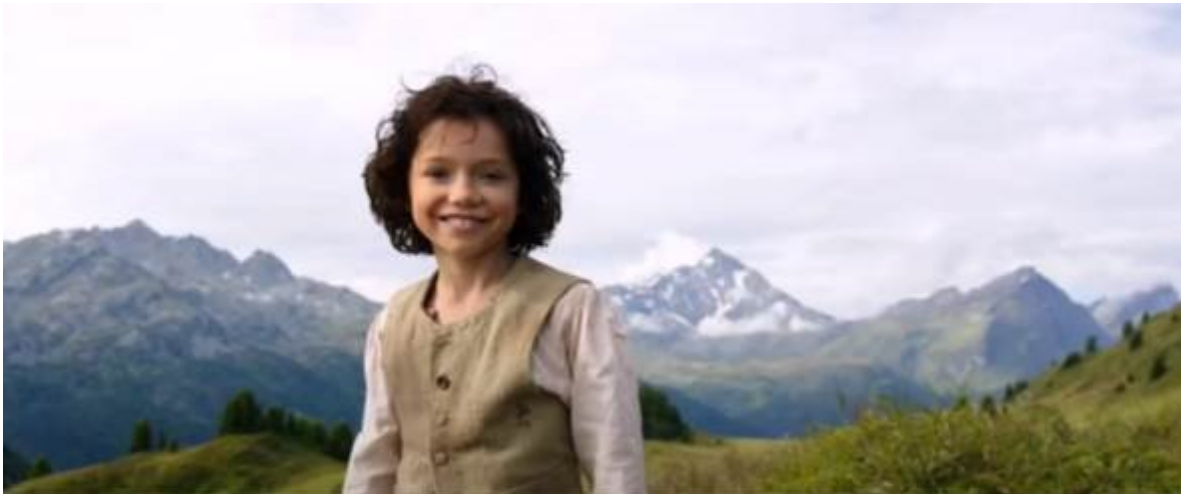
Abb. 9 – Die letzte Szene; Nahe

Als Heidi aufhört, zu laufen, wird der Horizontalschwenk eingesetzt, um die Umgebung zu zeigen und das Glücksgefühl darzustellen. 6 In der allerletzten Szene (1:44:52) sieht man Heidi in der Nahe. Solche Kameraeinstellung ist eingesetzt, so dass die Zuschauer besser „die Blicke und Reaktionen der Darsteller nachvollziehen“ 7 können. Heidi ist natürlich in dieser Szene froh und sie steht mit einem Lächeln auf ihrem Gesicht. In einem solchen Ende ist das Gefühl der Freiheit und der Einheit mit der Natur stark betont.