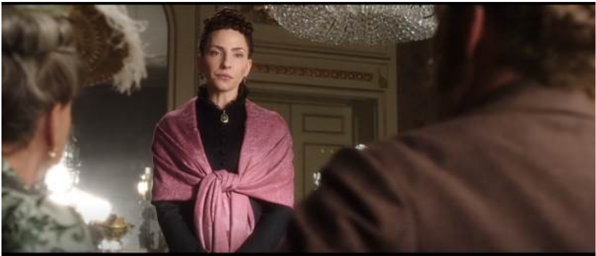
Abb. 31 – Fräulein Rottenmeier; Untersicht 2

An dieser Stelle soll man eine bedeutende Absicht der Autoren der Kinder- und Jugendliteratur dieser Epoche erwähnen, die Schikorsky erklärt: „Noch immer bestand das junge Lesepublikum ganz überwiegend aus Kindern der gebildeten Stände, und die sollten nicht zuletzt durch literarische Vorbilder an das spezifische Verhaltens-, Werte- und Bildungsrepertoire herangeführt werden, das als unverzichtbarer Standard bildungsbürgerlicher Selbstrepräsentation galt“ (2012: 56). Durch die Gestalt von Fräulein Rottenmeier zeigt Spyri eine sehr klare Einstellung zu den damaligen Verhaltensregeln, die die Kinder erlernen mussten und zu den Personen, die auf diesen Regeln insistieren. Wie schon gesagt sind nach Spyri diese Regeln für Kinder belastend und der Ausbruch aus diesen