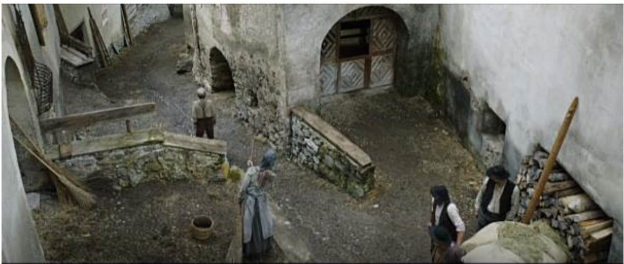
Abb. 24 – Aufsicht

Nachdem Dete Heidi hinter seinem Rücken mitnimmt, ist er sehr bestürzt und rennt sogar durch das Dorf, um Heidis Abreise zu verhindern (33:03-33:56). Nachdem ihm klar wurde, dass Heidi und Dete weggegangen sind, bleibt er stehen und nach einer Weile geht er, seine Tränen zurückhaltend, resigniert zurück zu seine Hütte. In der Szene, in der er stehen bleibt, wird er in der Vogelperspektive gefilmt, was die Intensität dieses Moments stark betont.