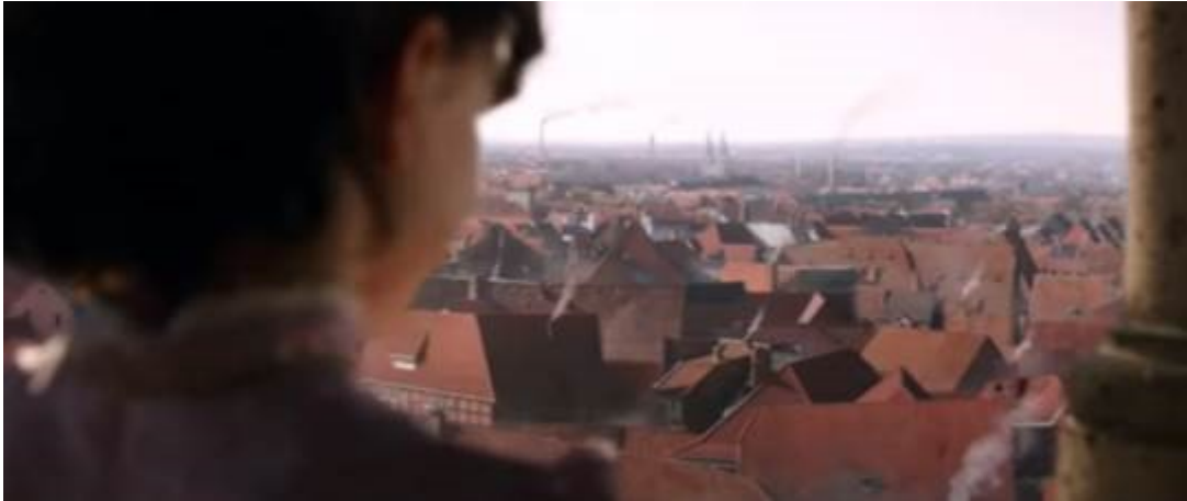
Abb. 4 – Heidi kann die Berge nicht sehen