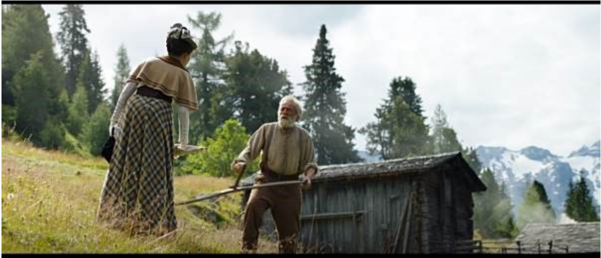
Abb. 23 – Der Großvater und Dete streiten sich

An dieser Stelle wird Heidis Abreise analysiert. Die Reaktion von dem Großvater, wenn Dete kommt und Heidi mitnimmt, unterscheidet sich in Spyris Werk und Gsponers Verfilmung sehr. In der Verfilmung lehnt der Großvater Heidis Abreise stark ab und streitet sich mit Dete (28:51-30:29). Während des Streits werden sie in der Untersicht gefilmt, wieder um die sehr erzwungene Atmosphäre zu betonen.