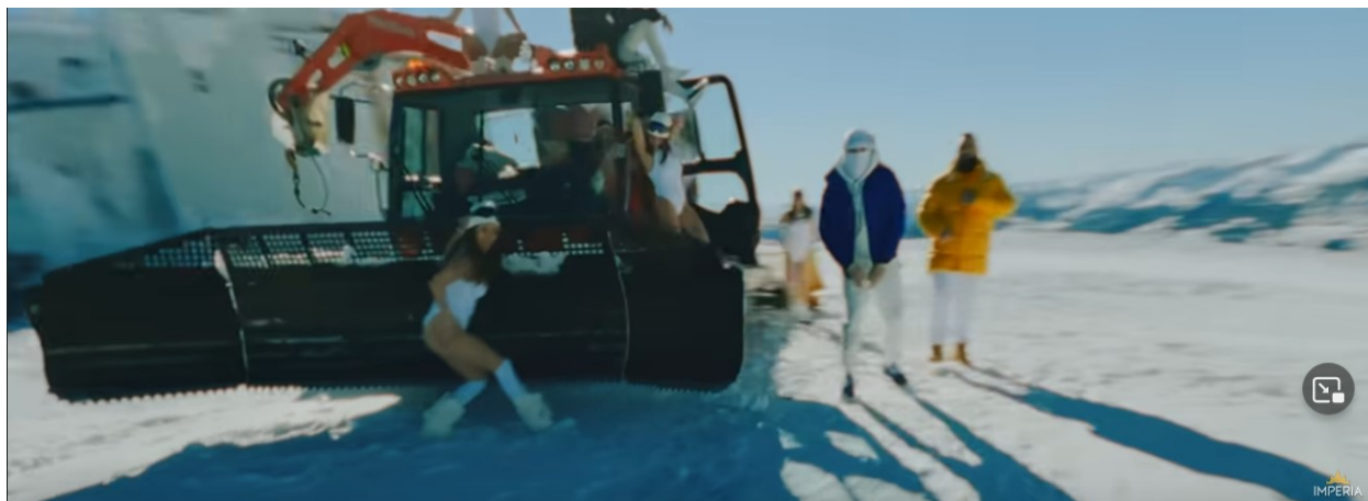
Slika 7. Slika iz glazbenog video spota „Criminal“ ( https://www.youtube.com/watch?v=x6fLkDdeqv8 )

U glazbenom video spotu „Criminal“ Jala Brata, Bube Corellia i RAF Camorae također se izmjenjuje nekoliko scena. Prva scena pokazuje pjevače na snježnoj planini okružene plesačicama odjevenim u kupaće kostime (Slika 8), zatim se prikazuje klub u kojem plesačice zavodljivo plešu, a Jala Brat, Buba Corelli i RAF Camre pjevaju ispred kamere (Slika 9), te scena koja pjevače prikazuje kako sjede na autima ispred restorana u kojem se kasnije zabavljaju (Slika 10, 11).