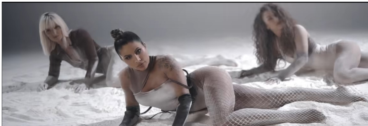
Slika 6. Slika iz glazbenog video spota „Pun mesec“ ( https://www.youtube.com/watch?v=xBjWe3POx5Y )

U glazbenom video spotu „Criminal“ Jala Brata, Bube Corellia i RAF Camorae također se izmjenjuje nekoliko scena. Prva scena pokazuje pjevače na snježnoj planini okružene plesačicama odjevenim u kupaće kostime (Slika 8), zatim se prikazuje klub u kojem plesačice zavodljivo plešu, a Jala Brat, Buba Corelli i RAF Camre pjevaju ispred kamere (Slika 9), te scena koja pjevače prikazuje kako sjede na autima ispred restorana u kojem se kasnije zabavljaju (Slika 10, 11).