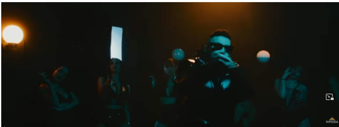
Slika 8. Slika iz glazbenog video spota „Criminal“ ( https://www.youtube.com/watch?v=x6fLkDdeqv8 )