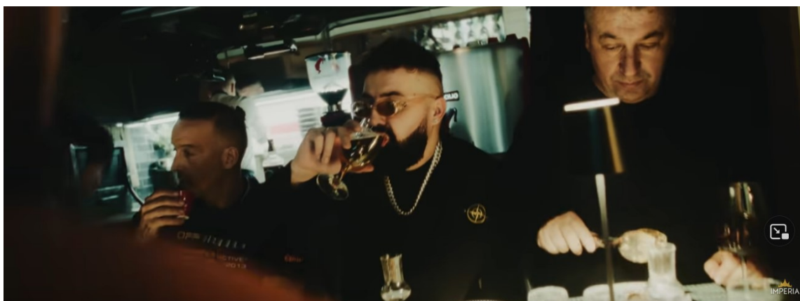
Slika 10. Slika iz glazbenog video spota „Criminal“ ( https://www.youtube.com/watch?v=x6fLkDdeqv8 )