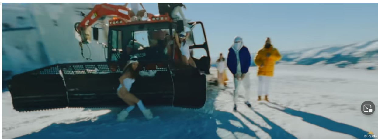
Slika 7. Slika iz glazbenog video spota „Criminal“ ( https://www.youtube.com/watch?v=x6fLkDdeqv8 )

U glazbenom video spotu „Criminal“ Jala Brata, Bube Corellia i RAF Camorae također se izmjenjuje nekoliko scena. Prva scena pokazuje pjevače na snježnoj planini okružene plesačicama odjevenim u kupaće kostime (Slika 8), zatim se prikazuje klub u kojem plesačice zavodljivo plešu, a Jala Brat, Buba Corelli i RAF Camre pjevaju ispred kamere (Slika 9), te scena koja pjevače prikazuje kako sjede na autima ispred restorana u kojem se kasnije zabavljaju (Slika 10, 11).