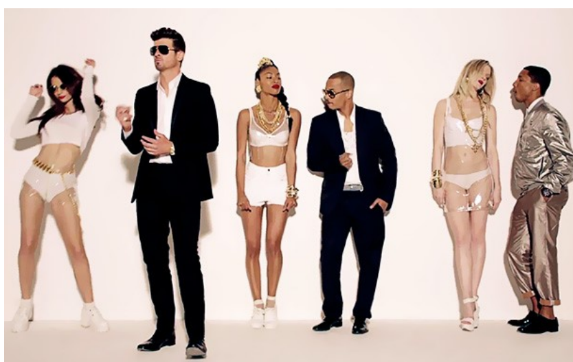
Slika 1. Slika iz glazbenog spota „Blurred lines“ ( https://www.youtube.com/watch?v=yyDUCILXUSU )

Kao primjer muškog pogleda u glazbenom video spotu može se navesti popularna pop pjesma Robina Thicke's, Pharrella Williamsa i T.I-a „Blurred Lines“ iz 2013. godine. U navedenom glazbenom video spotu muškarci su obučeni u odijela, dok su žene u donjem rublju ili su oskudno odjevene. U pojedinim dijelovima spota zbog kreacija u koje su žene odjevene stvara se privid da su gole. Također, u cijelom spotu žene zavodljivo plešu oko muškaraca, dok im je na licu vidljiva pasivnost i dosada (Cain, 2021).