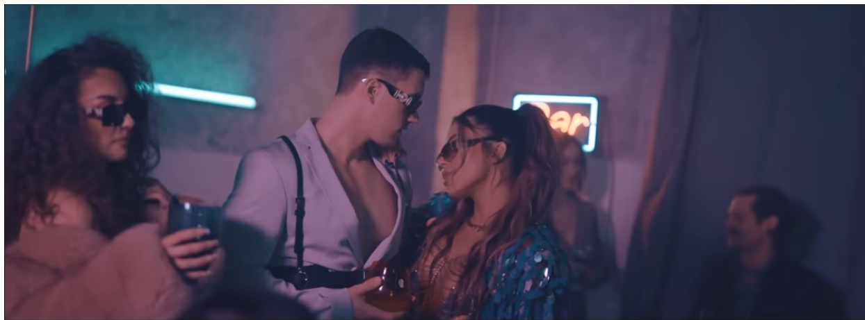
Slika 4. Slika iz glazbenog video spota „Pun mesec“ ( https://www.youtube.com/watch?v=xBjWe3POx5Y )