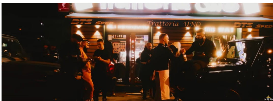
Slika 9. Slika iz glazbenog video spota „Criminal“ ( https://www.youtube.com/watch?v=x6fLkDdeqv8 )