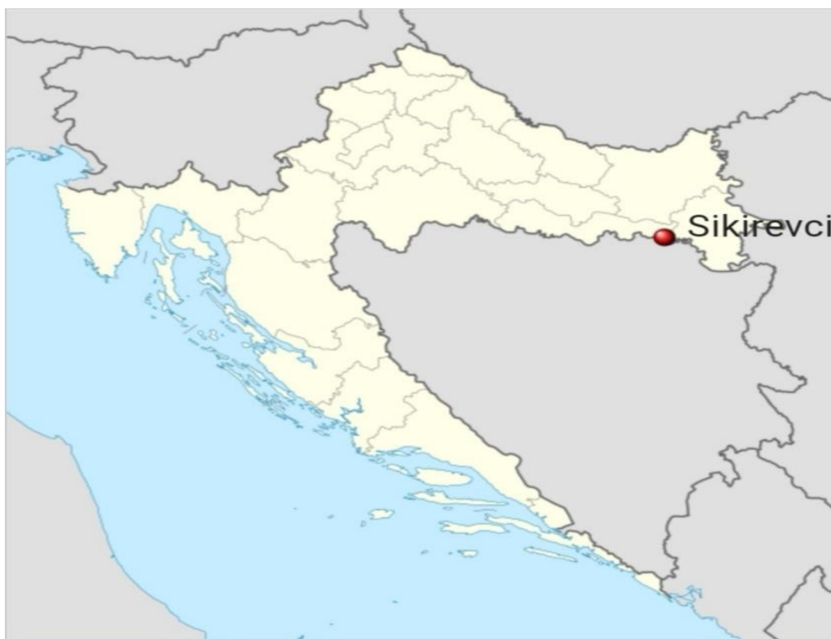
Prilog 4. Prikaz naselja Sikirevci na karti Republike Hrvatske

Sikirevci su naselje koje se nalazi na istočnom dijelu Brodsko-posavske županije uz rijeku Savu, 35 km jugoistočno od Slavenskog Broda te gotovo uz samu granicu s Bosnom i Hercegovinom. Smješteni su između autoceste Zagreb – Lipovac i rijeke Save, na regionalnoj cesti Osijek – BiH. Prema zadnjim podacima iz Državnog zavoda za statistiku iz 2021. godine u naselju živi 2.032 stanovnika, raspoređenih u dva naselja, Sikirevce, koji imaju 1.493 stanovnika i Jaruge koje imaju 539 stanovnika ( Općina Sikirevci, 2022. ). 6