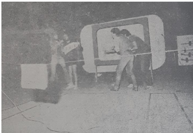
Slika 1 – „Telemanija broj šest“

S po dvije predstave gostovali su još i Kazalište „Lero“ iz Dubrovnika te Dramsko amatersko kazalište „Daska“ iz Siska. Dubrovčani su izveli „Kartoteku“ i predstavu „Partizanska pozornica“, a amateri iz Siska „Vodnika pobjednika“ i „Tri praščića“. Dramski dio programa otvorili su članovi Amaterskog kazališta „Joza Ivakić“ iz Vinkovaca koji su publiku dočekali s predstavom „Satir iliti divlji čovik“. 74