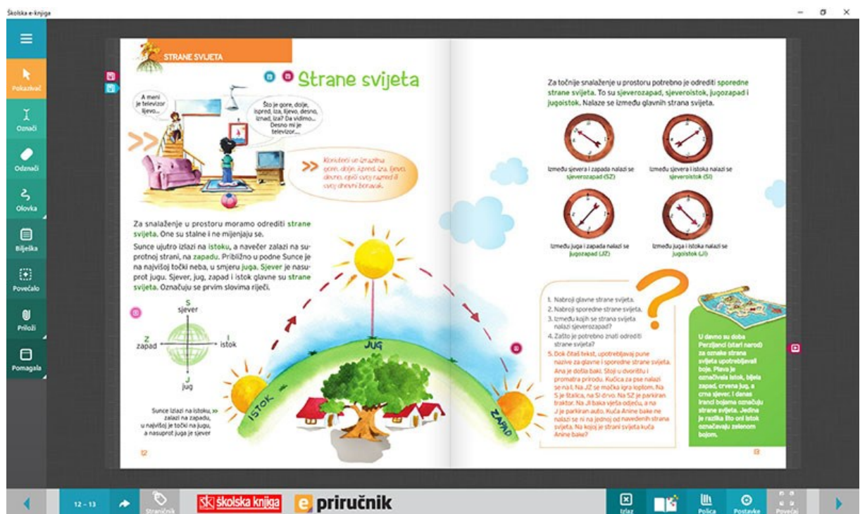
Slika 1. Primjer elektroničkog udžbenika geografije izdavača Školska knjiga

brojne fotografije, video i audiozapise, 3D animacije osmišljene su edukativne vježbe te virtualni eksperimenti kako bi učenici dobili što bolju sliku onoga što uče. 33 Ne treba zaboraviti na aplikaciju Školska e-knjiga koja je kreirana u skladu sa današnjim standardima modernog školstva kako bi učenici mogli pristupiti svojim elektroničkim udžbenicima. Nakon preuzimanja aplikacije potrebno je samo upisati korisničke podatke, a potom možete pregledavati knjige na virtualnim policama. Udžbenici obiluju mnogobrojnim funkcijama koje učenicima i učiteljima pomažu u obradi gradiva. Primjerice, na slici ispod (Slika 1) prikazana je funkcija pokazivač kojom se korisnik lako navigira, funkcija označi i odznači koja služi za isticanje bitnih dijelova teksta, funkcija olovka za crtanje i obilježavanje, bilješka gdje učenik može napisati svoje dodatne opaske, napomene ili neke nove informacije koje čuje na nastavi, a nisu sadržane u knjizi. Također, postoji i opcija uvećavanja te funkcija priloži ako učenik želi dodati vlastiti materijal udžbeniku. Od dodatnih pomagala može se pronaći kalkulator, školska ploča te štoperica.