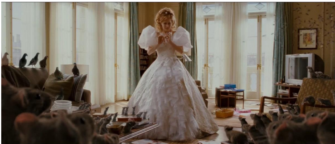
Slika 1. Gisellini pomoćnici za čišćenje

Treći klišej je taj da princeza svojim pjevanjem može dozvati životinje koje su u njevoj blizini. Životinje koje dođu princezi uglavnom su izgledom nježne i mekane - zečiči, srne, miševi i golubovi. U Začaranoj , kada Giselle želi dozvati pomoćnike pjevanjem u pomoć joj dođu ne zečiči ili miševi, nego štakori, muhe, gradski golubovi i žohari. Giselle je malo isprva iznenađena, no sva bića njeni su prijatelji, pa tako i 'štetočine' New Yorka. Uz njihovu pomoć uspijeva očistiti cijeli stan, no Robert i Morgan nisu toliko oduševljeni kada vide tko im čisti njihov dom.