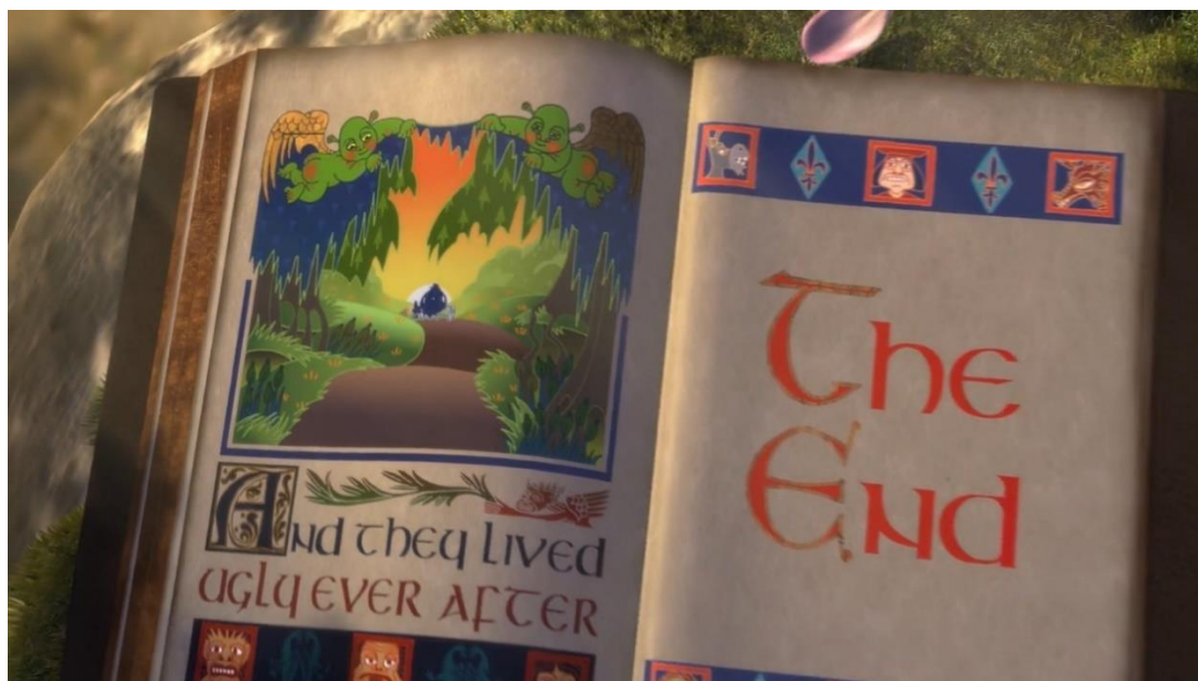
Shrek , 2001.