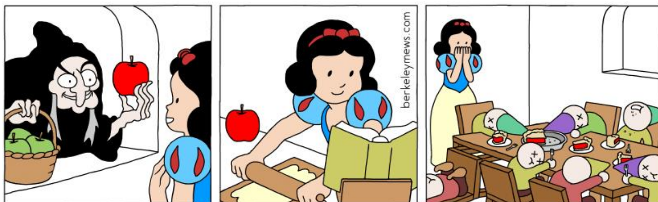
Slika 4. Berkeley Mews – Snow White