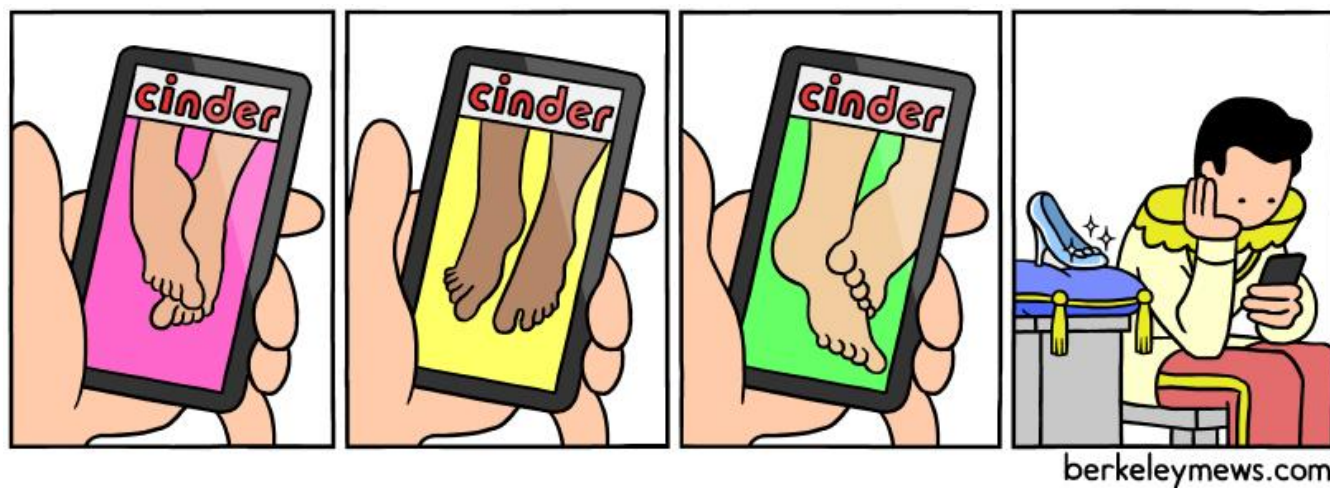
Slika 3. Berkeley Mews - Cinder