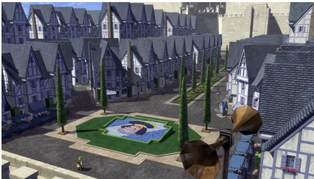
Slika 4. Dulocland

Najdirektniji primjer antidiznilendizma u Shreku je grad Duloc. Kada Shrek i Magare uđu u grad tražeći Lorda Farquaada, ostanu iznenađeni njegovim izgledom. Naime, grad „Duloc uspoređuje“ se s „Disneylandom uključivanjem nekih od poznatijih iritantnih zaštitnih znakova parka“ (Summers, 2020: 135). U sredini trga, ali i svugdje po gradu – izlozima, trgovinama - nalazi se freska Lorda Farquaada što oponaša sveprisutnost Mickeyja Mousea, Disneyjevu maskotu. Kako bi nešto više saznali o gradu, Magare povuče ručku kojom se otvara 'glazbena kutija' koja im prenosi informacije. Činjenica da pjesma zvuči iritantno, može se zaključiti kako se time parodira zabavna vožnja u Disneylandu It's a Small World After All čija pjesma pod istim nazivom je smatrana jednom od najiritantnijih pjesama ikada.