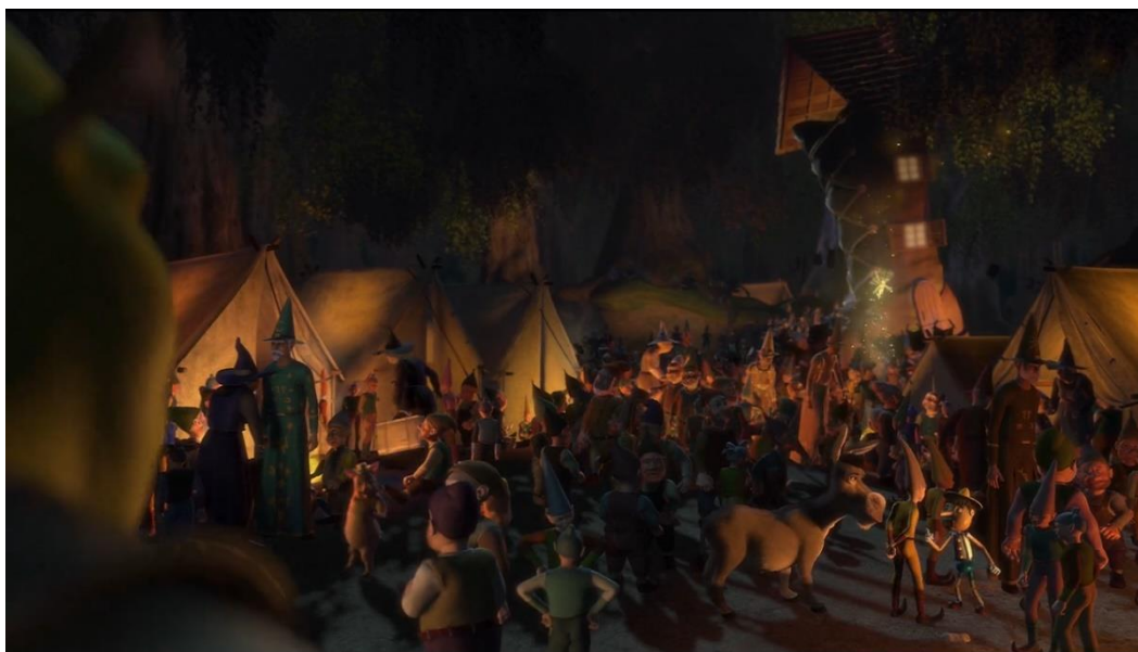
Slika 3. Izbjeglice u močvari

Uskoro nakon toga, Shrek nađe sav bajkoviti svijet u svojem dvorištu. Od tri prašćića do vilinskih kuma, u močvari nitko nije nedostajao. Shrek bijesno upita bajkovita bića zašto se oni nalaze baš u njegovoj močvari. Jedan od prašćića odgovara kako ih je Lord Farquaad deložirao riječima: „He huffed, and he puffed, and he... signed an eviction notice.“, tj. „Huknuo je i puhnuo je i... potpisao je obavijest o deložaciji“, te se time poziva na bajku, ali i na jedan od prvih kratkometražnih Walt Disneyjevih filmova, Tri prašćića . U bajci vuk kaže prašćićima: „Then I'll huff, and I'll puff, and I'll blow your house in!“, tj. „Onda ću huknuti i puhnuti i raznijeti ti kuću!“.