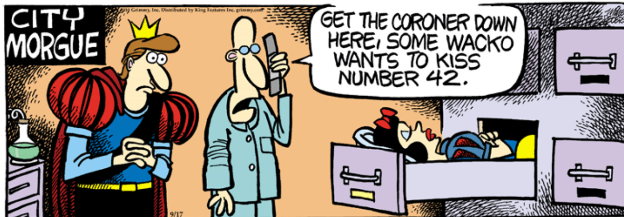
Slika 2. Mother Goose & Grimm – City Morgue

Izvor: https://www.grimmy.com/search-grimmy-archive-results.php