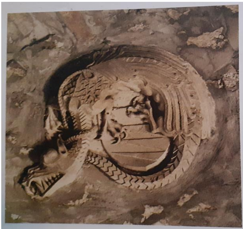
Slika 6. Grb viteškog reda zmaja koji se nalazi u zidu kule