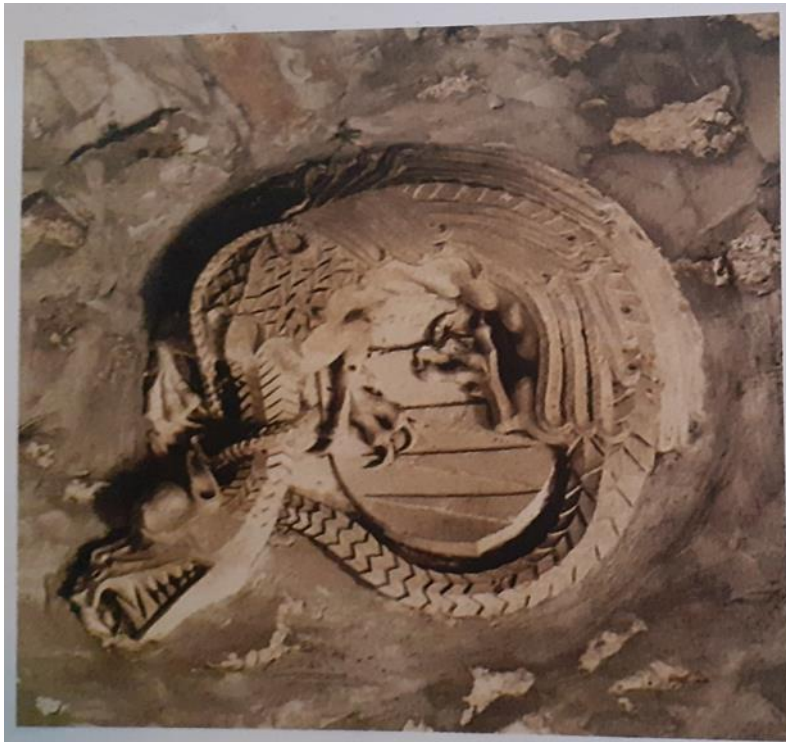
Slika 6. Grb viteškog reda zmaja koji se nalazi u zidu kule