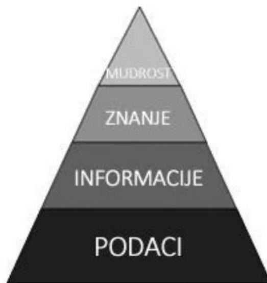
Slika 1. DIKW piramida.

Najjednostavniji grafički oblik za prikaz DIKW-hijerarhije je piramida, stoga se u knjižničnoj i informacijskoj znanosti još koristi i izraz informacijska piramida ili informacijska hijerarhija. 9 Kroz prikaz piramide lako je uočljiva “revolucija” podatka kojeg je najlakše definirati kao simbole. Na višoj razini piramide nalazi se informacija koja je, za razliku od podatka, procesuirana s ciljem koristi i nudi odgovore na pitanja “tko”, “što”, “gdje” i “kada”. Nadalje, razinu iznad predstavlja znanje koje označava primjenu podataka i informacija s razumijevanjem i odgovara na pitanja “kako” i “zašto”. Na samome vrhu piramide nalazi se mudrost koja uključuje etičke vrednote i vrednovanje shvaćanja. 10