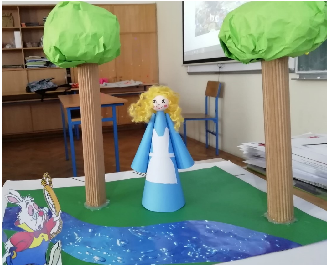
Slika 5. Alisa (Lewis Carroll, Alisa u Zemlji Čudesas ) 12