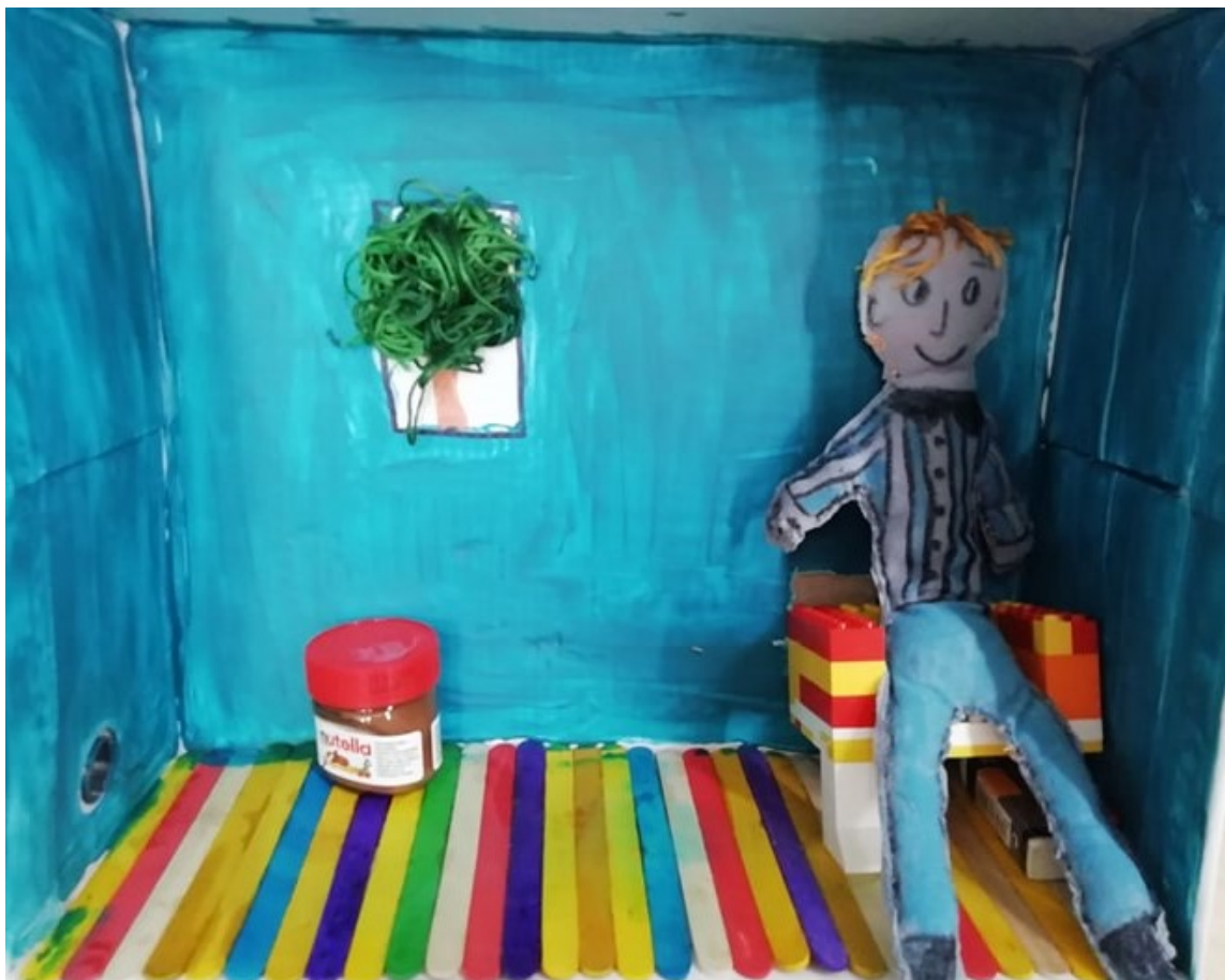
Slika 4. Nino (Josip Cvenić, Čvrsto drži joy-stick! ) 11