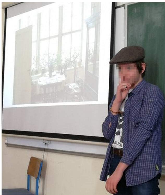
Slika 1. Ratko Milić/Koko (Ivan Kušan, serijal knjiga o Koku) 8