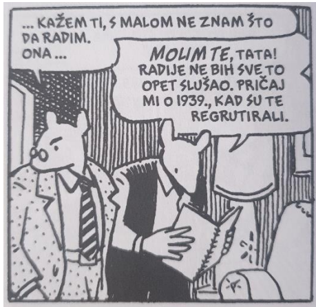
Slika 3. Maus , str. 46.