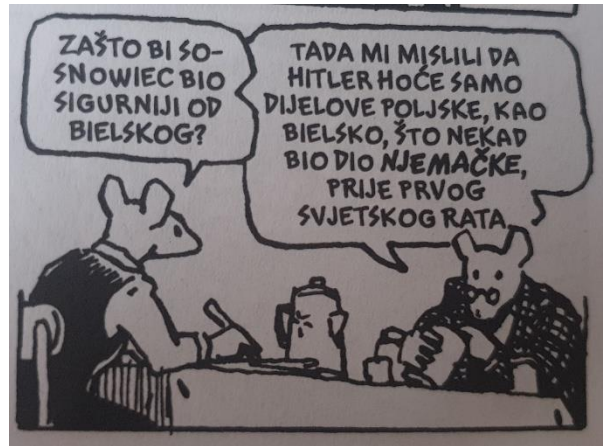
Slika 4. Maus , str. 39.

Josip Silić navodi da se u intervjuu novinar, uz pomoć svojih poticajnih riječi, „srođuje“ s jezikom intervjuirane osobe te tako postiže svojevrsnu jezičnu interaktivnu cjelinu (Silić, 2006: 79), što se vidi u Artovu jeziku kojim motivira Vlodeka, ali i usmjerava komunikaciju.