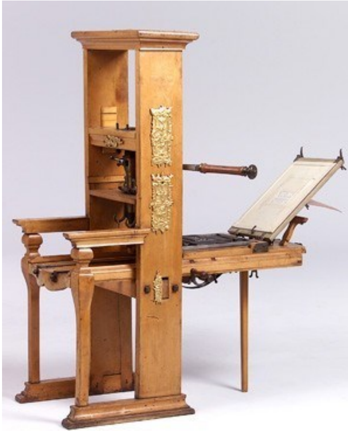
Bild 2 2 Der Buchdruck von Johannes Gutenberg

Obwohl die Chinesen schon im 6. Jahrhundert klein geschnittene Holzteile zur gleichen Idee benutzt haben, dauerte es viel länger, die Bretter für längere Texte und Werke auszuschneiden, als man es mit dem Buchdruck von Gutenberg brauchte. Früher brauchte man sehr viele Pergamente aus Tierhaut, um ein Buch zu fertigen. Bei der Druckerpresse wurde eine geschnittene Form mit Farbe bestrichen und dann gegen einen Papierbogen gepresst. Viel einfacher und preiswerter noch dazu. Gutenberg benutzte in seiner Umsetzung viele einzelne Buchstabenstempel, die er dann zum Gebrauch zusammengesetzt hatte. Jetzt hatte er nur noch ein Problem; wie kann er mehrere Buchstaben herstellen, die gleich aussehen würden. Die Lösung fand er in dem Handgießinstrument, in das er heißes, flüssiges Metall eingoss, wobei komplett gleiche Buchstaben entstanden.