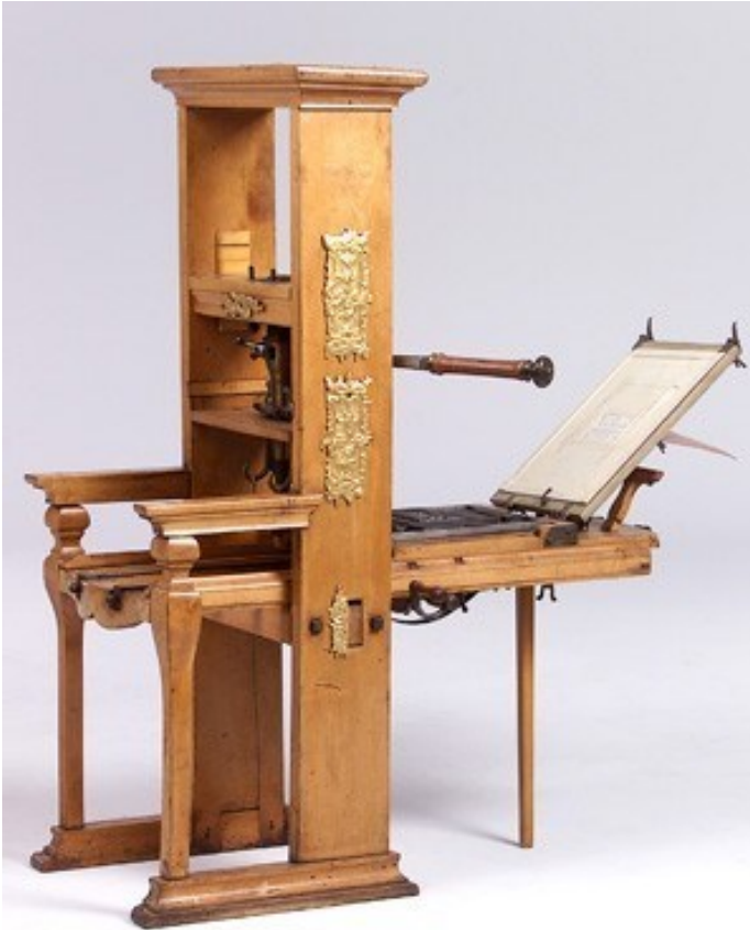
Bild 2 2 Der Buchdruck von Johannes Gutenberg

Obwohl die Chinesen schon im 6. Jahrhundert klein geschnittene Holzteile zur gleichen Idee benutzt haben, dauerte es viel länger, die Bretter für längere Texte und Werke auszuschneiden, als man es mit dem Buchdruck von Gutenberg brauchte. Früher brauchte man sehr viele Pergamente aus Tierhaut, um ein Buch zu fertigen. Bei der Druckerpresse wurde eine geschnittene Form mit Farbe bestrichen und dann gegen einen Papierbogen gepresst. Viel einfacher und preiswerter noch dazu. Gutenberg benutzte in seiner Umsetzung viele einzelne Buchstabenstempel, die er dann zum Gebrauch zusammengesetzt hatte. Jetzt hatte er nur noch ein Problem; wie kann er mehrere Buchstaben herstellen, die gleich aussehen würden. Die Lösung fand er in dem Handgießinstrument, in das er heißes, flüssiges Metall eingoss, wobei komplett gleiche Buchstaben entstanden.