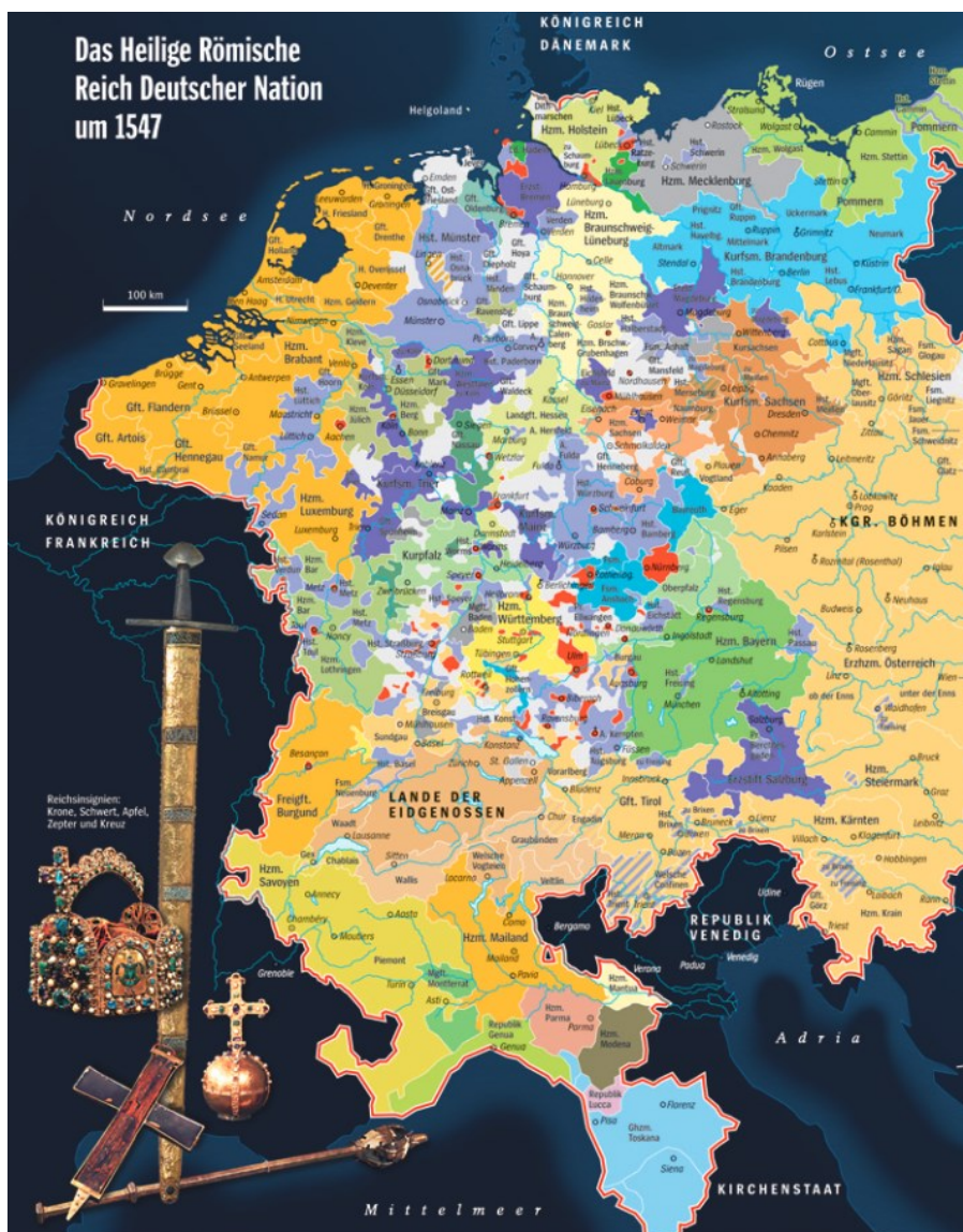
Bild 1 1 Das Heilige Römische Reich deutscher Nationen

Um das Jahr 1600 nahm das Heilige Römische Reich deutscher Nation den größten Teil der Zentraleuropa. Das Reich wurde in zahlreiche größeren und kleineren Herrschaften und reichsfreie Städte gegliedert. Seit den Reformationen war dieser Bereich in 2 größere Teile zersplittert; auf einer Seite waren die evangelischen im Norden, und auf der anderen Seite die katholischen Herrschaften im Südosten.