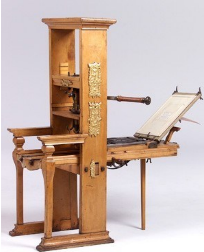
Bild 2 2 Der Buchdruck von Johannes Gutenberg

Obwohl die Chinesen schon im 6. Jahrhundert klein geschnittene Holzteile zur gleichen Idee benutzt haben, dauerte es viel länger, die Bretter für längere Texte und Werke auszuschneiden, als man es mit dem Buchdruck von Gutenberg brauchte. Früher brauchte man sehr viele Pergamente aus Tierhaut, um ein Buch zu fertigen. Bei der Druckerpresse wurde eine geschnittene Form mit Farbe bestrichen und dann gegen einen Papierbogen gepresst. Viel einfacher und preiswerter noch dazu. Gutenberg benutzte in seiner Umsetzung viele einzelne Buchstabenstempel, die er dann zum Gebrauch zusammengesetzt hatte. Jetzt hatte er nur noch ein Problem; wie kann er mehrere Buchstaben herstellen, die gleich aussehen würden. Die Lösung fand er in dem Handgießinstrument, in das er heißes, flüssiges Metall eingoss, wobei komplett gleiche Buchstaben entstanden.