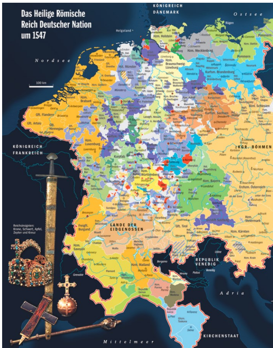
Bild 1 1 Das Heilige Römische Reich deutscher Nationen

Um das Jahr 1600 nahm das Heilige Römische Reich deutscher Nation den größten Teil der Zentraleuropa. Das Reich wurde in zahlreiche größeren und kleineren Herrschaften und reichsfreie Städte gegliedert. Seit den Reformationen war dieser Bereich in 2 größere Teile zersplittert; auf einer Seite waren die evangelischen im Norden, und auf der anderen Seite die katholischen Herrschaften im Südosten.