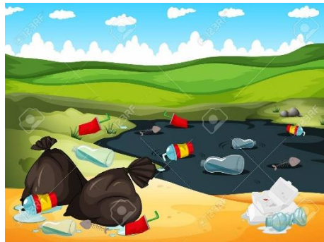
Slika 2. Onečišćena priroda ( https://images.app.goo.gl/i9fJB1BK16eCF1zE9 )