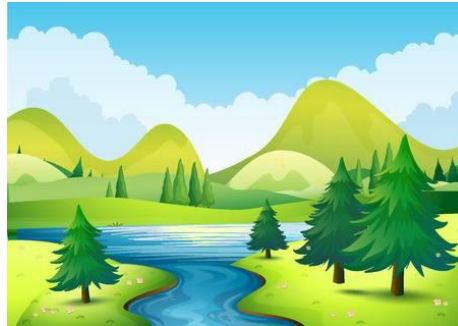
Slika 1. Čista priroda ( https://images.app.goo.gl/EvQLAs2Kg3wfDF7E7 )

Na svako postavljeno pitanje djeca odgovaraju podižući odgovarajući štapić. Voditelj ukratko prokomentira s djecom njihove odgovore nakon svakog postavljenog pitanja.