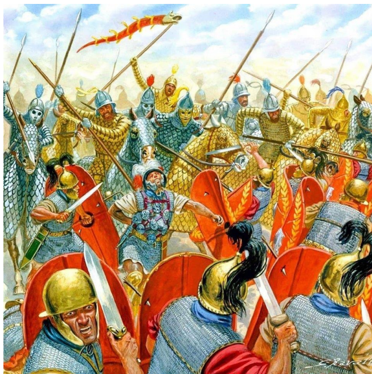
Prilog 2. Umjetnički prikaz napada seleukidskih katafrakti na desno krilo rimske vojske

lijevom krilu bojnim kočijama nije uspio jer su ih zaustavile strijele kretskih strijelaca nakon čega su pri povlačenju omele juriš katafrakti koje je zatim napalo rimsko i pergamsko konjaništvo i natjeralo ih u bijeg 59 . U isto se vrijeme vodio sukob na sredini bojišta koji se odvijao u korist Rimljana i Pergamljana – nakon što su otjerali neprijateljske čarkare s bojišta i uspostavili konjaničku nadmoć nad lijevim bokom, rimski i pergamski čarkari su umjesto gustih blokova falangi počeli gađati slonove iza njih koji su poludjeli i počeli gaziti grčke vojnike koji su bili prisiljeni povući se s bojišta, razbijenih formacija, prilikom čega je vojsku u povlačenju dostigao i Antioh III. koji je predaleko sa svojom konjicom gonio razbijeno desno krilo neprijatelja, te nije imao vremena pomoći ostatku svoje vojske 60 . Činjenica da su Rimljani toliko efikasno izašli na kraj s bojnim slonovima može se pripisati bitki kod Zame protiv Hanibala koja se zbila samo 14 godina ranije, a zanimljiva je činjenica da se bojni slonovi nakon bitke kod Magnezije više gotovo uopće nisu u velikim brojevima koristili tijekom budućih ratova na prostoru Bliskog Istoka 61 .