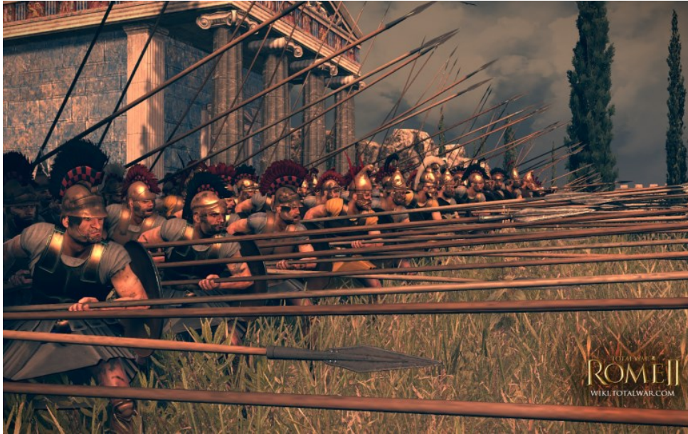
Prilog 3. Umjetnički prikaz seleukidske falange iz videoigre Total War Rome 2 engleskog studija The Creative Assembly

opremljena u iranskom stilu, te koristila neke od najvećih i najtežih konja u antičkom svijetu, no nije poznato da li je funkcionirala kao jedinica katafrakti 98 .