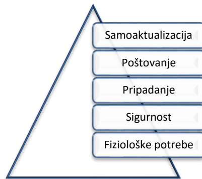
Slika 1: Maslowljeva hijerarhija potreba

Izvor: Weihrich H. & Koontz H (1994).; Menedžment, Zagreb: Mate, str. 469.