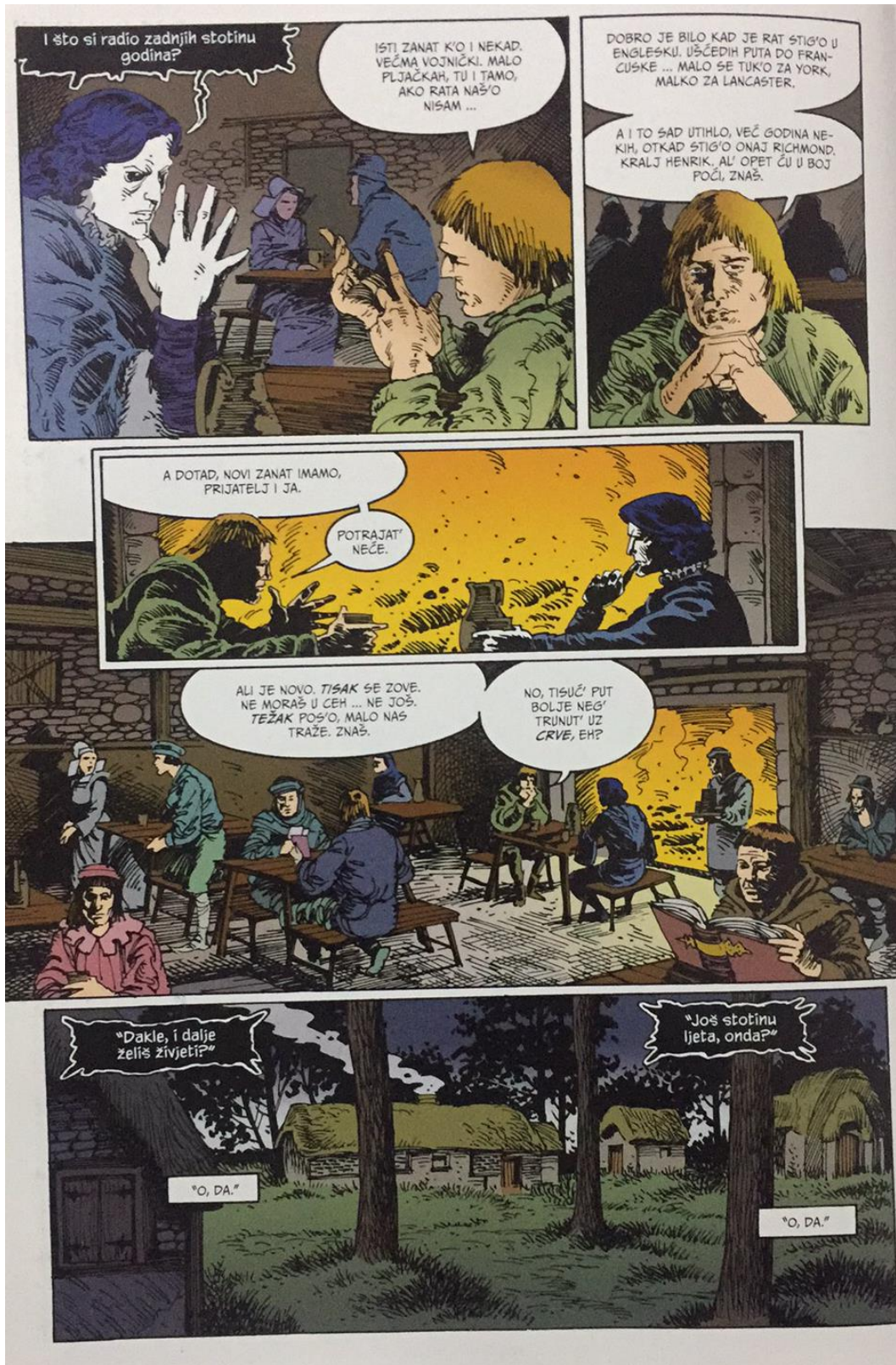
Slika 4: Kadrovi iz stripa Neila Gaimana (2014.) „Sandman“