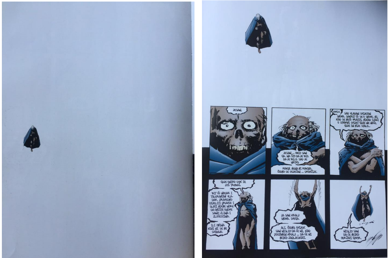
Slika 1 i 2: Kadrovi iz stripa Neila Gaimana (2014.) „Sandman“

Verbalni dio stripa izražava se oblačićima. Verbalni iskaz može biti izraz pripovjednog subjekta ili nekog od likova. Tekst pripovjednog subjekta najčešće je omeđen kvadratićem, dok iskazi likova mogu biti omeđeni oblačićem ili stiliziranim omeđjem. Stiliziranje iskaznog oblačića koristi se kako bi se prikazalo psihičko i emocionalno stanje lika, intonacija koja bi se proizvela govornim iskazom te u svrhu karakterizacije lika njegovim svojstvenim stilom. Lik Sandman ima jedinstven oblačić, crne je boje koja može simbolizirati tamu i noć što su motivi fantastičnoga diskurza. Osim toga, njegov je iskazni oblačić i krivudavog omeđja čime se pridonosi ugođaju fantastičnoga svijeta snova oblikovanjem simbolične deformirane krivulje, umjesto ravne linije, kojom je Sandmana moguće predočiti kao san koji govori.