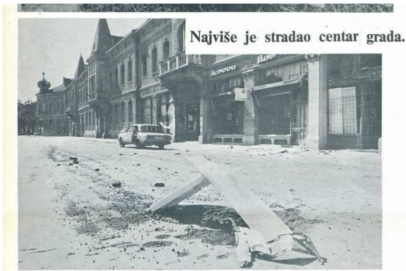
Prilog 1. Rupa od projektila u samom centru grada Vinkovaca, (Vinkovački list, 4.10.1991.)

Ratna zbivanja nisu se osjetila samo na bojišnici, nego i u svim djelovima životima građana. Sve gradske civilne službe i institucije bile su uključene u ratna zbivanja, ali i same su bile meta istih.